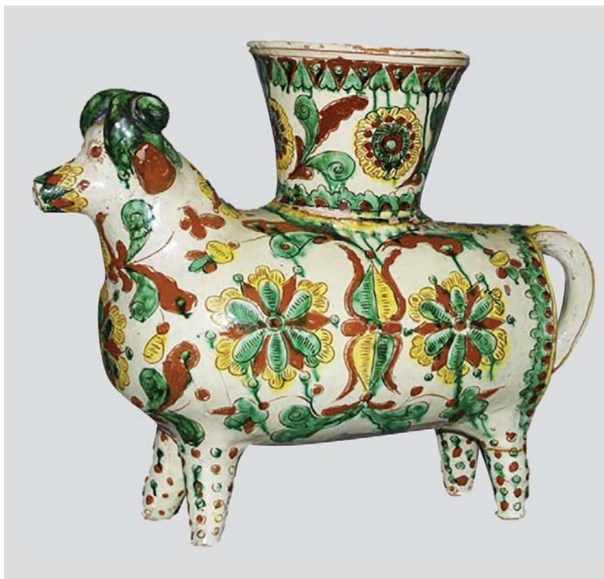
Рис. 5. Скульптура-кашпо «Баран». Авт. Цвілик П. Й. Сер. ХХ ст. Глина, ангоб, полива. Випалювання, розпис. Інв. № КН-143/157 КС-743. НМНАПУ

Після Другої світової війни асортимент виробів подружжя Цвіликів став ще різноманітнішим. Декоративно-побутовий та скульптурний посуд, настінні прикраси, скульптуру малих форм вони збагачували новими пластичними формами та орнаментально-квітковими розписами, що символізували життя народу на Прикарпатті. (Рис. 5)