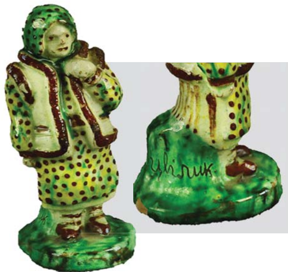
Рис. 4. Скульптура «Гуцулка».

Авт. Цвілик П. Й. Перша пол. ХХ ст. Глина, ангоб, полива. Випалювання, розпис. Інв. № КН-143/102 КС-694. НМНАПУ