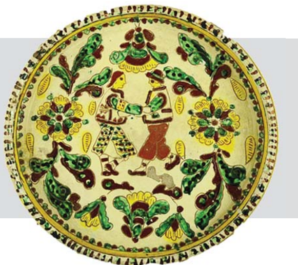
Рис. 3. Таріль настінний.