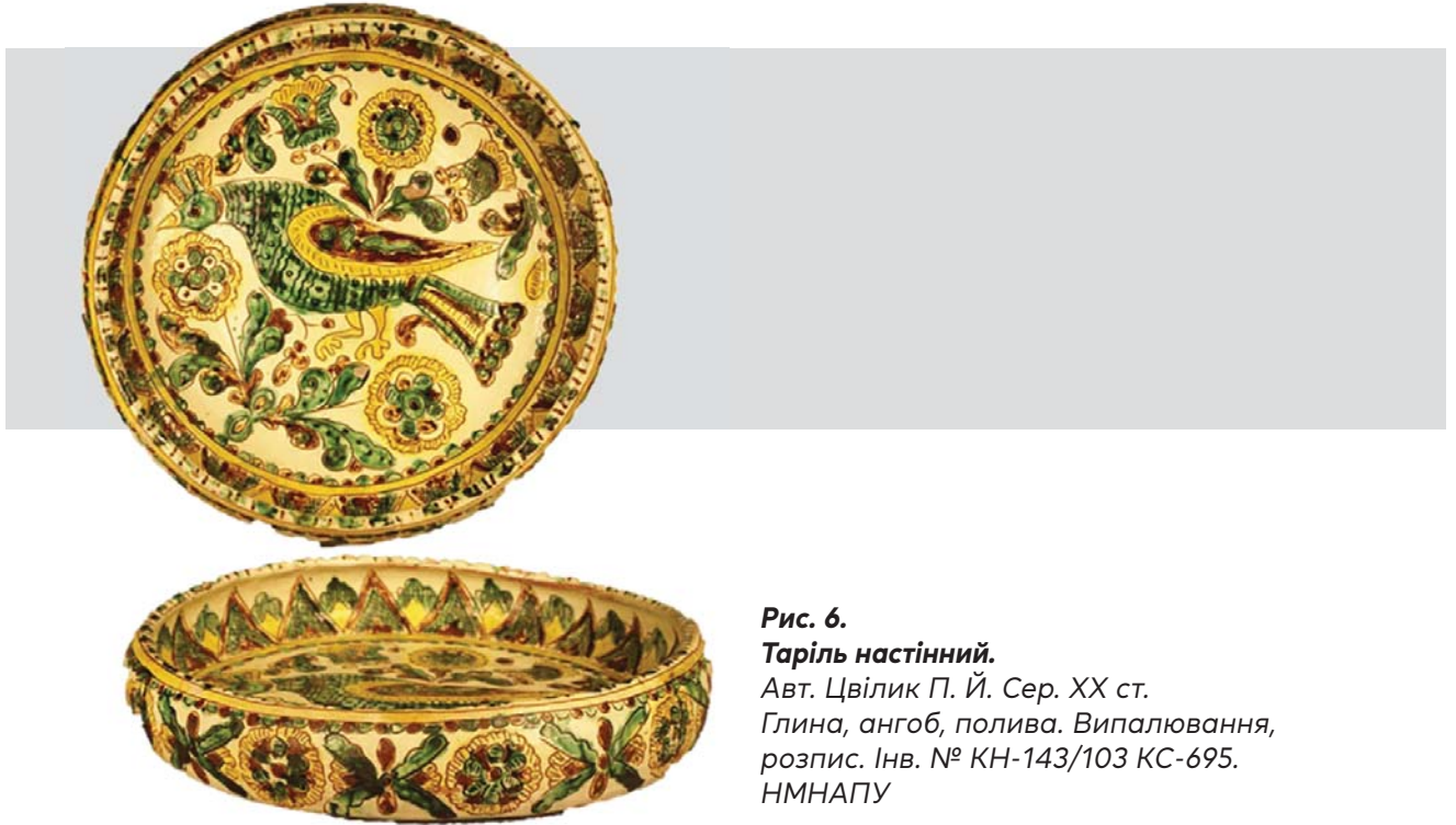
Рис. 6. Таріть настінний.

Прагнучи надати декоративним композиціям своєрідного сучасного художньо-образного звучання, Григорій і Павлина почали вводити в малюнок рослинного орнаменту мотив білогрудого голуба – символу миру. Цікаве декоративне оздоблення птаха бачимо на настінному тарілі з високими заокругленими берегами (КН-143/103 КС-695). Його тулуб і крила розписані багатьма хвильками та крапочками, які разом із кулястими квітами й гілками створюють цілісний орнаментальний малюнок 20 . (Рис. 6)