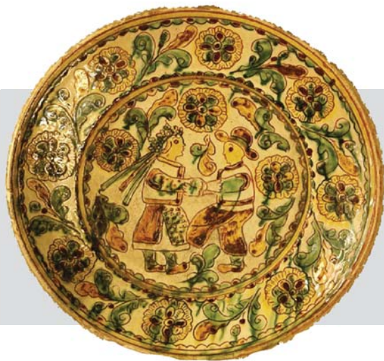
Рис. 2. Таріль настінний.

Авт. Цвілик П. Й. Сер. XX ст. Глина, ангоб, полива. Випалювання, розпис. Інв. № KB-143/298 КС-749. НМНАПУ