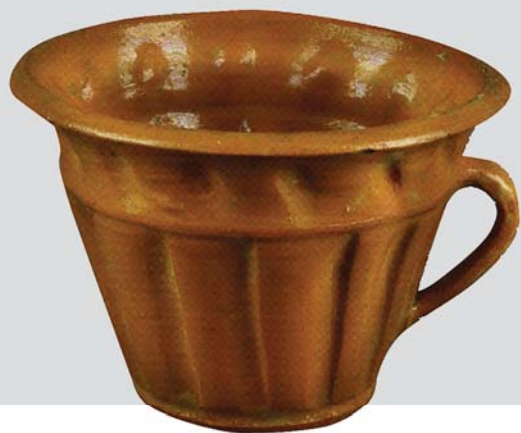
Рис. 18. Бабчер (пасківник). Авт. Цвілик П. Й. 1930-ті рр. Глина, полива. Випалювання. Інв. № КН-409/159 КС-3427. НМНАПУ

корпус посудини гармонійно переходить у пластичну витончену вузьку ручку, а рельєфний орнамент, поєднуючись із вальцеподібною формою бабчера, створює злагодженість пластичних мас, надаючи художньої довершеності всьому виробу. (Рис. 18)