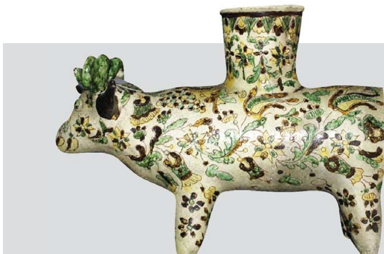
Рис. 19. Баранець-підвазонник. Авт. Цвілик П. Й. Сер. ХХ ст. Глина, ангоб, полива. Випалювання, розпис. Інв. № КН-143/158 КС-744. НМНАПУ

У фондовій колекції НМНАПУ також зберігаються скульптурні роботи художниці, виконанні з тими самими майстерністю та художнім смаком, що особливо простежуються в майстерному поєднанні форми з орнаментальним оформленням. Цікавими є форма й розпис декоративного баранця-підвазонника (КН-143/158 КС-744). (Рис. 19)