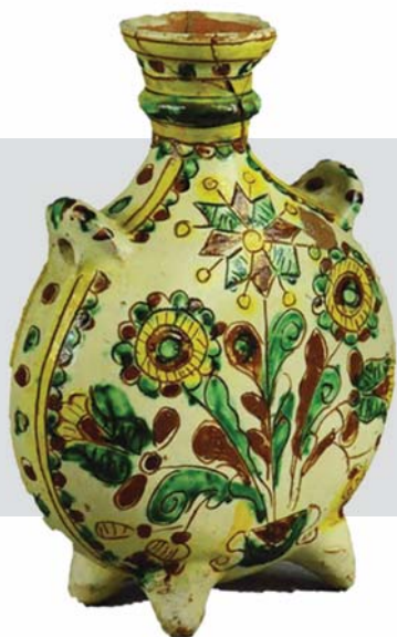
Рис. 1. Баклажок.

Талановита майстриня виготовляла миски, полумиски, глечики, баклаги, свічники, скульптури, дитячі іграшки 11 . (Рис. 1)