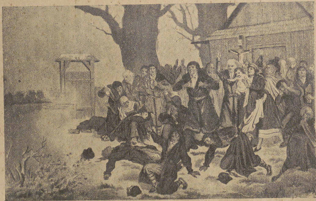
Підляські Мученики 1875 р.