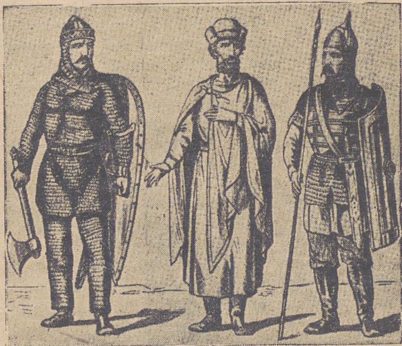
Князь і дружинники.

Як бачимо зі сказаного попередю, Київська Держава привязувала найбільшу вагу до торго- вельних справ: князь Ігор старається виеднати для своїх купців якнайкращі торговельні умови