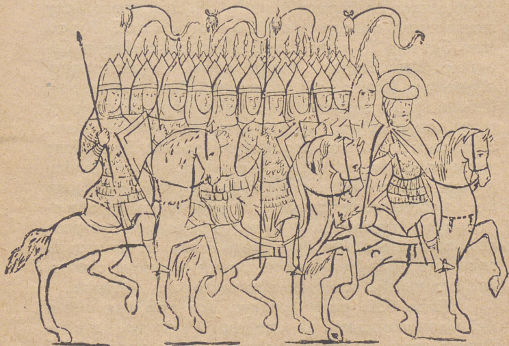
Князь із військом у поході.

нападали добичники — чи то степові кочові племена, чи просто професійні (фахові) розбишаки. Найкраще отже міг торгувати той купець, що zorganizував собі добру охорону своєї каравани (валки), або своїх човнів. Варяги якраз і становили дуже добру воєнну силу й вони були охороною для свого власного товару. Це були отже купці,