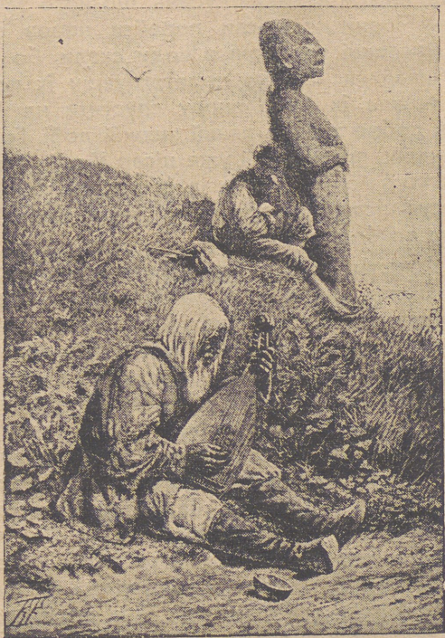
Камяна баба, нагробний пам'ятник кочових степовиків.

Тепер Ігор опановує помалу деревлянську територію на правім березі Дніпра. На південь від деревлян, як знаємо, жили улличі й із ними також