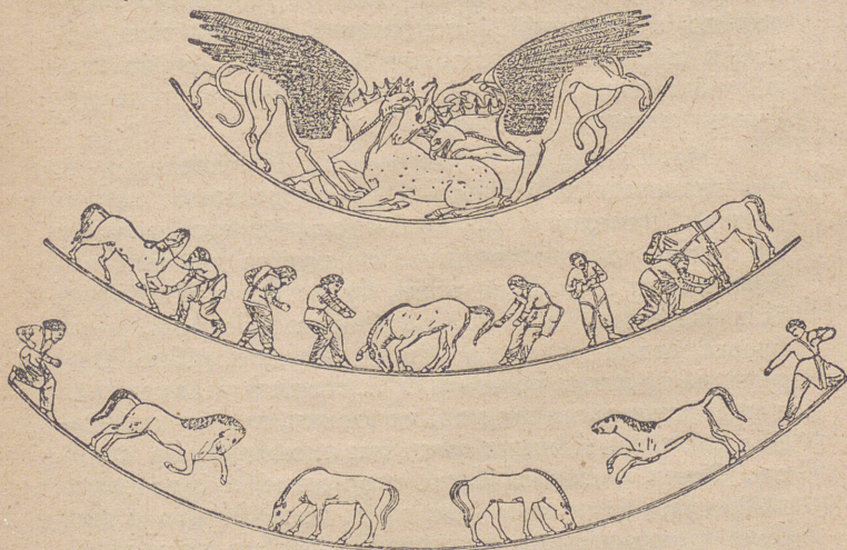
Скити ловлять диких коней (малюнок на старій вазі)

це поганські вірування тодішнього населення). Таргітаон мав трьох синів: Ліпоксая, Арпоксая і Колляксая. В часі життя цих синів злетіли з неба золоті знаряди: плуг, ярмо до запрягу волів, сокирка і чарка, й упали на землю. Вони переходували пізніше в нашій країні як найбільші святощі. Ці перекази вказують з одного боку на це, що