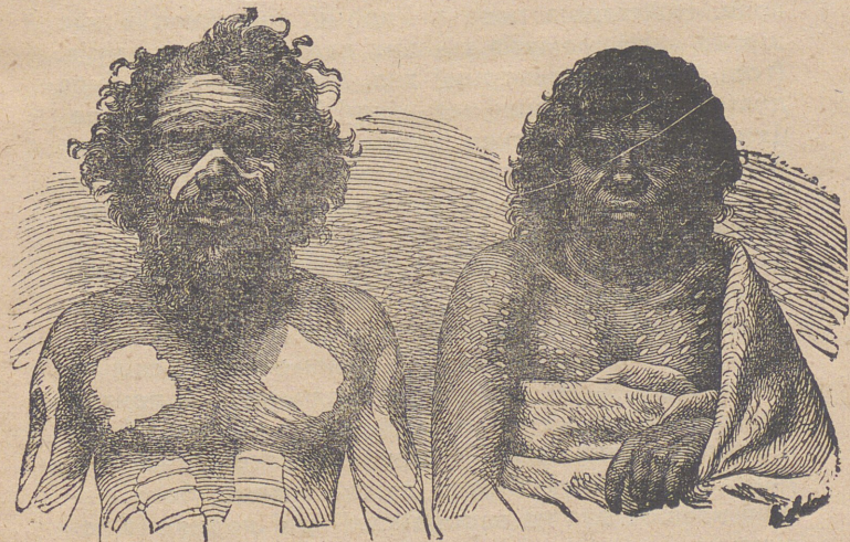
Дикі люди первісної культури

стями, а умовими здібностями звірини. Ніяких „малполюдів”, себто істот посередних між малпою і людиною, вченим не вдалося знайти — очевидно їх і не було. Тому коли хочемо уявити собі вигляд первісної людини, то її останки, що їх знаходимо в землі, не дають права підмальовувати її під звірину. Первісна людина була подібна до