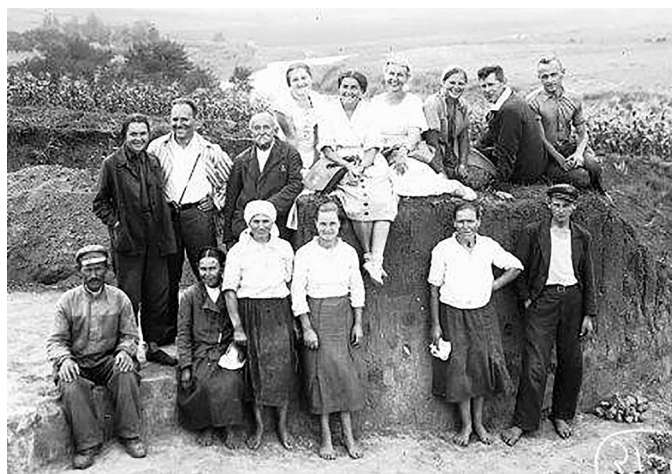
Рис. 11. Учасники розкопок у Володимирівці. 1936 р.