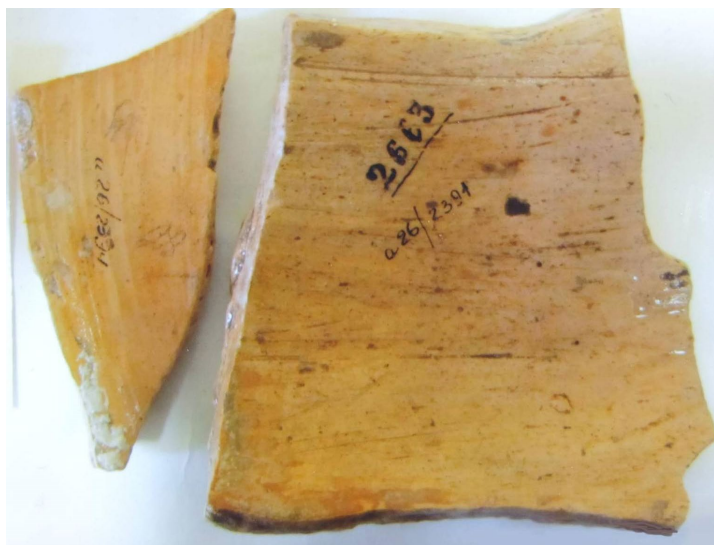
Рис. 2. Фрагменти зі старими номерами.

Під час реставраційних робіт у фондах НМІУ було знайдено ще 2 фрагменти означеної посудини, на одному з яких чорною тушшю був написаний старий номер – № 2 663, що, як згодом з'ясувалося, належав Уманському краєзнавчому музею (Рис. 2).