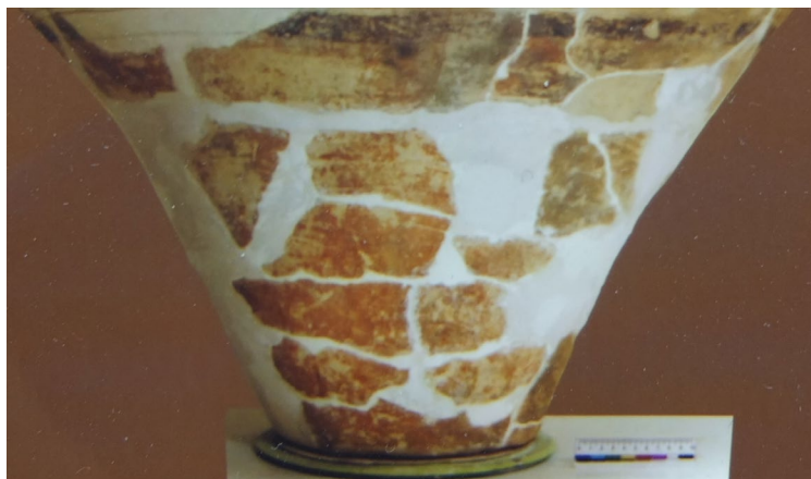
Рис. 3. Шари глиняних смуг.

Всі етапи реставрації супроводжувалися фотофіксацією. Після реставрації розміри посудини становили 68 см у висоту та 73 см у діаметрі (Рис. 5).