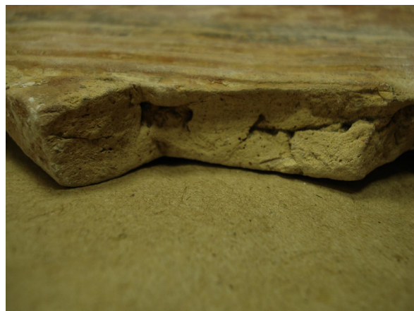
Рис. 4. Повітряні пустоти на стиках.