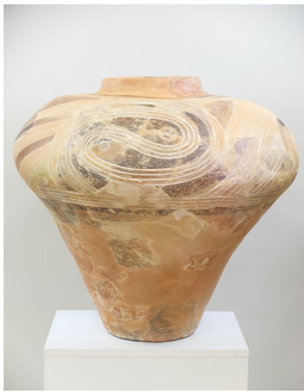
Рис. 5. Після реставрації.