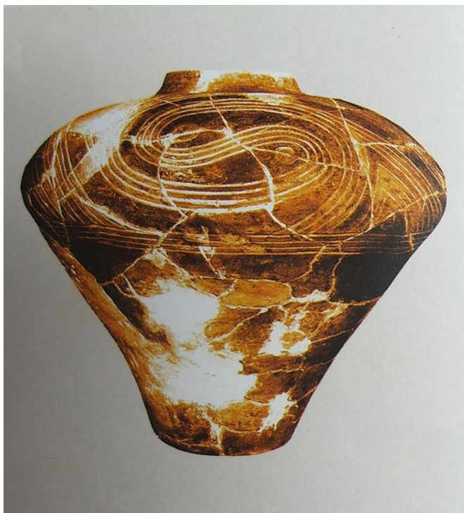
Рис. 13. Архівне фото.

Перед вивезенням до Німеччини для зменшення об’ємів посудин їх було розбито або демонтовано. Після Другої світової війни, в 1947 р. ешелон із пам’ятками повернувся в Україну – до Державного республіканського музею УРСР у Києві (нині – НМІУ) 12 . Зерновик надійшов до музею у фрагментованому стані та без паспортних даних і десятиліттями чекав на реставрацію. Нині цей унікальний експонат прикрашає експозицію музею.