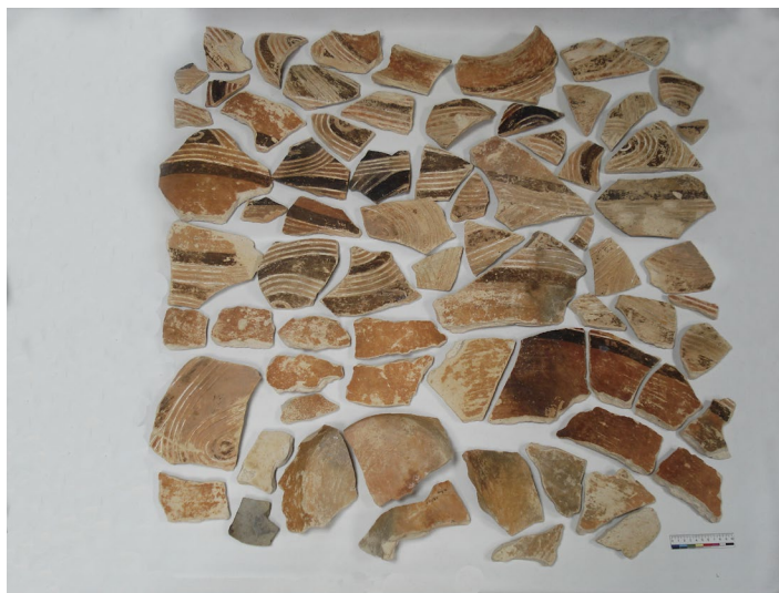
Рис. 1. До реставрації.

Пам'ятка надійшла на реставрацію у вигляді розвалу (Рис. 1). На деяких із 72 фрагментів чорною тушшю в 1970-х рр. було зазначено: "а 212 / 815 Волод. 46" (с. Володимирівка, розкопки 1946 р.).