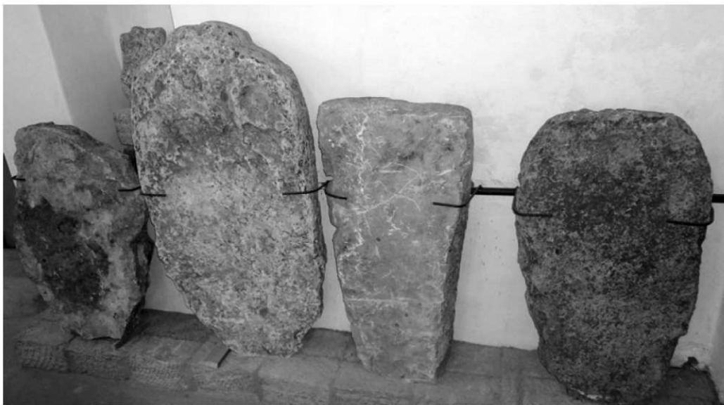
Рис. 4. Нові надходження лапідарних пам'яток енеоліту – бронзи у відкритому фондосховищі музею

Тим часом поповнення лапідарної колекції продовжувалося. У 1989 р. археологічна експедиція під керівництвом наукового співробітника відділу охорони пам'яток музею Олександра Гаврилова знайшла під час розкопок кургану поблизу села Чернобаївка Білозерського району три антропоморфних стели, що належать до часів ямної культурно-історичної спільності (рис. 2). Їх було знайдено під час дослідження четвертого поховання кургану № 1 на околиці села в закладі поховального комплексу, який зараховують до дніпровсько-інгулецького варіанту ямної культури [5, с. 54].