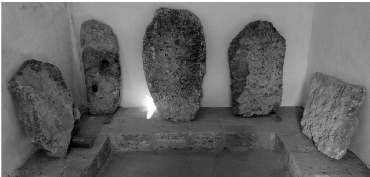
Рис. 3. Нові надходження лапідарних пам'яток енеоліту – бронзи у відкритому фондосховищі музею

знахідка – в іншому кургані неподалік від неї [4, с. 9].