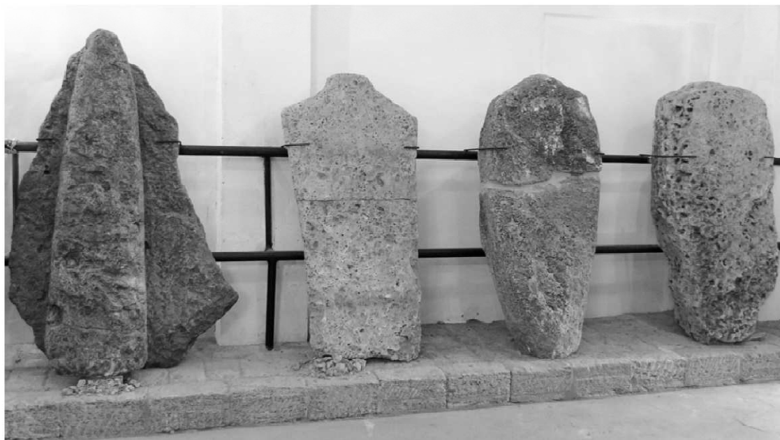
Рис. 2. Найдавніші пам'ятки першого залу відкритого лапідарного фондосховища. Ліворуч – фаллоїдний камінь, решта – знахідки О. Гаврилова

товщина пам'ятки). На тудубі стели бачимо схематичне зображення рук та фігури дитини [4, с. 6].