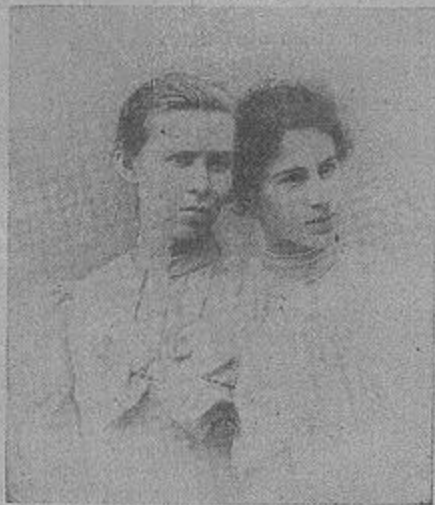
Л. Українка з А. Драгоманівною (репродукується вперше)

Пам'ятаю, як батько, відпровадивши, зовсім спокійно на вигляд, Лесю з матір'ю в подорож до Відня, як тоді думали, на операцію, замкнувся в себе в хаті і, думаючи, що ніхто з нас молодших не почує, ридав від жалю та турботи. Пам'ятаю теж, як він після смерті сина Михайла тримався на вигляд нібито спокійно і все дбав про те, щоб заспокоїти нас, та все вмовляв нас заспокоювати та підтримувати матір в її безмежному горі. А його самого те горе так підрізало, що коли я, після похорону брата Михайла,