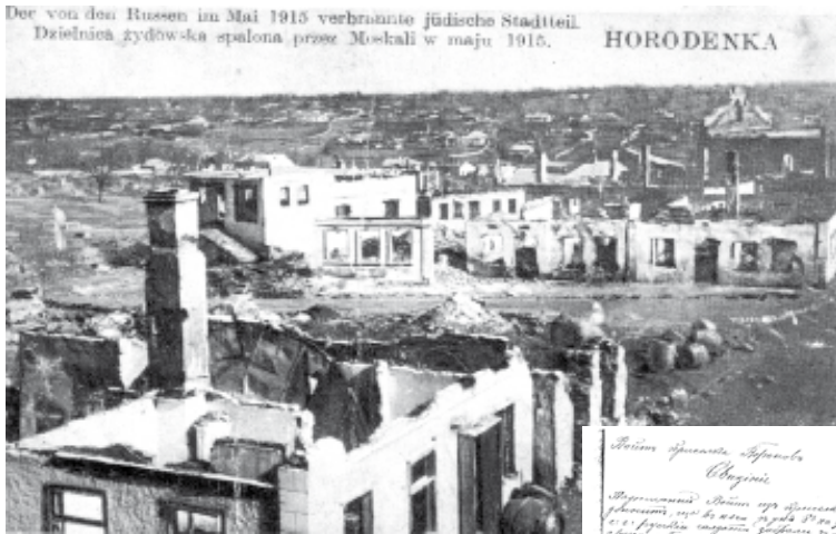
Зруйновані у травні 1915 р. солдатами царської Росії синагога та прилеглі до неї будинки у центрі м. Городенки.

Скарга вїта присїлка Воронїв Городенківського повіту командуванню російської армії 30 жовтня 1916 р.