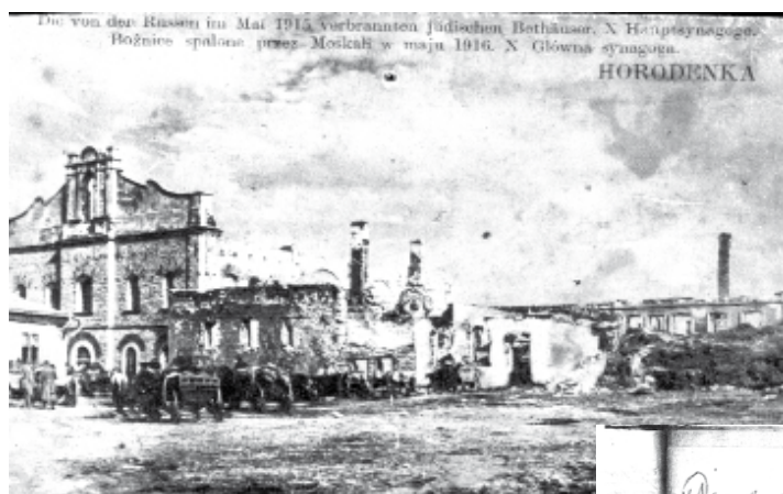
Зруйновані у травні 1916 р. солдатами царської Росії синагога та прилегли до неї будинки у центрі м. Городенки