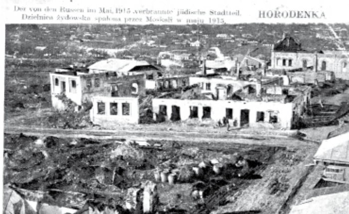
Знищена єврейська лікарня м. Городенки солдатами царської Росії. Травень 1915 р.