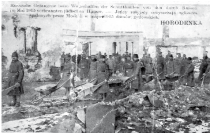
Відбудова єврейських будинків м. Городенки австрійською військовою владою. Травень 1915 р.