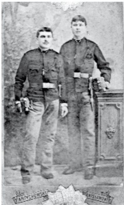
Городенківці — вояки австрійської армії. 1914 р.