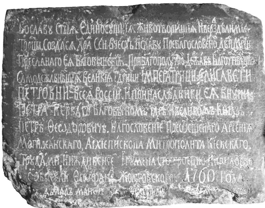
Мал. 1. Фотографія плити з написом 1760 р.

ньої церкви, адже храм не функціонував після ремонтних робіт у 1860-х рр., а призначення приміщення було змінено 7 . Ймовірно, плита знаходилась тут і надалі: наприклад, у путівнику по Києву 1930 р., що вийшов за редакцією Ф. Ернста, зазначено, що