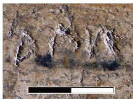
Рис. 2. Фотографія та прорисовка графіті № 2187. Приклад незмикання окремих елементів літер внаслідок потрапляння під лезо твердих домішок.

Писала або інші подібні інструменти. Слід зазначити, що більшість графіті Софії Київської виконувалися саме цими інструментами. Процес та проблеми при виконанні написів ними подібні до видряпування ножем. Гостре конічне лезо так само сильно заглиблюється в тиньк. Форма леза дозволяє виконувати практично однакової товщини прорізи, в тому числі й плавні заокруглені лінії. Втім вкраплення твердих мінеральних домішок так само призводять до викришування тиньку чи зміни напрямку лінії, а органічні домішки найчастіше випадають разом з оточуючими фрагментами тиньку. Рельєфність поверхні фрески також зумовлює розірваність або різну товщину ліній одного прорізу. Для прикладу можемо навести запис № 2187 на фресці з образом св. Пантелеймона, що складається лише з одного імені Ана 'Анна': під час видряпування літер н та другої а рука авторки зісковзнула, внаслідок чого в першій виникла надто висока діагональна перемичка і літера набула схожості з п , а в другій спинка не зімкнулася з петлею (рис. 2).