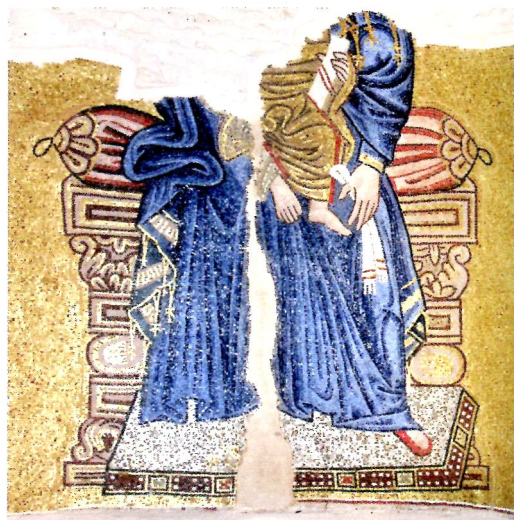
7 Богоматерь с младенцем Христом Мозаика в апсиде кафедрального собора монастыря Дафни. Деталь