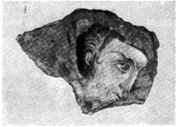
Рис. 2. Фрагмент стінного живопису Десятинної церкви з розкопок XIX ст. (фото).

Дослідники, які вивчали Десятинну церкву, практично не ставили питання атрибуції трьох описаних типів тиньку. М. К. Каргер усі матеріали, виявлені при розкопках Десятинної церкви та палацу в 1937 р., беззастережно відніс до будівлі церкви. При цьому він дав відомості лише про два типи тиньку: білий крихкий та двошаровий з цементівкою у верхньому шарі (тобто про другий та третій типи) 7 .