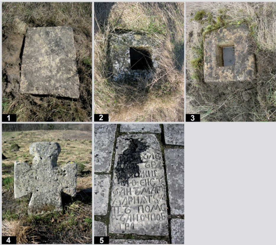
Рис. 13. Старий цвинтар у с. Підгірці. Кам'яні пам'ятники: 1 – пам. № 95; 2 – пам. № 96; 3 – пам. № 97; 4 – пам. № 98; 5 – пам. № 99.