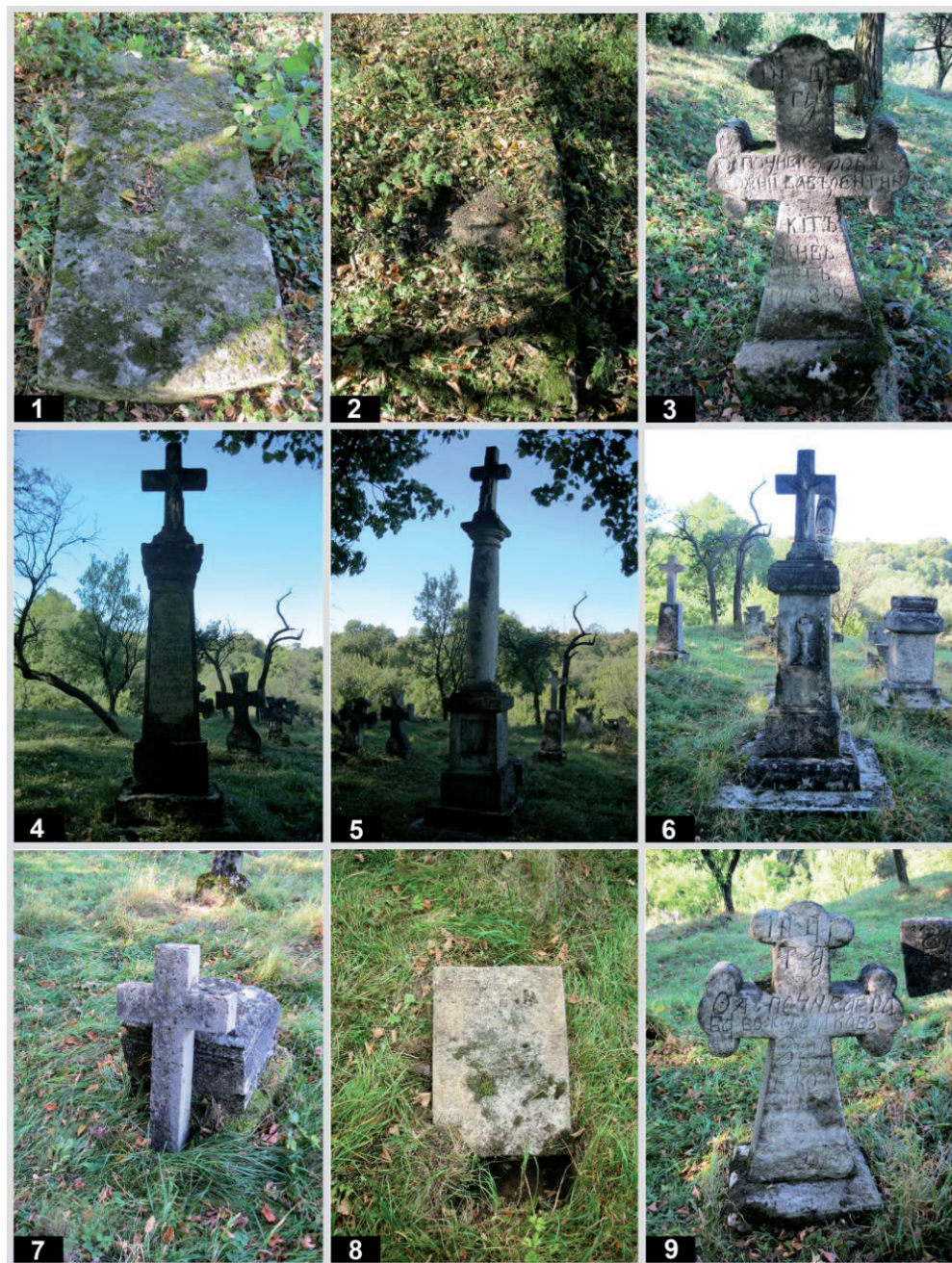
Рис. 2. Старий цвинтар у с. Підгірці. Кам'яні пам'ятники: 1 – пам. № 1; 2 – пам. № 2; 3 – пам. № 3; 4 – пам. № 4; 5 – пам. № 5; 6 – пам. № 6; 7, 8 – пам. № 7; 9 – пам. № 8.