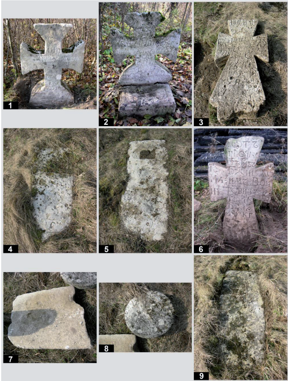
Рис. 9. Старий цвинтар у с. Підгірці. Кам'яні пам'ятники: 1 – пам. № 64; 2 – пам. № 65; 3 – пам. № 66; 4 – пам. № 67; 5 – пам. № 68; 6, 7, 8 – пам. № 69; 9 – пам. № 70.