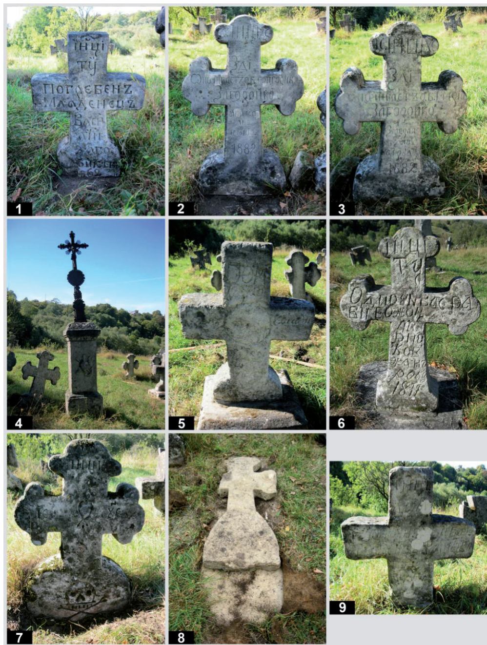
Рис. 4. Старий цвинтар у с. Підгірці. Кам'яні пам'ятники: 1 – пам. № 18; 2 – пам. № 19; 3 – пам. № 20; 4 – пам. № 21; 5 – пам. № 22; 6 – пам. № 23; 7 – пам. № 24; 8 – пам. № 25; 9 – пам. № 26.