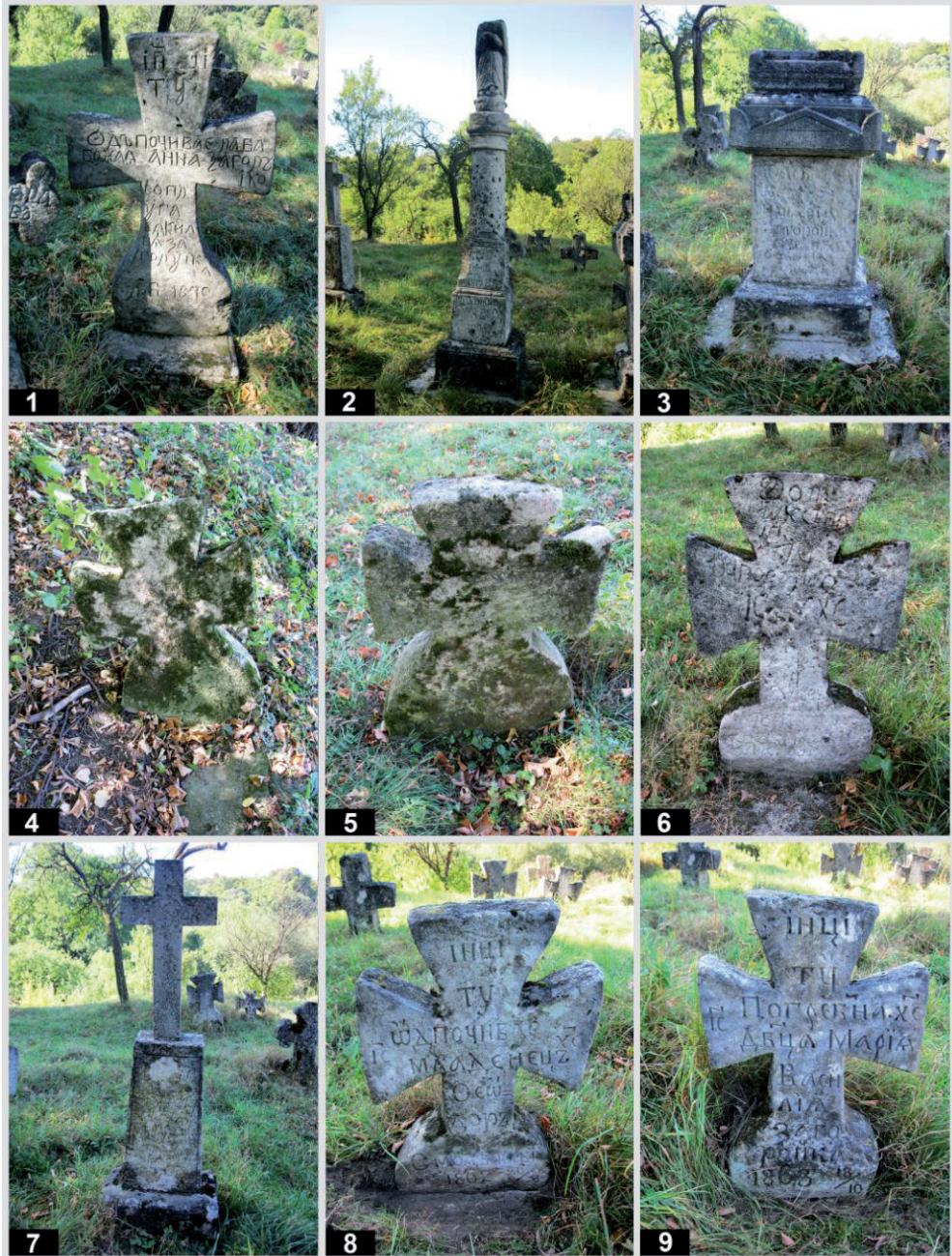
Рис. 3. Старий цвинтар у с. Підгірці. Кам'яні пам'ятники: 1 – пам. № 9; 2 – пам. № 10; 3 – пам. № 11; 4 – пам. № 12; 5 – пам. № 13; 6 – пам. № 14; 7 – пам. № 15; 8 – пам. № 16; 9 – пам. № 17.