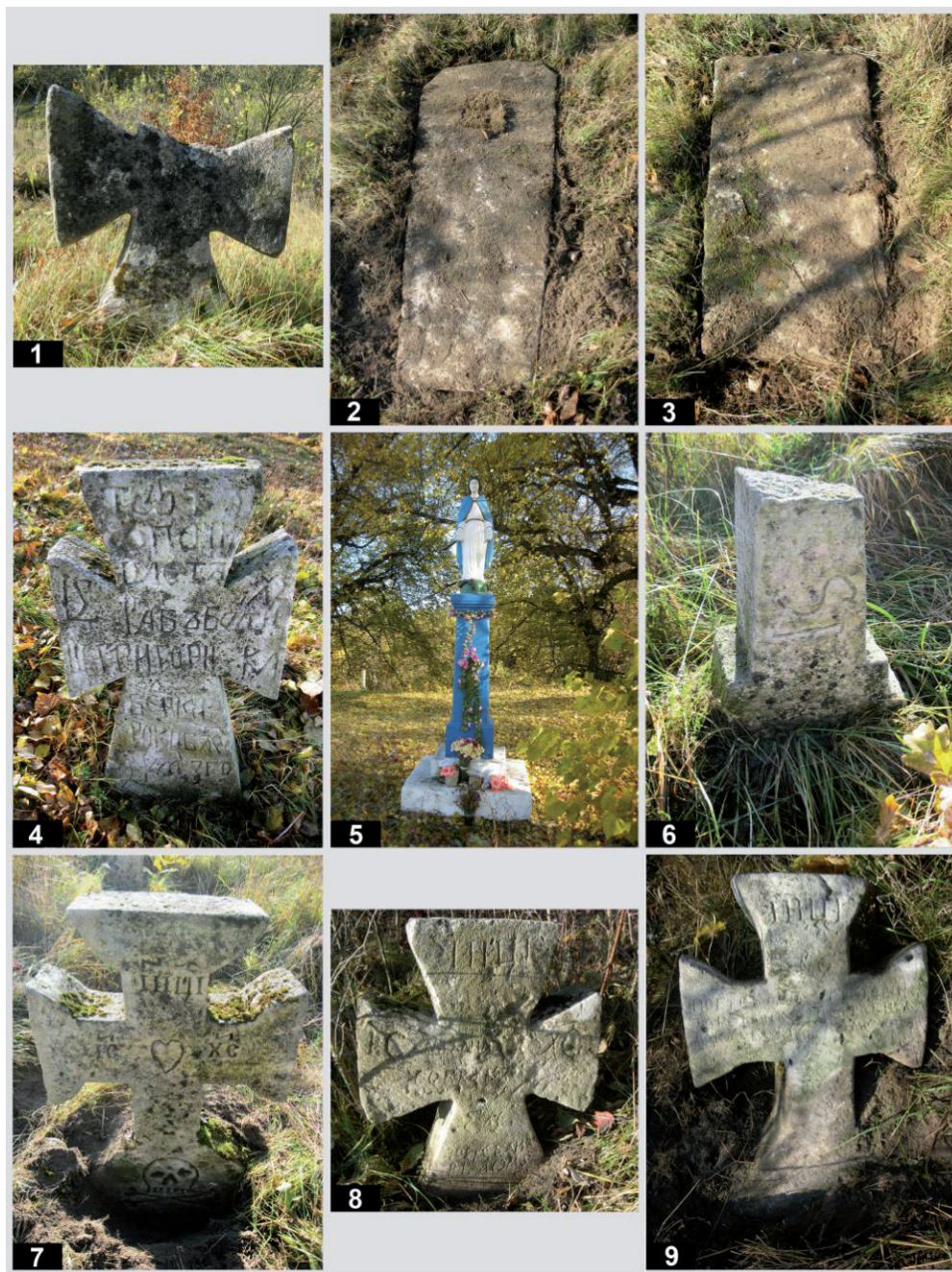
Рис. 8. Старий цвинтар у с. Підгірці. Кам'яні пам'ятники: 1 – пам. № 54; 2 – пам. № 55; 3 – пам. № 56; 4 – пам. № 57; 5 – пам. № 58; 6 – пам. № 60; 7 – пам. № 61; 8 – пам. № 62; 9 – пам. № 63.