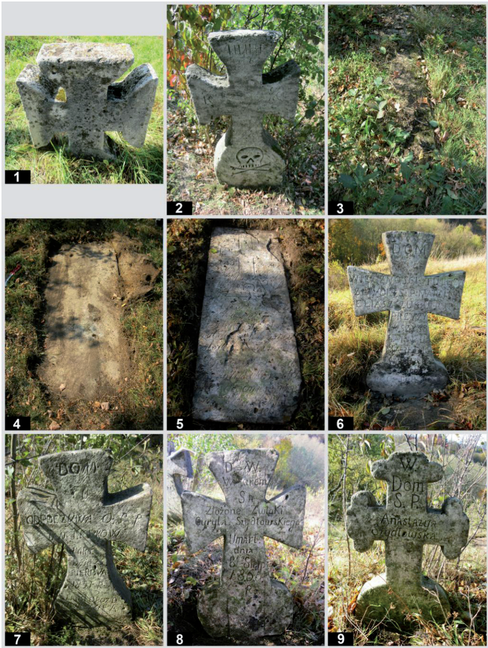
Рис. 7. Старий цвинтар у с. Підгірці. Кам'яні пам'ятники: 1 – пам. № 45; 2 – пам. № 46; 3 – пам. № 47; 4 – пам. № 48; 5 – пам. № 49; 6 – пам. № 50; 7 – пам. № 51; 8 – пам. № 52; 9 – пам. № 53.