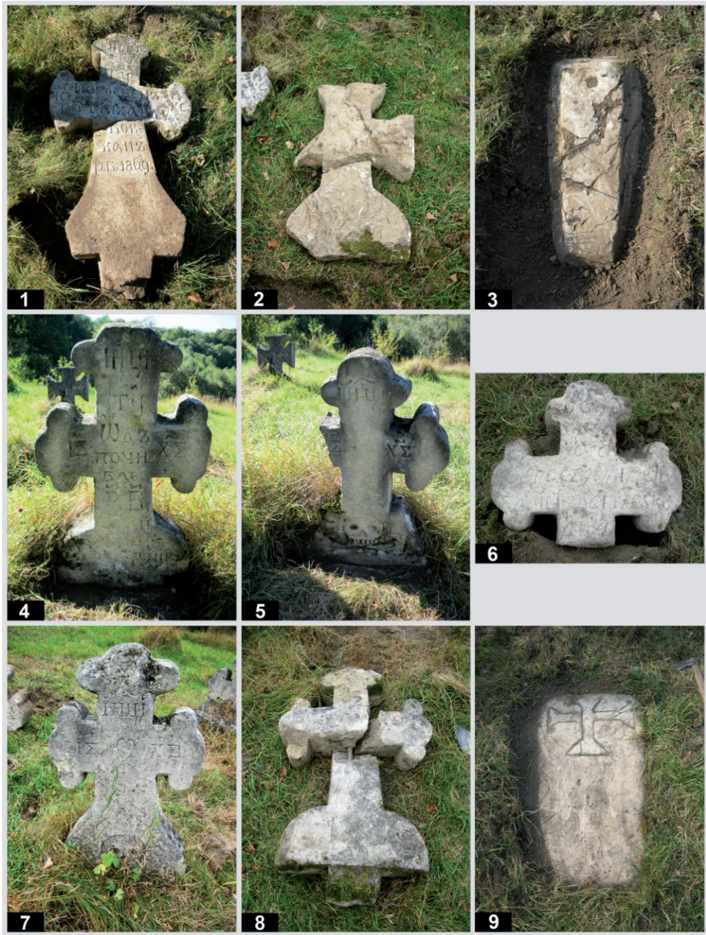
Рис. 5. Старий цвинтар у с. Підгірці. Кам'яні пам'ятники: 1 – пам. № 27; 2 – пам. № 28; 3 – пам. № 29; 4 – пам. № 30; 5 – пам. № 31; 6 – пам. № 32; 7 – пам. № 33; 8 – пам. № 34; 9 – пам. № 35.