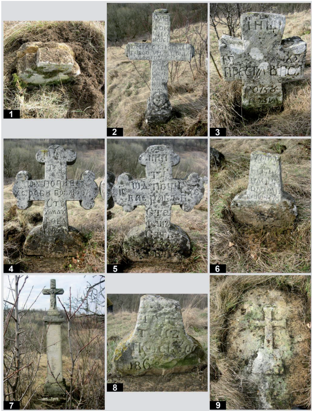
Рис. 11. Старий цвинтар у с. Підгірці. Кам'яні пам'ятники: 1 – пам. № 79; 2 – пам. № 80; 3 – пам. № 81; 4 – пам. № 82; 5 – пам. № 83; 6 – пам. № 84; 7 – пам. № 85; 8 – пам. № 86; 9 – пам. № 87.