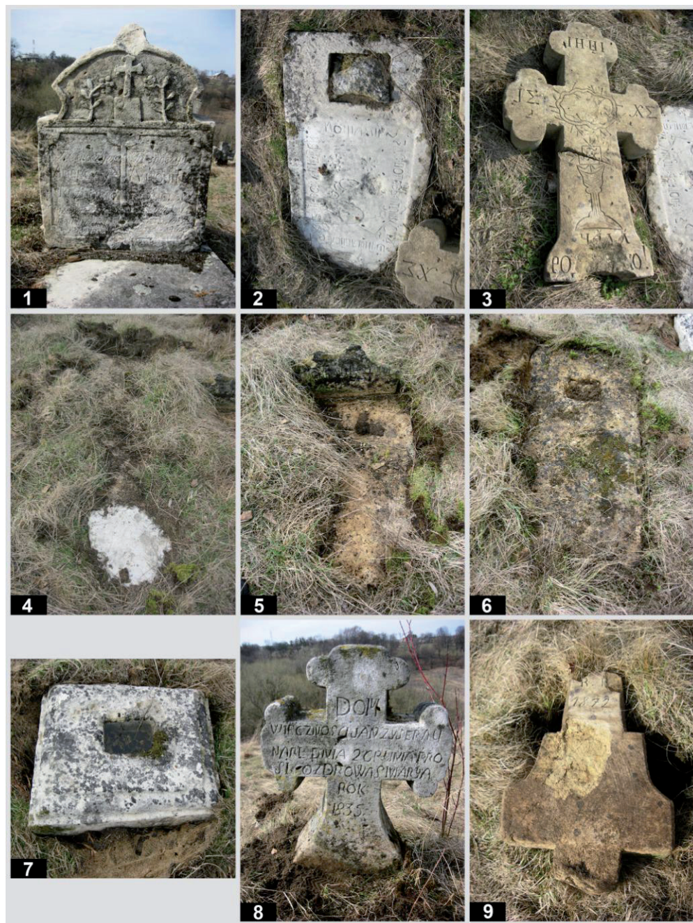
Рис. 10. Старий цвинтар у с. Підгірці. Кам'яні пам'ятники: 1 – пам. № 71; 2, 3 – пам. № 72; 4 – пам. № 73; 5 – пам. № 74; 6 – пам. № 75; 7 – пам. № 76; 8 – пам. № 77; 9 – пам. № 78.