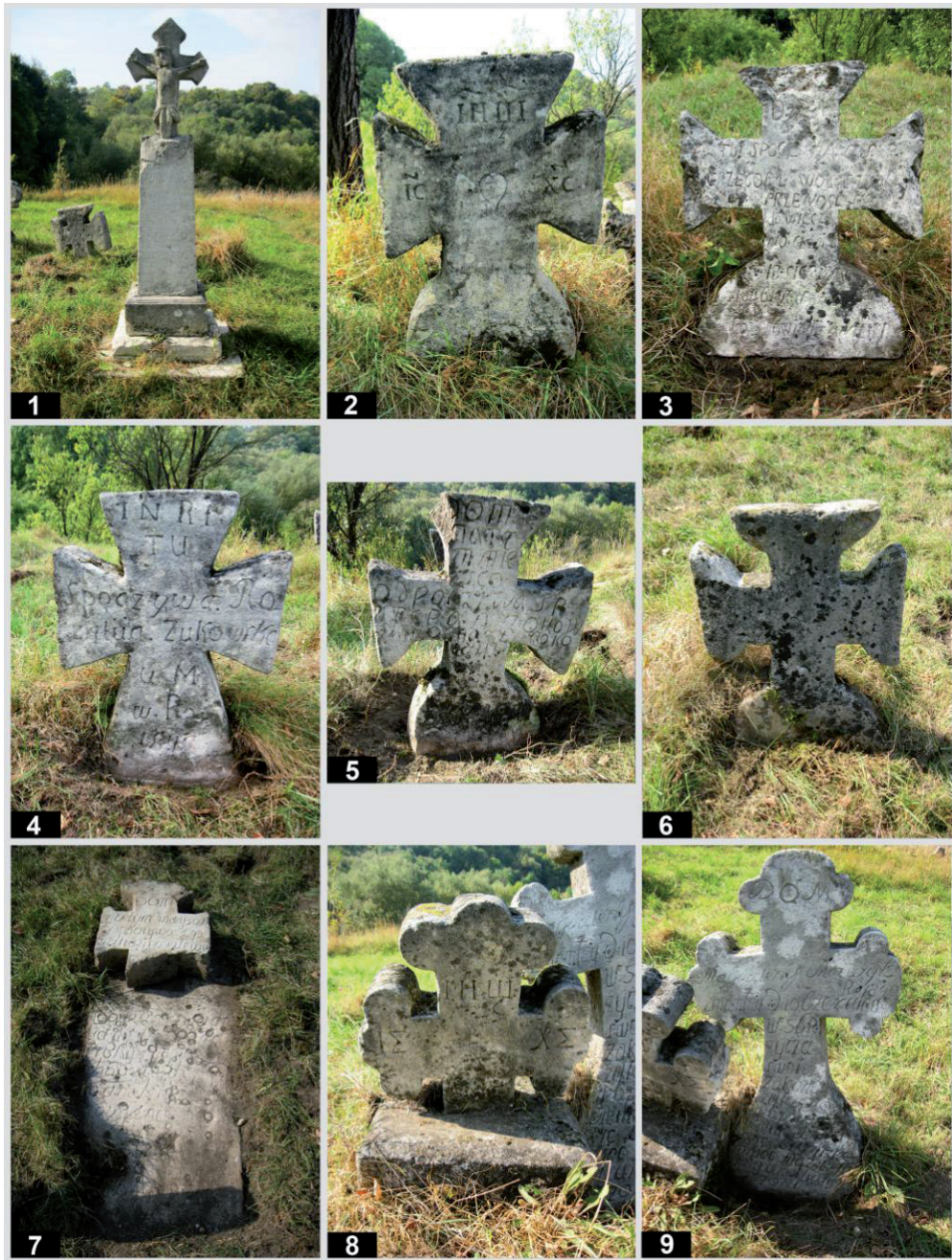
Рис. 6. Старий цвинтар у с. Підгірці. Кам'яні пам'ятники: 1 – пам. № 36; 2 – пам. № 37; 3 – пам. № 38; 4 – пам. № 39; 5 – пам. № 40; 6 – пам. № 41; 7 – пам. № 42; 8 – пам. № 43; 9 – пам. № 44.