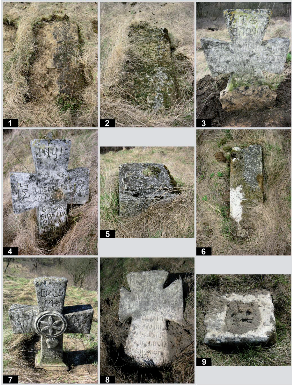
Рис. 12. Старий цвинтар у с. Підгірці. Кам'яні пам'ятники: 1 – пам. № 88; 2 – пам. № 89; 3 – пам. № 90; 4 – пам. № 91; 5, 6 – пам. № 92; 7 – пам. № 93; 8 – пам. № 94; 9 – пам. № 95.