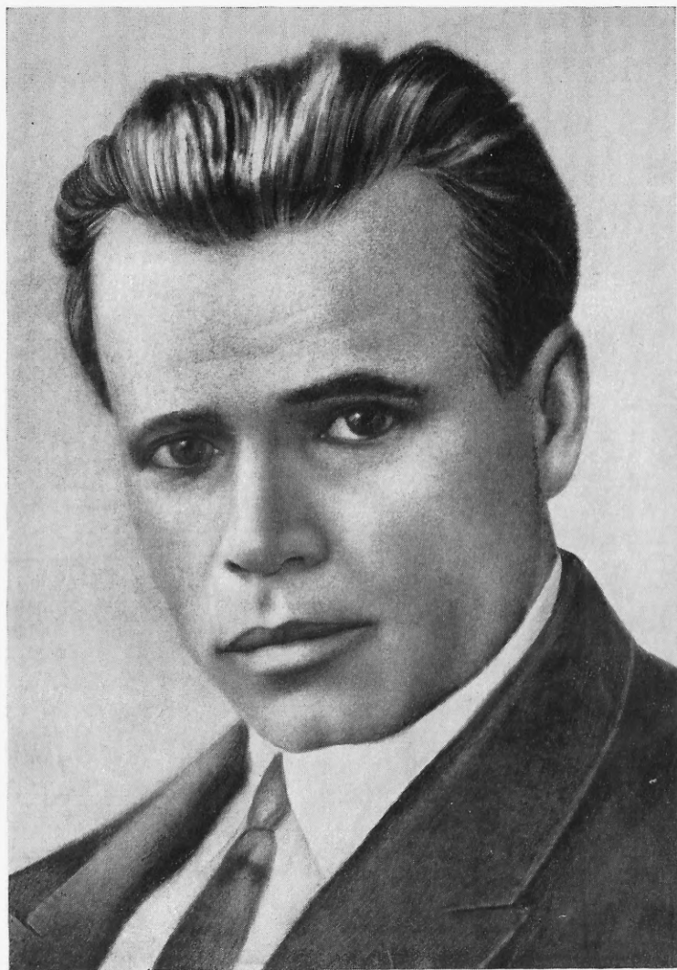
О. І. Копиленко в 1922 році. Листівка.