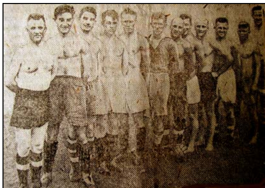
Сборная СССР образца 1934 г. на тренировке без футболок в трусах разного цвета