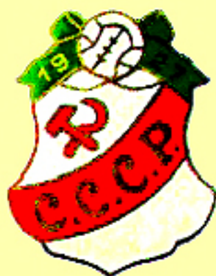
Знамен члена сборной СССР по футболу (1927 г.)