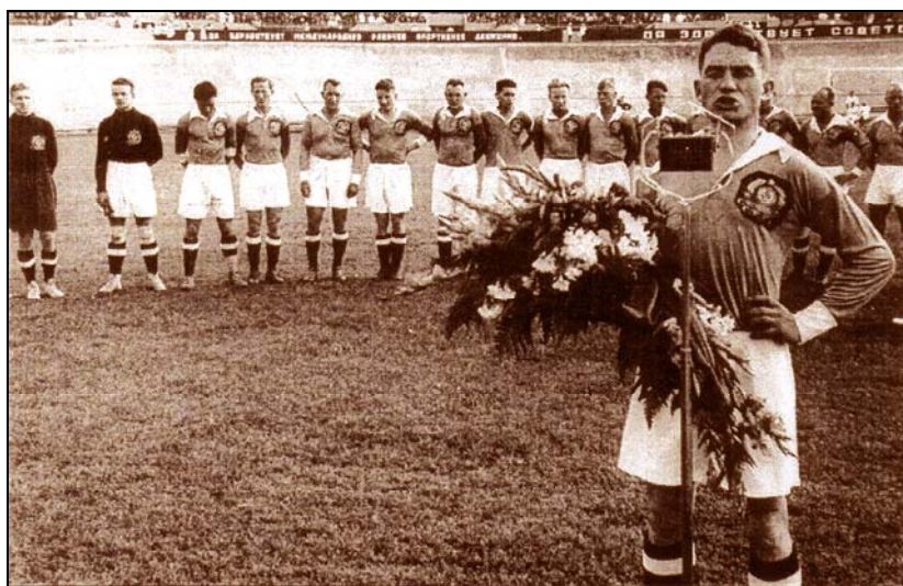
Перед матчем 7.08.1934 г. СССР – Турция (приветствие капитана сборной Николая Старостина)