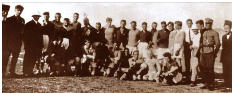
Сборные СССР и Турции перед матчем в Константинополе