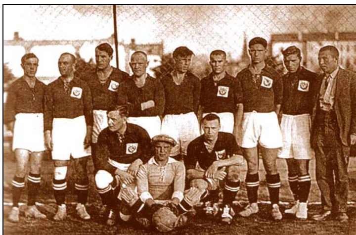
Сборная СССР 1926 г.

Так как турне было запланировано на июль-август