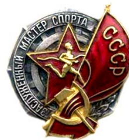
Почетный знак "Заслуженный мастер спорта СССР"