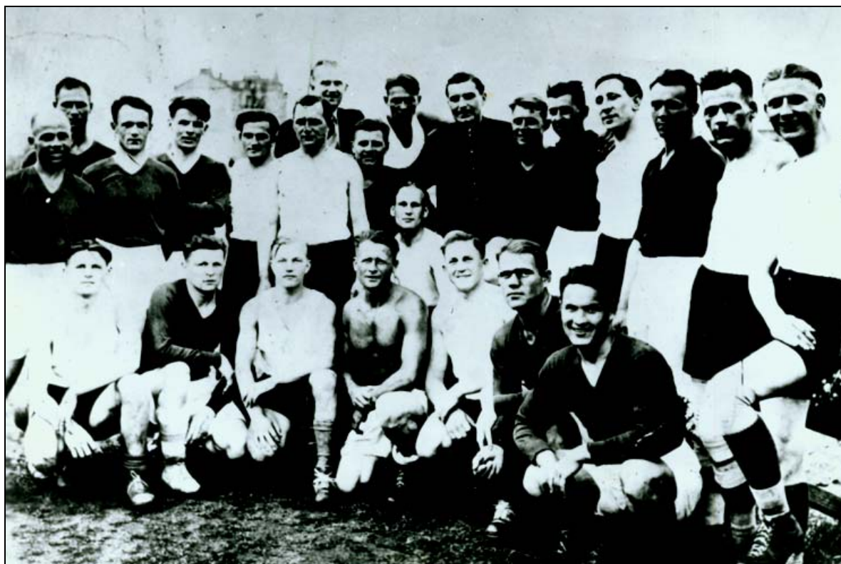
Фото перед матчем «Старт» - «Flakelf» (в темных футболках игроки «Старта»)

Матчи по свидетельству очевидцев проходили в нормальной спортивной обстановке, особых грубостей никто не помнит, нареканий на судейство не было с обеих сторон. Известна еще одна фотография, сделанная перед началом матча 6 августа, на которой также хорошо видны улыбающиеся лица соперников. И в этом матче команда играла в красных футболках. Игроки «Старта» прекрасно понимали, что для зрителей это, конечно, имело все-таки значение. Все понимали, что такие победы над оккупационными войсками ни к чему доброму не могут привести.