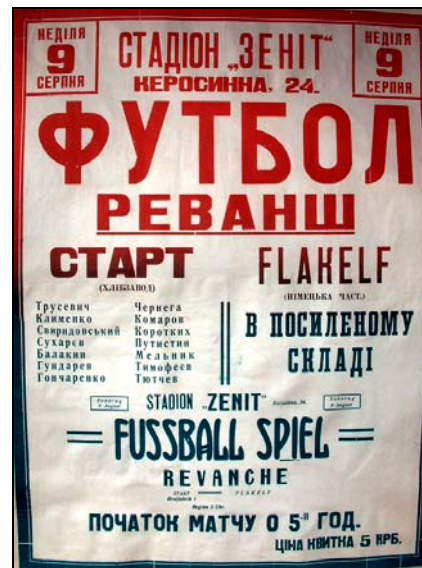
Афиша к матчу-реваншу «Старт» -«Flakelf»

Этому матчу было суждено войти в историю патриотического наследия советской эпохи и историю мирового футбола. Именно об этом матче сложили легенду «матча смерти», о нем написаны художественные книги, сняты кинофильмы. Долго вокруг него ходили всяческие слухи, приукрашенные домыслами. Согласно легенде все игроки команды «Старт» были после матча арестованы, отправлены в концлагерь, где четверо из них было расстреляны. Но это было не так.