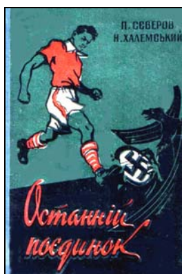
Первое издание книги «Последний поединок», Киев, «Рад.письменник», 1958 г., 278 стр.