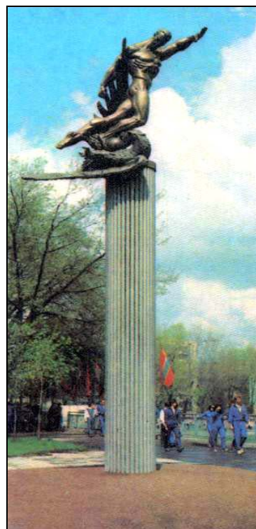
Памятный знак на стадионе «Старт» в Киеве