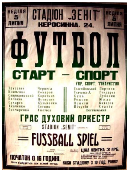
Афиша к матчу «Старт» - «Спорт»