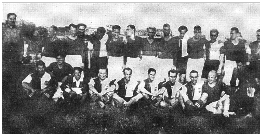
Фото перед матчем «Старт» - GK «Szero» (в темных футболках игроки «Старта»)

Известна фотография, сделанная перед началом матча 26 июля, на которой хорошо видны улыбающиеся лица соперников. Хотя надо отдать должное