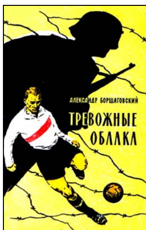
Первое издание книги «Тревожные облака», Москва, «Сов.Россия», 1960 г., 164 стр.