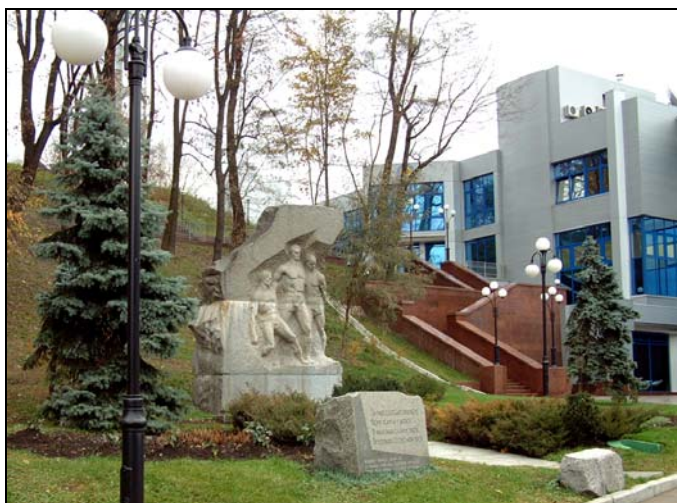
Памятник героям «матча смерти» на киевском стадионе «Динамо»

На нынешнем стадионе «Старт» (бывший «Зенит») о матче-легенде напоминает бронзовая фигура атлета, попирающего стержнятника, а на братской могиле у «Бабьего Яра» установлена плита с указанными фамилиями трех погибших здесь футболистов.