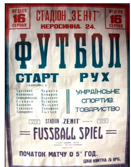
Афиша к матчу-реваншу «Старт» -«Рух»