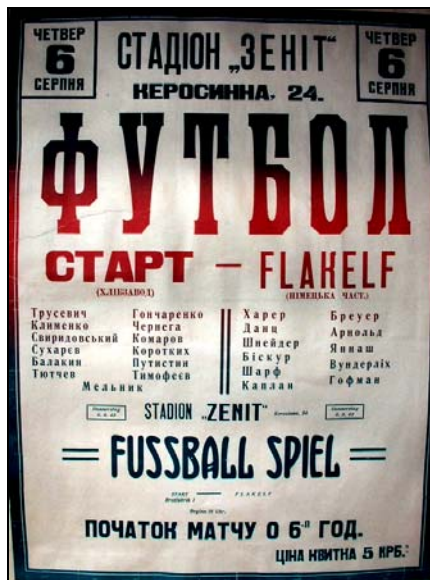
Афиша к первому матчу «Старт» - «Flakelf»