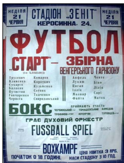
Афиша к матчу «Старт» - сборная венгерского гарнизона

Початок матчу о 18 години. Ціна квитка – 3 крб.”