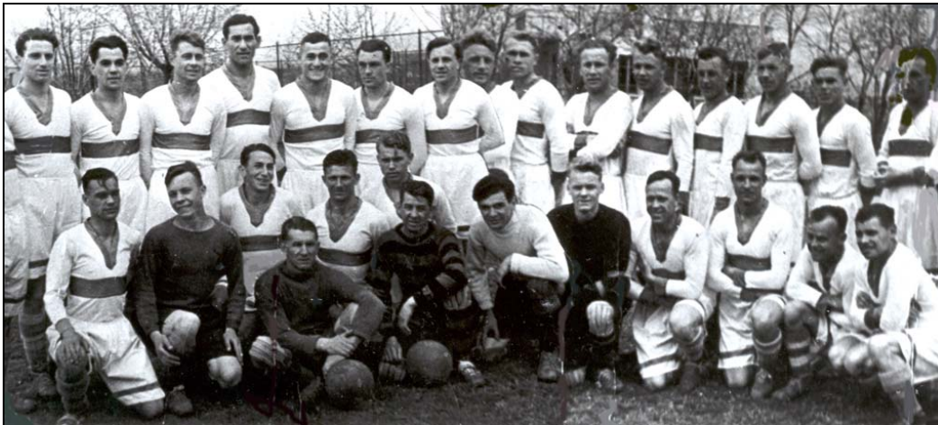
Полный состав киевского «Динамо» - 1941 года (слева направо):