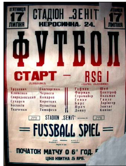
Афиша к матчу «Старт» - RSG I (сборная железной дороги)