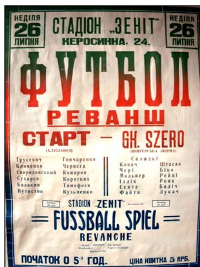
Афиша к матчу «Старт» - GK «Szero»

После этой победы в киевской газете «Нове українське слово» появилось сообщение об этом матче, где отмечалось, что команда хлебзавода – лучшая в городе и имеет «отборных» игроков. За короткое время своего существования команда завоевала широкую популярность не только среди киевлян, но и среди немецких и венгерских любителей футбола. В пяти матчах команда забила 35 голов, а пропустила только 5 (здесь в газете допущена ошибка - матчей было уже шесть).