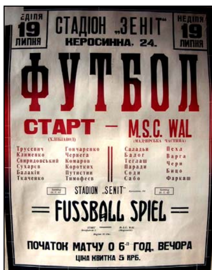
Афиша к матчу «Старт» - MSC «Wal»