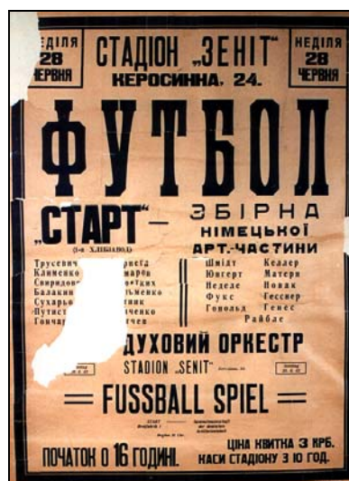
Афиша к матчу «Старт» - сборная немецкой артиллерийской части