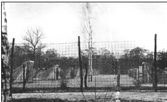
Сырецкий концлагерь («Бабий яр»)

Команда стала неудобной, прежде всего, для немецкой власти в городе. Пошли доносы и обвинения. Числящихся военнопленными и неблагонадежными посадили за колючую проволоку в Сырецкий концлагерь. Ходили слухи, что их арестовали за крупную кражу хлеба 2 ноября, о которой писалось в газетах, но вряд ли это были футболисты, хотя в газете написано, что арестовано и приговорено к расстрелу было четыре человека, ранее отпущенных под честное слово.