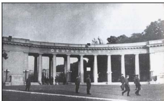
«Дойче штацион» (немецкий стадион) в г. Киеве (до и после войны – стадион «Динамо»)