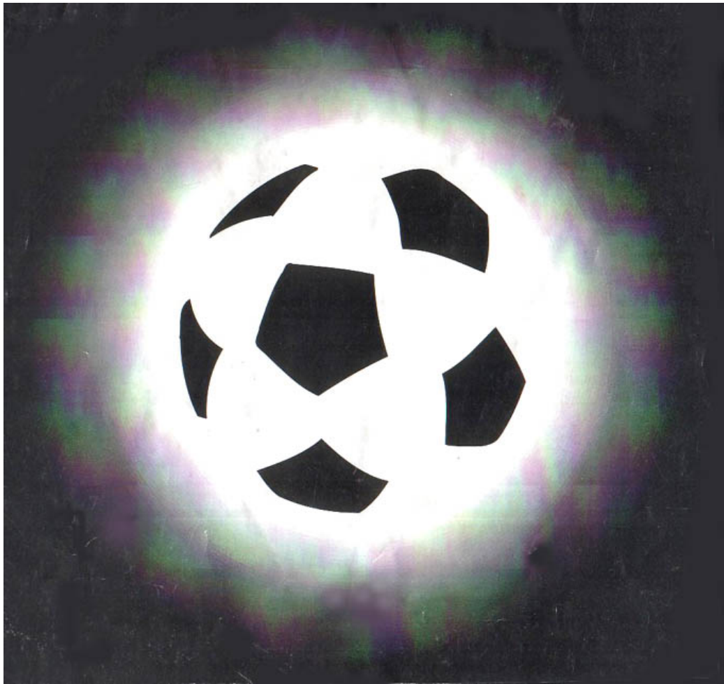
Футбольні плями на Сонці

Это издание подготовлено к распространению в электронном виде исключительно для увлекающихся историей футбола любителей этой игры. Особенно тех, которые пробуют свои силы в создании истинной, не выдуманной истории футбола их города или населенного пункта. исключительно на основе документальных доказательств описываемых ими времен в виде печатных периодических изданий и других средств массовой информации, а также архивных документов, обнаруженных ими или их предшественниками в закромах местных государственных архивов, библиотек и краеведческих музеев.