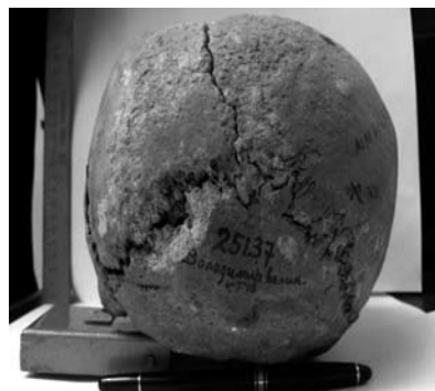
Гл. 4. Потилічний вигляд