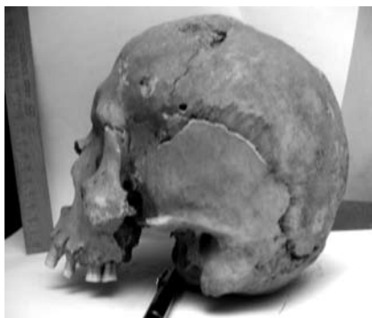
Гл. 4. Лівобічний вигляд