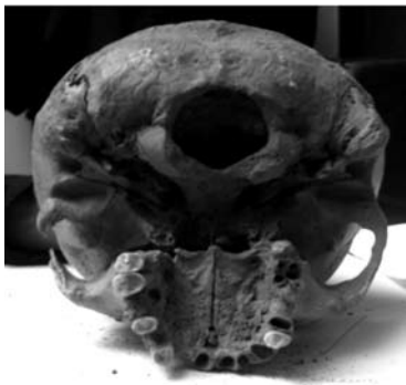
Іл. 5. Вигляд основи черепа