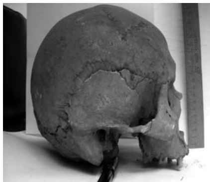
Гл. 3. Правобічний вигляд