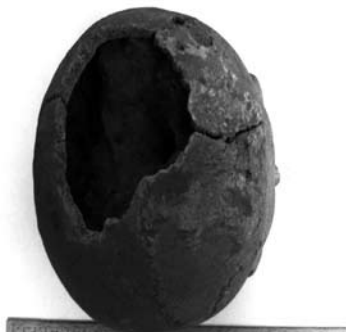
Іл. 6. Вигляд згори