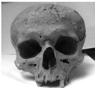
Гл. 2. Вигляд спереду

Таким чином, описані археологами поховання людей княжої доби, а також відображення писемними джерелами наслідків ординського нашествия, дозволяють зробити попередній висновок про необхідність розрізняти людські останки з механічними ушкодженнями черепа та кісток посткраніального скелета, що їх завдавали зброєю від тих черепних пошкоджень, які ми схильні розглядати радше у контексті протиборства дохристиянських і християнських вірувань, насамперед, давніх вірувань в упирів.