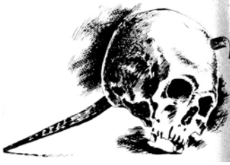
Іл. 1. Череп, пробитий залізним цвяхом із розкопок 1870 р. при дорозі поблизу поселення Бики (Пйотркув, Польща)

Літописні статті з відомостями про жорстокість та звірства монгольських завойовників під час походів на руські князівства, на жаль, надто лапідарні аби почерпнути з них інформацію про предмет нашого дослідження. Переважно тогочасні книжники повідомляють про наслідки бойових дій давніх русичів з монголами не вдаючись до подробиць. Так, у описі Калкського побоїща (30.05.1223) (у літописі – Алецькое побоище . – Авт.) київський літописець занотував: “Татаромъ же побѣдившимъ Русьскыя князя, за прегрешение крестьянское пришедшимъ и дошедшим до Новагорода Святополчьского: не вѣдающимъ же Руси льсти ихъ, исходяху противу имъ со кресты, они же избиша ихъ всихъ” 27 . Новгородський літописець додав: “А городъ вѣзьяшь, и люди исѣкоша, и ту костью падоша; а князи имъше, издавиша, подѣкладъше подъ дѣки, а сами вѣрху сѣдоша обѣдати, и тако животь ихъ концяша” 28 .