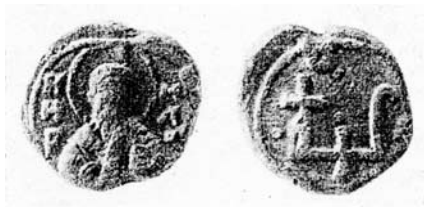
Гл. 1. Печатка Романа Мстиславича і новгородського посадника Якуна

носив, як вважав цей дослідник, хресне ім'я Кирило 5 . Тому ідентифікацію підтримали деякі дослідники 6 .