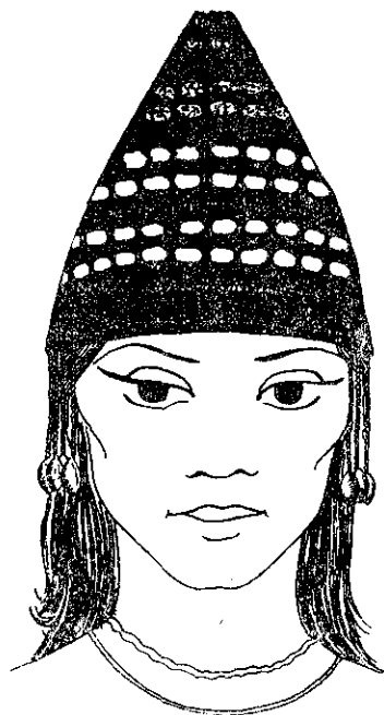
Рис. 6. Реконструкція убору з підвісками з Бердянського кургану.

дової Могили) Дніпропетровської області 17 . У наборі декоративних елементів є бляшки, що зображають зайця із зіщупленими вухами (1,2×1 см; 31 ціла та 47 уламків). Вони оточували голову разом з золотими намистинками кулеподібної форми (354 екз.). Точне розміщення прикрас у похованні не зафіксовано, крім тієї деталі, що фрагменти убору у вигляді його золотого декору утворювали навколо голови пляму поздовжньо витягнутої відносно черепа форми. Декор убору досить лаконічний, створити візерунки з його складових частин, здається, можна на невеликій площині. Кількість бляшок, що можна використати для побудови композицій, невелика: для прикрашання фронтальної частини потрібні були цілі екземпляри, фрагментовані були доповненням основної композиції, що складала своєрідний фон. Якщо спробувати скомпонувати бляшки для оздоблення циліндричної поверхні, то стає ясно, що ці-