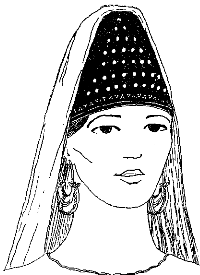
Рис. 5. Графічне відтворення убору скіф'янки з поховання в кургані № 3 поблизу с. Богданівка Херсонської області.

лих екземплярів дуже мало для створення візерунка з довгих паралельних рядів. Отже, найбільш ймовірно, що платівки утворювали візерунки, характерні для прикрашання убору конусоподібної форми, тобто розміщувалися на площині у вигляді трикутника. Всі елементи набору прикрас можна поєднати в ряди, кількість бляшок в яких зменшується знизу вверх. Розрахунки варто вести від нижнього пружка убору; якщо припустити, що прикрашена його частина відповідала ширині лоба дорослої людини (16—18 см), то на нижній край убору потрібно десять цілих платівок, потім на невеликій відстані один від одного розташовувалися ряди з 9, 7, 5; 3; 2, 1 бляшки. Їхні фрагменти також вкомпонувалися в ряди прикрас і таким чином збільшували декоративний ефект. Між рядами золотих платівок утворюються «пояски», не заповнені візерунками, які поділяють всю прикрашену поверхню й є додатковим елементом оформлення.