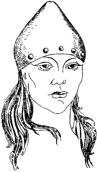
Рис. 1. Убір з кургану № 6 поховання 2 поблизу с. Мар'ївка Дніпропетровської області.

гиви прикрас розміщуються найчастіше по горизонталі. Горизонтальні доміанти використовуються в ярусних композиціях ряду відомих творів: вази з Чортотлика, Солохи, Куль-Оби, пластина з кургану Карагодеуаш і т. д. В організації декору виробів причорноморських майстрів велику роль відіграє розподіл поверхні, що прикрашається додатковими факторами художнього оформлення. На золотих предметах такими є смуги з ов, перлини і т. д. Можливо, до додаткових засобів слід віднести і колір виробу, якщо він виконувався з пофарбованого матеріалу.