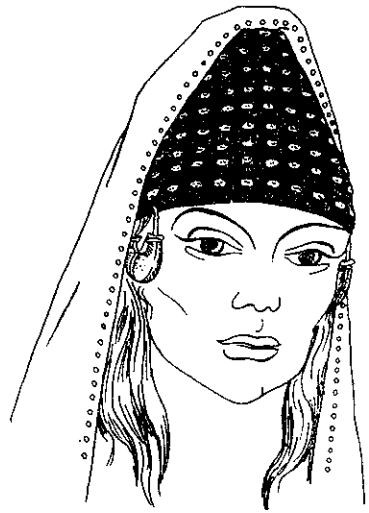
Рис. 7. Реконструкція убору з кургану № 4 поблизу с. Ізобільне Дніпропетровської області.

Конічна форма уборів, як зазначалося, була широко поширена в стародавньому світі. Наявна вона й у деяких народів нового часу. Етнографи вважають конусоподібні убори в народному костюмі ремінісценцією давніх форм. Наприклад, Б. А. Калоев вважає: «Характерна особливість осетинського головного убору — конусоподібна форма — свідчить про його спадковість від скіфів та аланів» 23 .