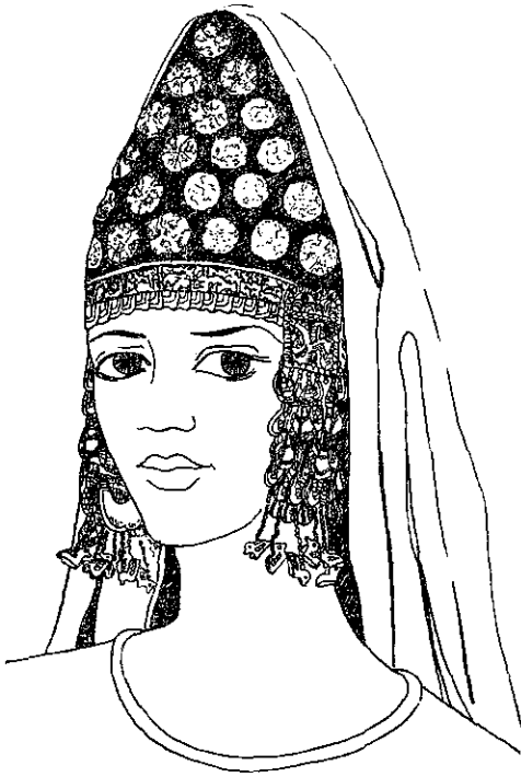
Рис. 3. Конічний убір жінки, похованої в кургані № 4 неподалік с. Новосілки Черкаської області.