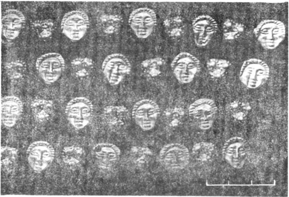
Рис. 4. Декоративні деталі убору з кургану № 3 поблизу с. Богданівка Херсонської області.

м'янка Запорізької області. Але, як зазначалося, зображення не досить чітке, тому в інтерпретації цього елемента можуть бути варіанти. Зате в археологічних знахідках ці прикраси зафіксовані так, що майже не виникає сумнівів про їх використання як скроневих підвісок.