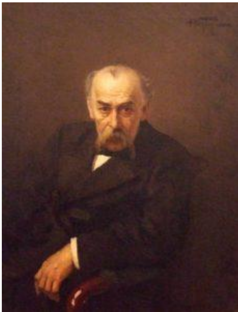
Рис. Д. 5. Маковський О. Портрет В. В. Тарновського-молодшого. 1898 р. Зберігається в Національному художньому музеї України, м. Київ.