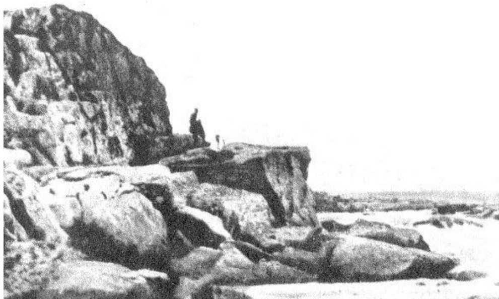
Рис. В. 1. Біля високої скелі Манастирської, або Царициної. З видання: Яворницький Д. И. Запорожсьє в остатках старини и преданиях народа. С 55-ю рисунками и 7-ю планами: у 2-х ч. Санкт-Петербург: Изд. Л. Ф. Пантелеева, 1888. Ч. 1. III, [3], 294 с.

Фото, зроблені під час подорожі В. В. Тарновського-молодшого з Д. І. Яворницьким. 1887 р.