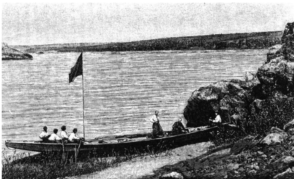
Рис. В. 2. Біля острова Перуна. З видання: Яворницький Д. И. Запорожсьє в остатках старини и преданиях народа. С 55-ю рисунками и 7-ю планами: у 2-х ч. Санкт-Петербург: Изд. Л. Ф. Пантелеева, 1888. Ч. 1. III, [3], 294 с.