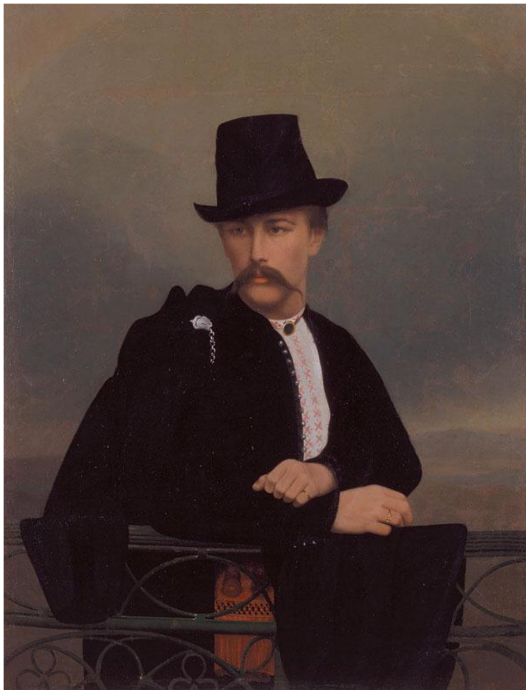
Рис. Д. 3. Горонович А. Портрет В. В. Тарновського-молодшого. 1860-ті рр. Зберігається в Національному художньому музеї України, м. Київ.