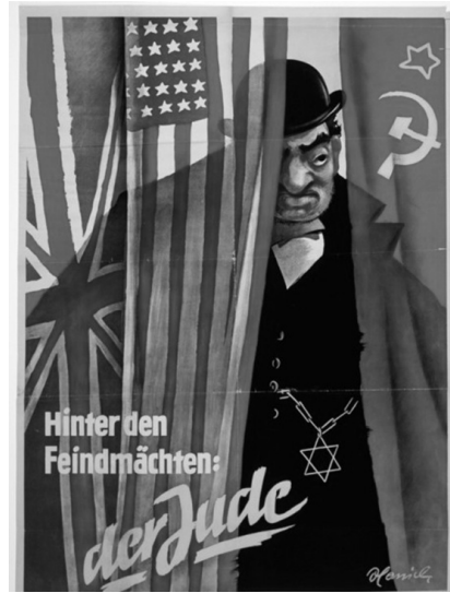
Єврейські лікарі в УПА