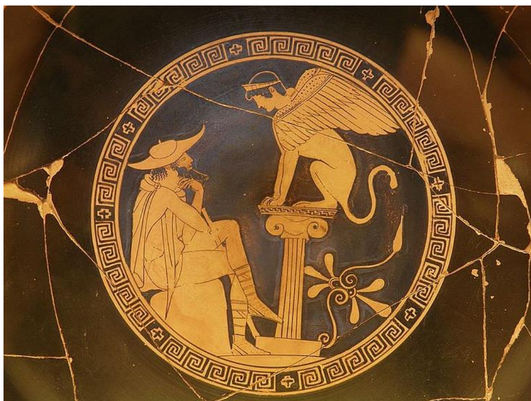
Едіп розгадує загадку Сфінкса. Червонофігурний кубок. са. 470 BC. Vatican