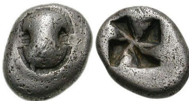
Беотійський обол. са. 525 BC - 480 BC