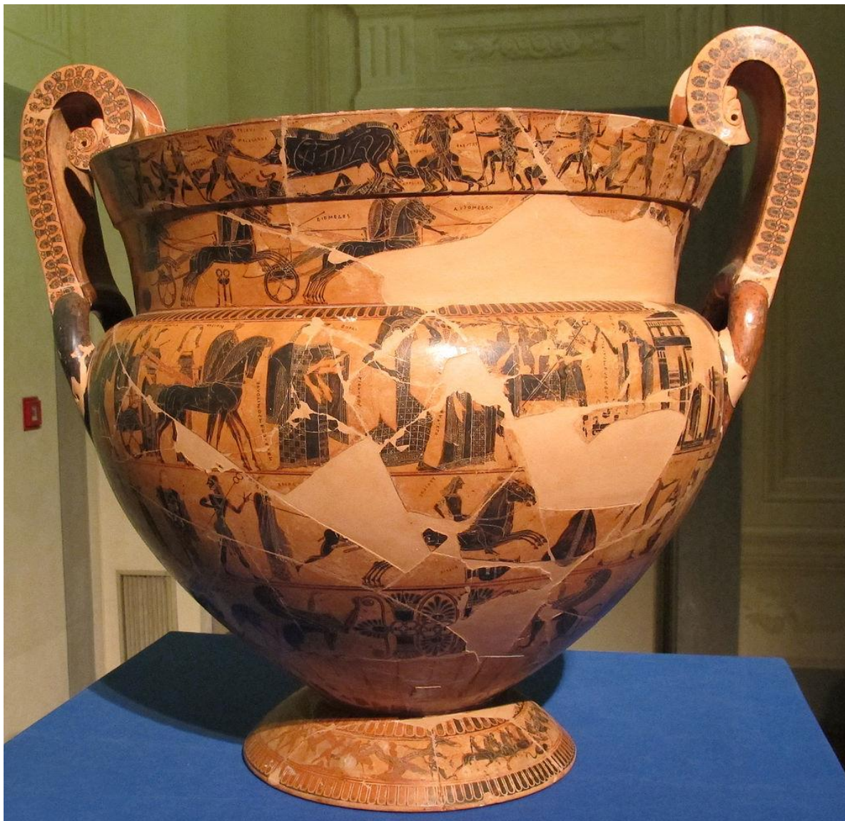
Аттичний чорнофігурний кратер. Відомий як François Vase. ca. 570-560 BC.

National Archaeological Museum, Florence.