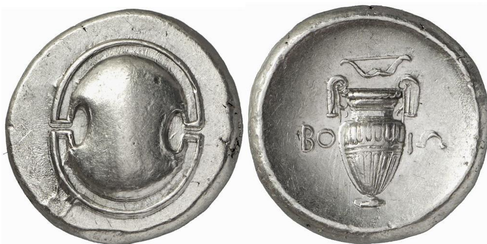
Беотійський статер. са. 395 BC - 387 BC