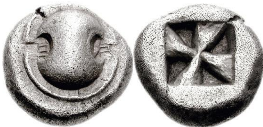
Беотійська драхма з Галіарту. са. 525 BC - 480 BC