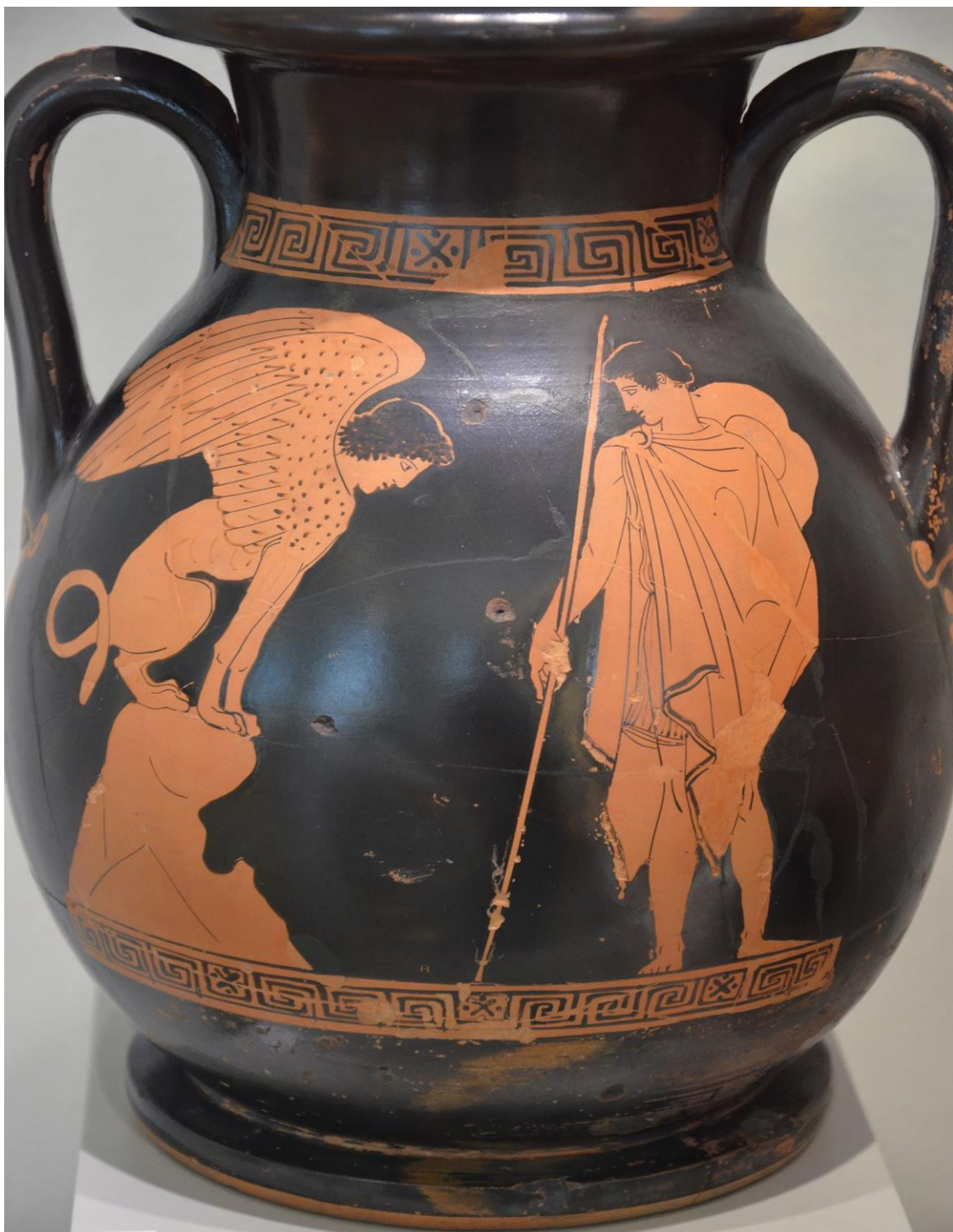
Едіп розгадує загадку Сфінкса. Червонофігурна пеліка. са. 450-440 BC. Altes Museum Berlin