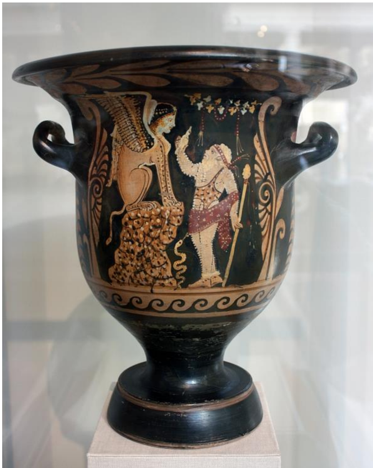
Едіп розгадує загадку Сфінкса. Червонофігурний кратер. са. IV BC. Metropolitan Museum of Art.