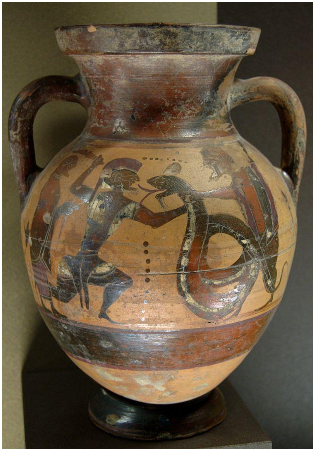
Кадм, що б'ється з драконом. Чернофігурна амфора, Евбея. са. 560–550 BC.