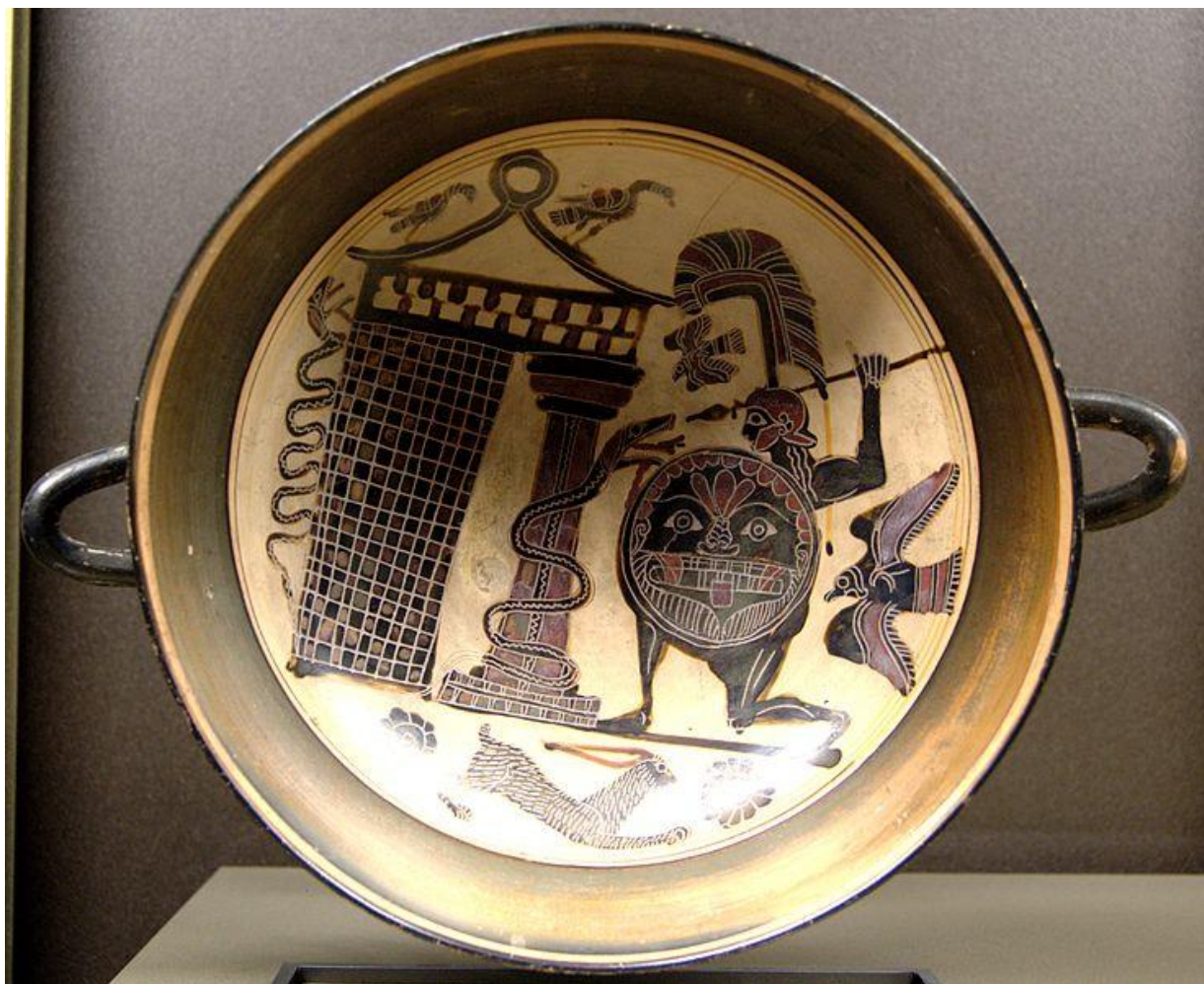
Кадм, що б'ється з драконом. Лаконська чорнофігурний кубок. са. 550 ВС– 540 ВС. Louvre E669