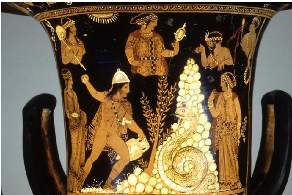
Кадм, що б'ється з драконом. Червонофігурний кратер. са. 360 BC - 340 BC