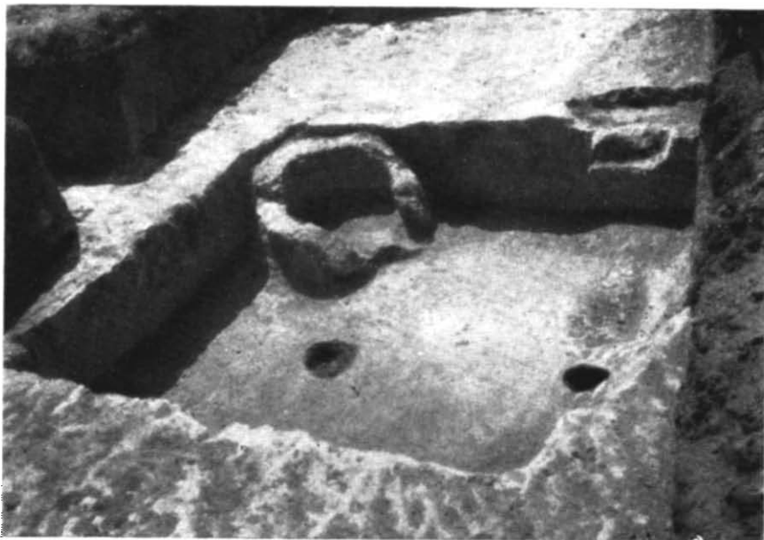
Рис. 2. Залишки напівземлянки № 1 на городищі біля с. Жовнин.

Третя група кераміки близька до другої групи і відрізняється від неї лише профілем вінець (рис. 3, 6, 7, 8). Вінця цієї групи дуже відігнуті назовні, по їх краю з внутрішнього боку проведена глибока боро-