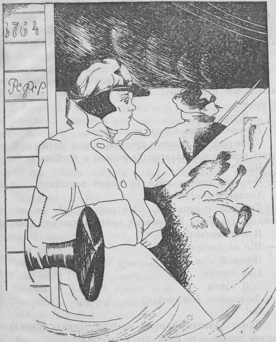
Частенько товариш Жучок виходила з вагона, і довго її не було. А відтіля вона приходила завжди в зажурі.