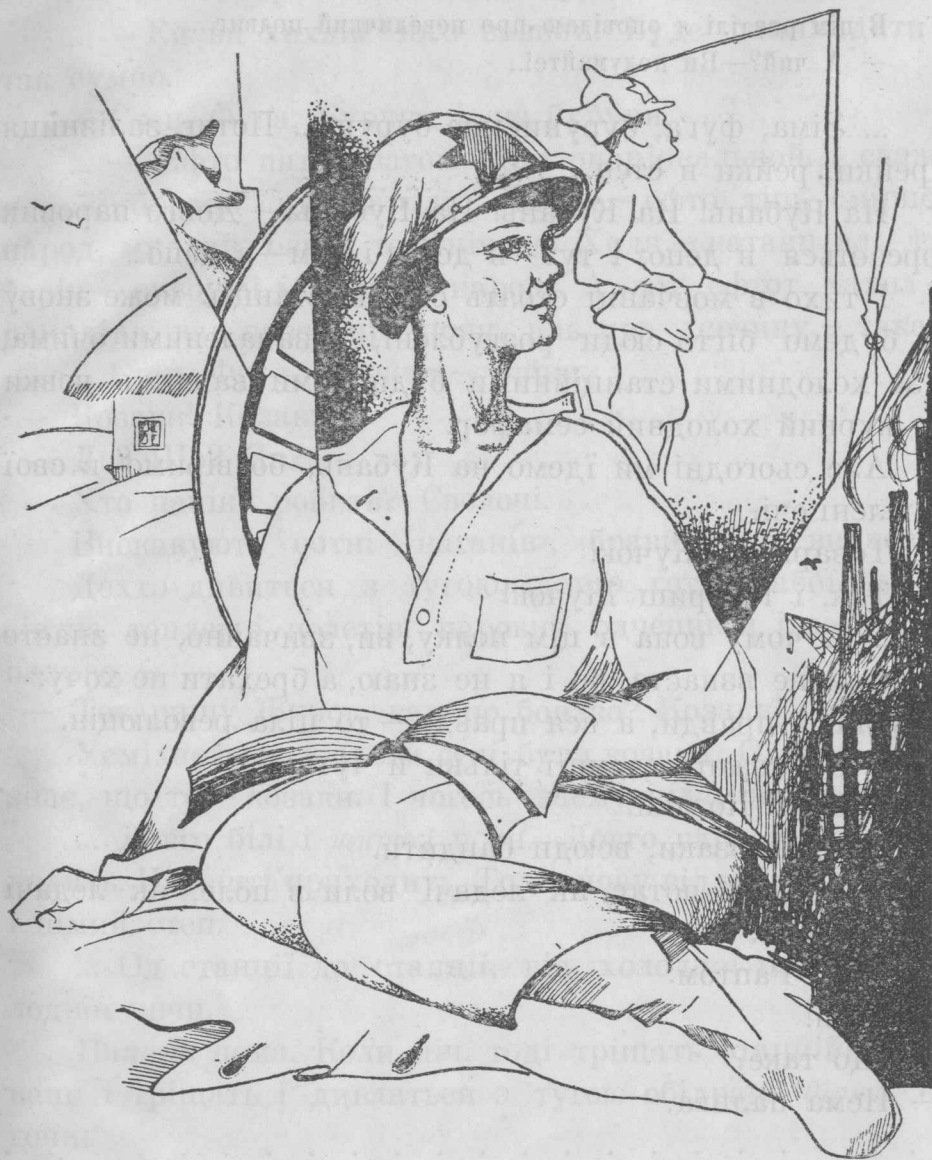
Кіт у чоботях № 1.

Так от. Це не роман, це тільки маленька пісня, і я її скоро скінчу.