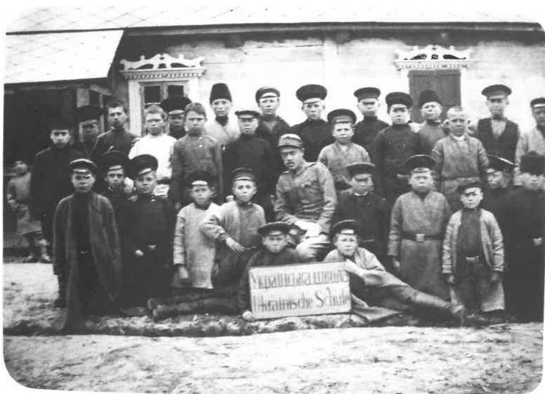
16. Учні української народної школи на уроці.

с. Підгороднє, Волинська обл., червень, 1917 р.