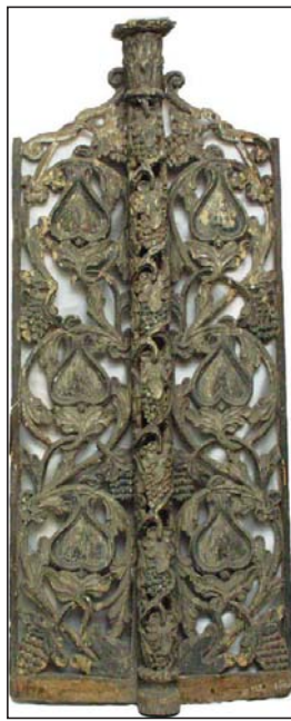
Царські врата іконостаса церкви Святих Кузьми і Дем'яна 1737 р. в с. Леляки. НХМУ