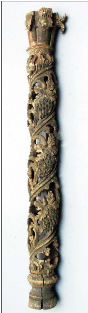
Колонки іконостаса із церкви Святих Кузьми і Дем'яна 1737 року в с. Леляки. НХМУ