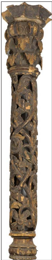
Колонка іконостаса із церкви Успіння Богоматері 1737 р. в с. Піски-Бершадські. НХМУ