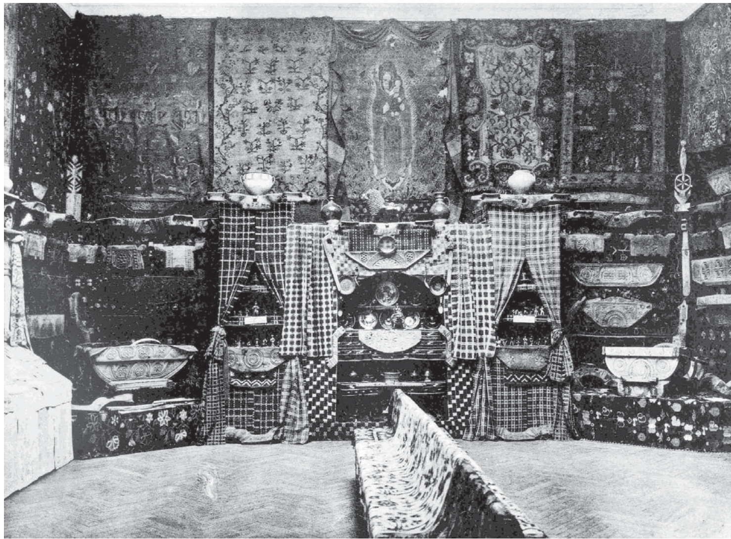
Експозиція Першої південноросійської кустарної виставки. 1906 р.

ти на стінах речі, то нам не тільки стало мало двох зал, але був зайнятий весь верхній поверх музею, де було аж п'ять зал, вестибюль та переходи зі сходами. Розвісивши на стінах, ми самі побачили у всій силі красу нашого мистецтва. Ми (троє) перестали вже боятися за успіх виставки, а відвідування публіки перевершило навіть найбільш оптимістичні припущення в декілька разів” 14 . Активну участь братів Щербаківських у підготовці виставки засвідчила й О. Косач, яка назвала їх першими серед “ревних помічників” директора КХПНМ 15 .