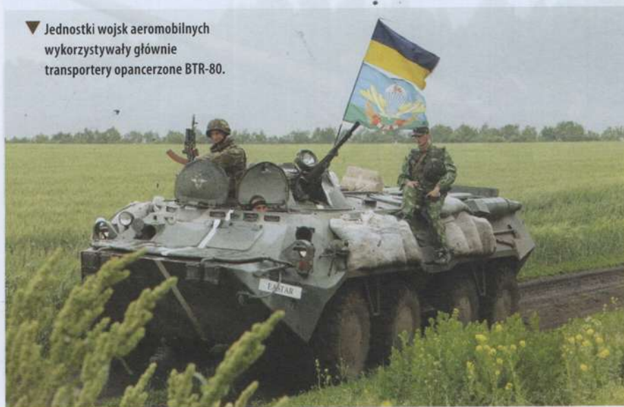
▼ Jednostki wojsk aeromobilnych wykorzystywały głównie transportery opancerzone BTR-80.

brygad rakiet operacyjno-taktycznych. W 1992 roku rozwiązano prawie wszystkie takie brygady znajdujące się na terytorium Ukrainy. Na początku 1993 roku w WL Ukrainy pozostały w zasadzie tylko brygady raketowe rakiet taktycznych, które były uzbrojone w dość nowoczesne taktyczne kompleksy raketowe Toczka i Toczka-U . Do 1994 roku rozwiązano ostatnią brygadę raketową OTR – 162. w Białej Cerkwi, uzbrojoną dotychczas w systemy raketowe 9K72 Elbrus .