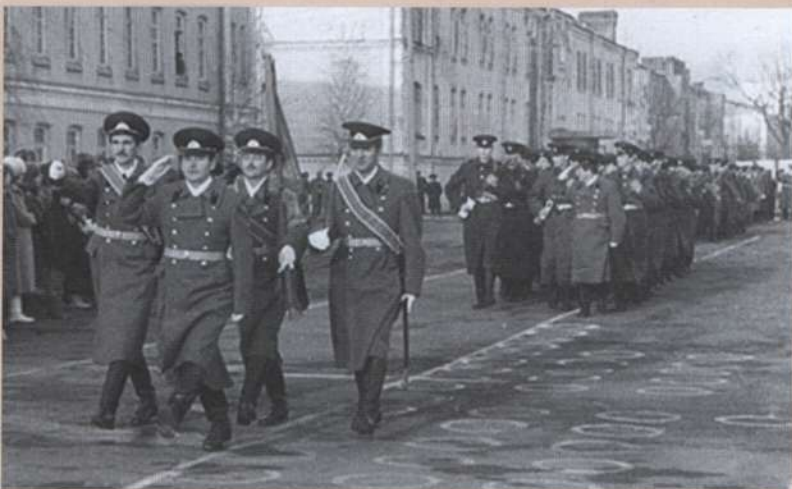
▲ Pierwszą jednostką, która złożyła przysięgę na wierność Ukrainie był 55. Samodzielny Pułk Łączności stacjonujący w Równem i wchodzący w skład 13. Armii.

Większość związków taktycznych i formacji Wojsk Lądowych Związku Radzieckiego na terytorium Ukrainy składała się z jednostek o stanach zredukowanych, które miały być rozwijane do poziomu bojowego dopiero podczas mobilizacji. Osobliwością procesu formowania radzieckich Wojsk Lądowych na terytorium Ukrainy był ich skład, który w zasadzie ustabilizował się pod koniec lat 70. XX wieku, a w ciągu następnej dekady znacznie się zmienił. Powodem był kryzys polityczny w Związku Radzieckim, który rozpoczął się pod koniec lat 80. i doprowadził do ostatecznej likwidacji sowieckiego imperium. ZSRR został zmuszony pod naciskiem demokratycznych ruchów politycznych w krajach Europy Wschodniej (przede wszystkim w Polsce, Czechosłowacji i na Węgrzech) do rozpoczęcia wycofywania swoich wojsk na terytorium Związku Radzieckiego, w tym Ukrainy. Dywizje, które wcześniej znajdowały się na terenie ZSRR (głównie skadrowane) zaczęto przekształcać w bazy przechowywania broni i sprzętu. W ich