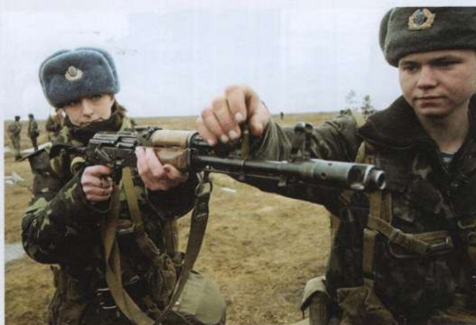
▲ Po odzyskaniu niepodległości, w Siłach Zbrojnych Ukrainy znacząco wzrosła liczba kobiet. Jednak przez długi czas w armii dalej umundurowanie typu dubok (powstały w 1984 roku) oraz radzieckie czapki-uszanki.

W bezpośrednim podporządkowaniu dowódcy OdWO znajdowały się: 28. DSZmot (Czornomorskie, obwód odeski), 150. GwOOS (do szkolenia młodszych specjalistów strzelców zmotoryzowa-