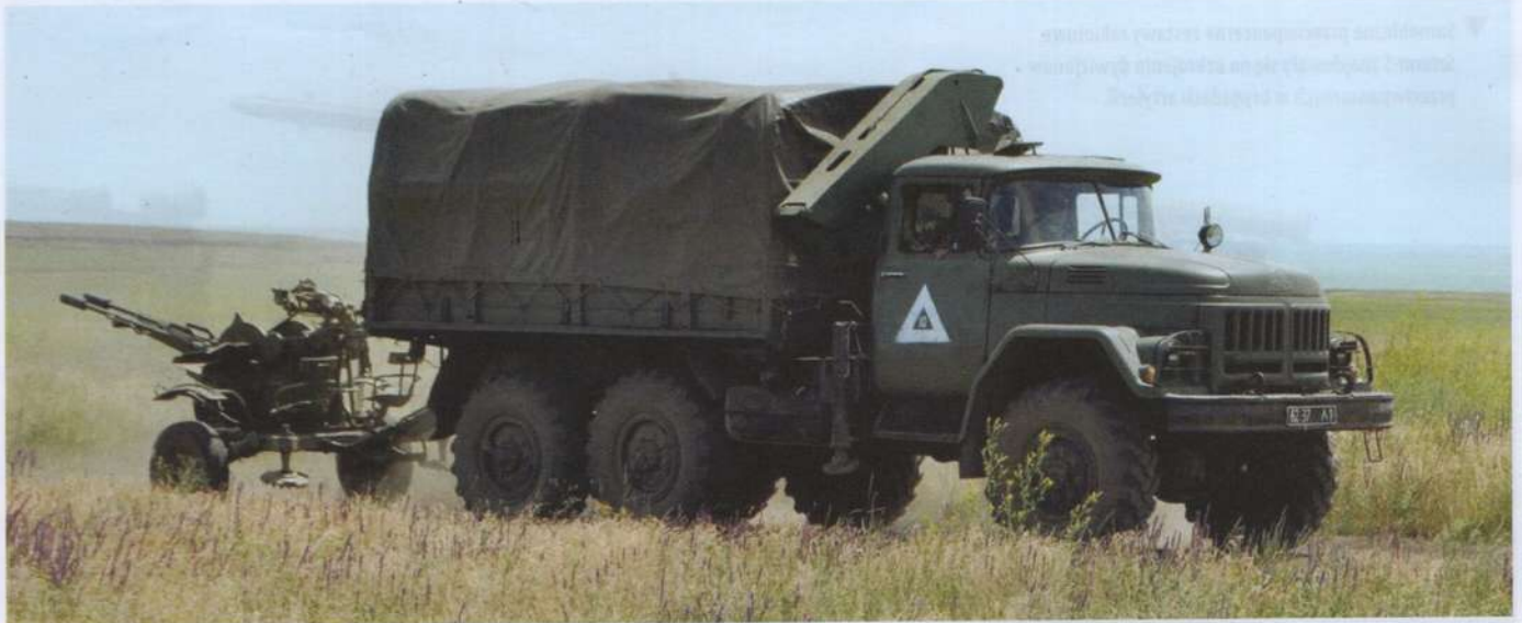
▲ Dekada lat 90. dla nowo utworzonej armii ukraińskiej w pierwszej kolejności oznaczała duże redukcje, następnie realizację różnych, nie zawsze trwałych, koncepcji organizacyjnych.

Na podstawie tego eksperymentu planowano przeformować na strukturę brygadową inne dywizje. Do końca 1999 roku 66. DZmech miała przejść na strukturę dwubrygadową; w latach 1999–2000 również 51. DZmech składałaby się już z dwóch brygad, a 24. DZmech z trzech brygad. Z kolei w latach 2000–2002 na strukturę trzybrygadową miała przejść 128. DZmech. Planowano także utworzenie nowej dywizji na bazie dwóch już istniejących brygad: 97. i 161. Podobne przekształcenia zaplanowano dla innych dywizji: 17. i 30. DPanc oraz 72., 93. i 25. DZmech. Wszystkie te plany nie zostały jednak zrealizowane. Zamiast tego, w 2000 roku, 66. DZmech w Czerniowcach została przeformowana w 22. SBZmech.