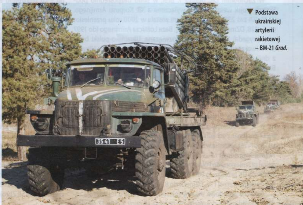
▼ Podstawa ukraińskiej artylerii raketowej – BM-21 Grad .