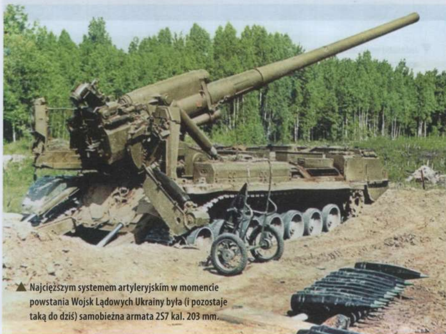
▲ Najcięższym systemem artyleryjskim w momencie powstania Wojsk Lądowych Ukrainy była (i pozostaje taką do dziś) samobieźna armata 2S7 kal. 203 mm.

W opracowanej koncepcji główną rolę w nowo tworzonych siłach zbrojnych przypisano Wojskom Lądowym – najliczniejszemu komponentowi byłego sowieckiego zgrupowania na terytorium Ukrainy. Ale proces faktycznego tworzenia Wojsk Lądowych SZ Ukrainy natychmiast napotkał na szereg istotnych problemów, których nie można było szybko rozwiązać. Pierwszą pilną potrzebą była znacząca redukcja armii, gigantycznej jak na Ukrainę, której państwo po prostu nie było w stanie utrzymać w warunkach kryzysu z początku lat 90. Również Ukraina, która ratyfikowała wcześniej zawarty przez ZSRR traktat o konwencjonalnych siłach zbrojnych w Europie, musiała zre-