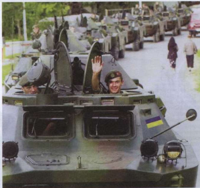
▲ Kolumna BRDM-2 ze składu ukraińskiego kontyngentu w Kosowie (1992 rok).

Dowództwo i sztab 8. Armii Pancernej znajdowały się w Żytomierzu, a do głównych jej składowych zaliczyć należy: 30. Gwardyjską Dywizję Pancerną w Nowogrodzie Wołyńskim (obecnie Zwiagel), 6065. BPBS w Owruchu (wcześniejsza skadowana 23. DPanc, ale po katastrofie w Czarnobylu w 1986 roku, miejscowość ta znalazła się w strefach skażenia, w związku z czym 1 lipca 1990 roku dywizję przekształcono w bazę przechowywania broni i sprzętu), 5358. BPBS w Chmielnickim (była skadowana 50. DPanc).