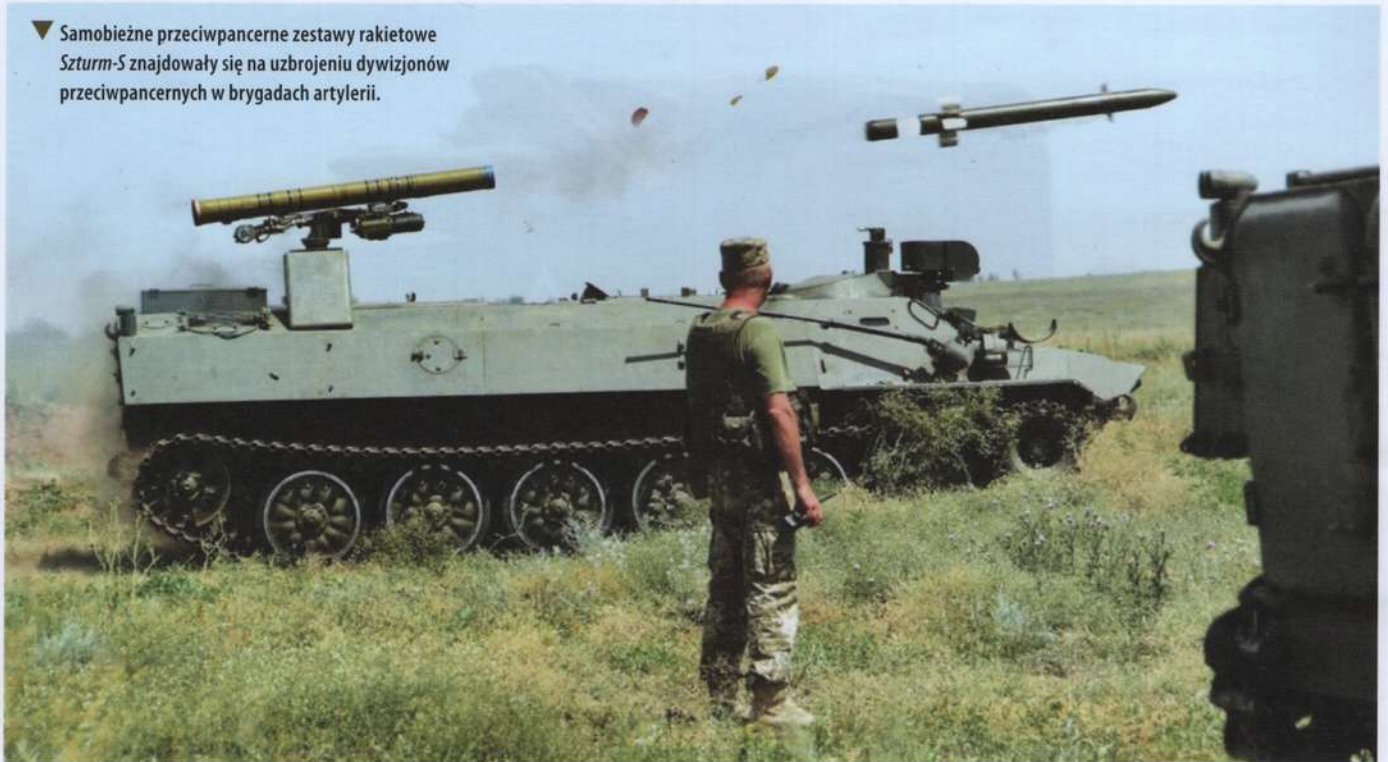
▼ Samobieżne przeciwpancerne zestawy raketowe Szturm-5 znajdowały się na uzbrojeniu dywizjonów przeciwpancernych w brygadach artylerii.

raketowe 9K79 Toczk a, ale po włączeniu do 1. Dywizji Rakietowej otrzymała zestawy R-300.