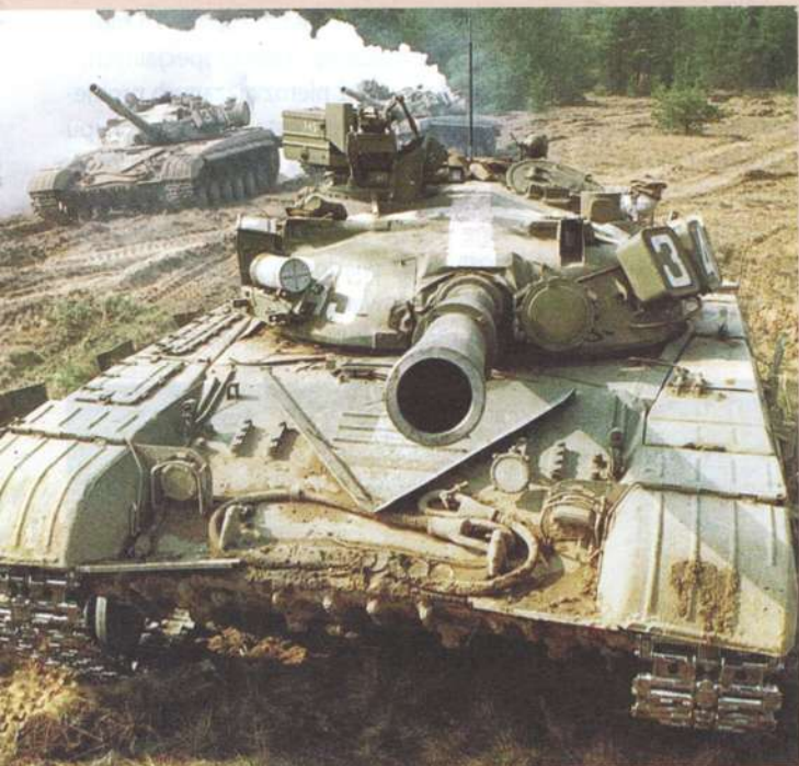
▲ Rodzina T-64 była podstawowym typem czołgu radzieckich wojsk lądowych rozmieszczonych na terenie Ukrainy.