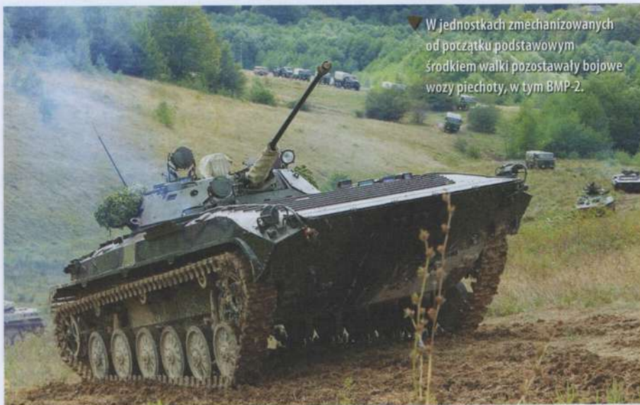
▼ W jednostkach zmechanizowanych od początku podstawowym środkiem walki pozostawały bojowe wozy piechoty, w tym BMP-2.