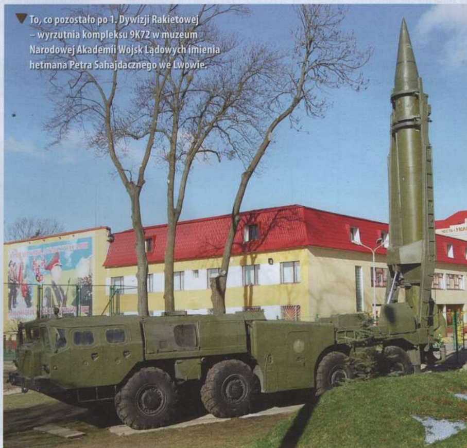
▼ To, co pozostało po 1. Dywizji Rakietowej – wyrzutnia kompleksu 9K72 w muzeum Narodowej Akademii Wojsk Lądowych imienia hetmana Petra Sahajdacznego we Lwowie.