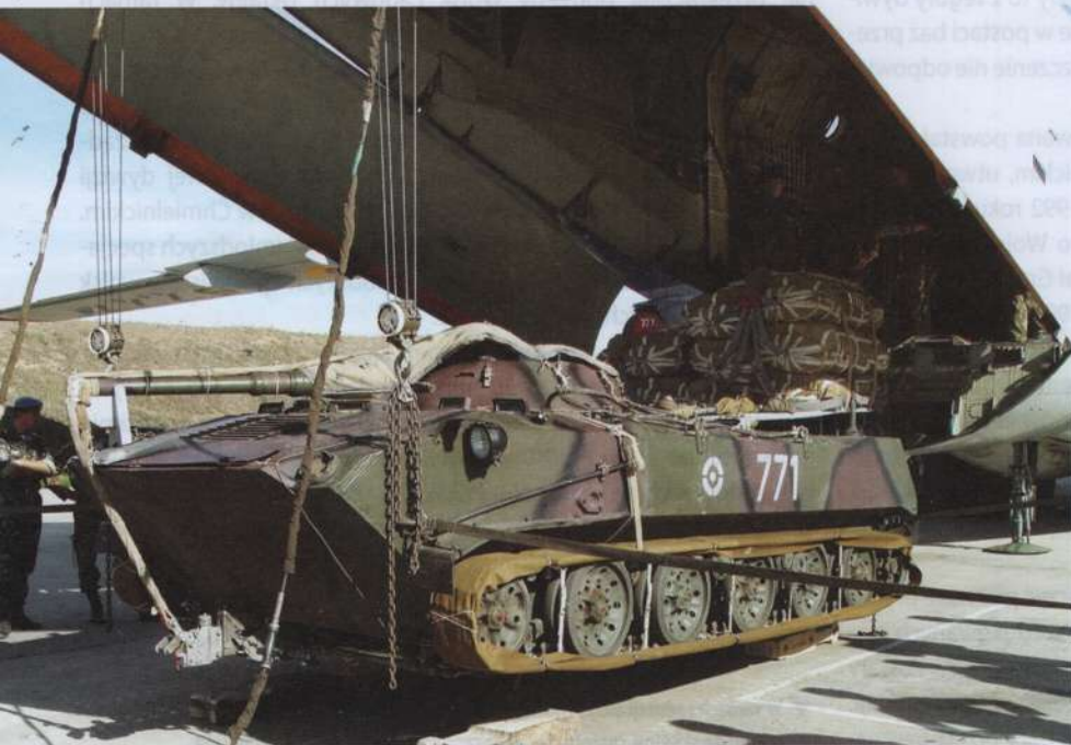
▲ Ładowanie do samolotu Il-76 bojowego wozu desantu BMD-1, przygotowanego do zrzutu ze spadochronem.

W lipcu 1996 roku podjęto decyzję o przekazaniu wszystkich brygad i pułków sił obrony powietrznej Wojsk Lądowych do Wojsk Obrony Powietrznej SZ Ukrainy, którym powierzono zadanie ochrony przestrzeni powietrznej nie tylko całego kraju, ale także części Wojsk Lądowych. Przekazano 68. i 77. Samodzielne Brygady Radiotech-