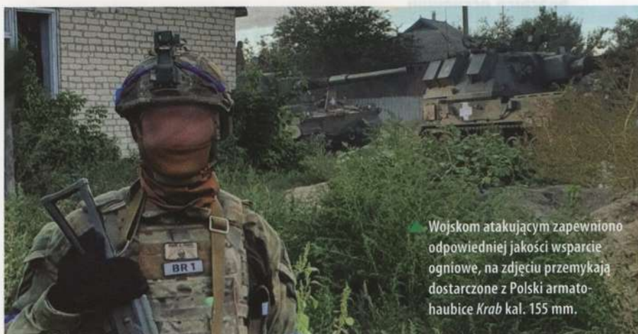
▶ Wojskom atakującym zapewniono odpowiedniej jakości wsparcie ogniowe, na zdjęciu przemykają dostarczone z Polski armato-haubice Krab kal. 155 mm.

ny, generał brygady Ołeksij Gromow, poinformował, że na kierunku charkowskim jednostki SZ Ukrainy przedarły się przez obronę wroga i weszły na głębokość 50 km. Wyzwolono ponad 20 osad, w których trwać miały operacje oczyszczania. Charakterystycznym było, że generał Gromow w swoim wystąpieniu wskazał, że działania SZ Ukrainy na kierunku Charkowa odbywały się „w ramach operacji obronnej”. Odpowiednie informacje pojawiły się także w porannym raporcie operacyjnym Sztabu Generalnego SZ Ukrainy z dnia 9 września.