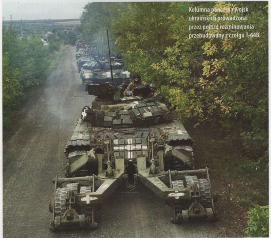
Kolumna pancerna wojsk ukraińskich prowadzona przez pojazd rozminowania przebudowany z czołgu T-64B.

Charakterystyczną cechą charkowskiej operacji ofensywnej było powszechne użycie broni i sprzętu wojskowego przekazanego przez sojuszników Ukrainy. W szczególności chodzi tu o przekazane przez Polskę czołgi T-72M1 i zmodernizowane T-72M1R, gąsienicowe transportery opancerzone M113G4DK i M113A54 (odpowiednio z Danii i Australii), francuskie kołowe transportery opancerzone VAB, tureckie Kirpi , a także zmodernizowane gąsienicowe transportery opancerzone MT-LB z bezałogowymi modułami bojowymi Serdar produkcji tureckiej. Mobilne grupy rajdowe, wraz z samochodami HMMWV i różnego rodzaju półciężarówkami, używały kołowych pojazdów opancerzonych Bushmaster (australijskich) i MaxxPro (amerykańskich), rzadziej – brytyjskich lekkich gąsienicowych transporterów opancerzonych Spartan . Grupy wsparcia artyleryjskiego korzystały z dział samobieżnych Krab (produkcji polskiej), PzH2000 (dostarczonych przez Niemcy i Holandię) i M109A3GN (eks-norweskich), a także wyrzutni rakietowych M142 HIMARS i M270 MLRS.