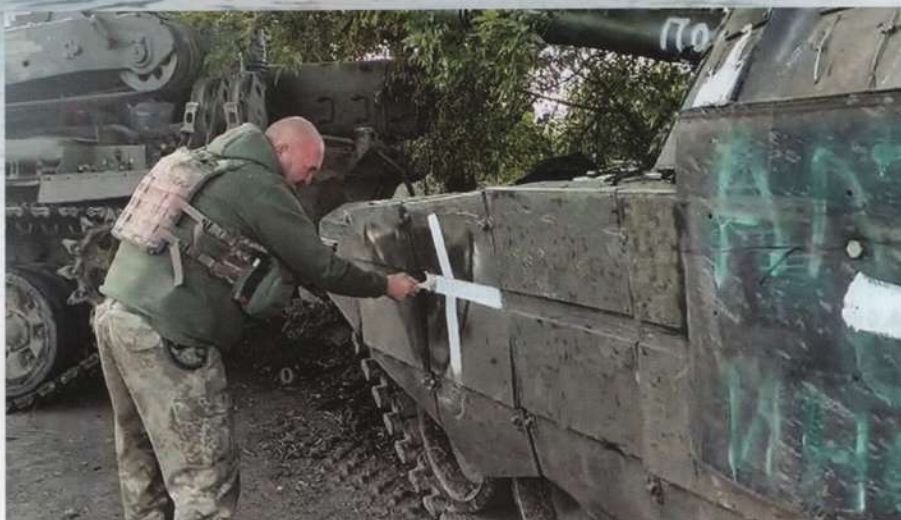
▲ Na sprzęcie własnym i zdobyczym wojska ukraińskie w celach szybkiej identyfikacji nanosiły charakterystyczne oznaczenia „+”.

Źródła rosyjskie już 10 września twierdziły, że przerzut posiłków w rejon ukraińskiej ofensywy jest prowadzony wyłącznie w celu zapewnienia odwrotu zgrupowania rosyj-