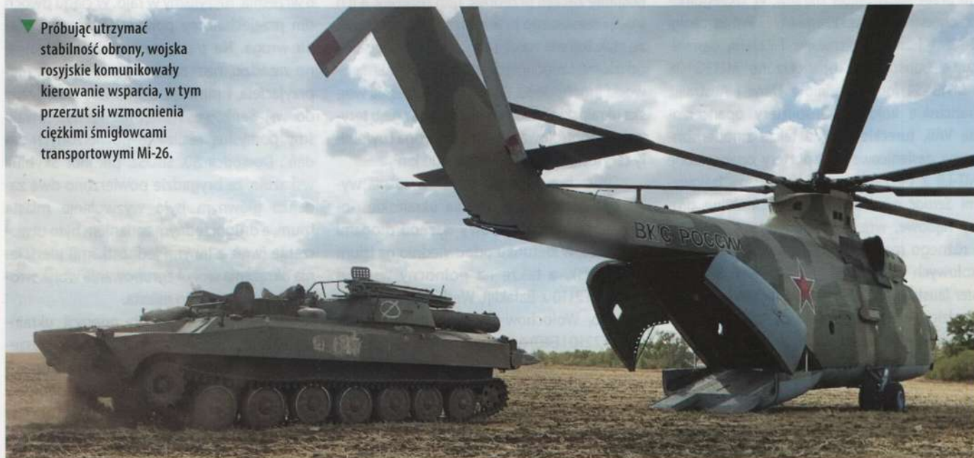
▶ Próbuąc utrzymać stabilność obrony, wojska rosyjskie komunikowały kierowanie wsparcia, w tym przerzut sił wzmocnienia ciężkimi śmigłowcami transportowymi Mi-26.

Wieczorem 10 września Ministerstwo Obrony Federacji Rosyjskiej ogłosiło wycofa-