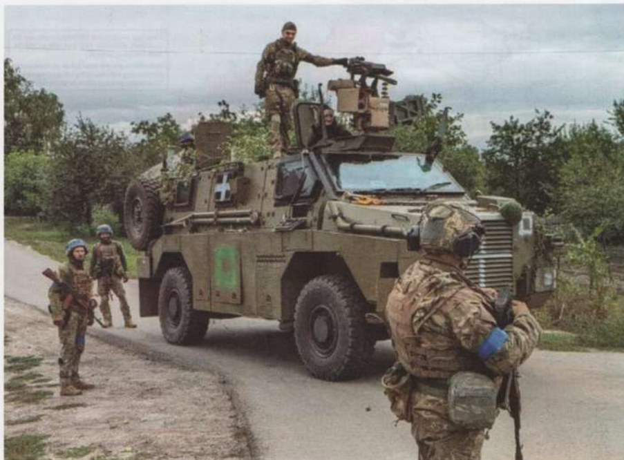
▲ Charakterystycznym elementem ukraińskich działań była duża dynamika, do czego wykorzystano grupy rajdowe wyposażone między innymi w kołowe Bushmastery (na zdjęciu) czy HMMWV.

kolejowej Wałujki – Kupiańsk. Jest ona dwutorową, zelektryfikowaną linią o dużej przepustowości i dobrze wyposażonej lokomotywowni w Kupiańsku. Kontrola tego szlaku (oraz jego przedłużenia do Łymanu, Gorłówki i Iłowajska) umożliwiła Rosjanom zaopatrzenie najkrótszą drogą wojsk okupacyjnych w Donbasie i w razie potrzeby manewrowanie siłami między różnymi odcinkami frontu. Mniej ważna jest linia Kupiańsk – Wowczańsk (z kontynuacją do Biełgorodu), która jest jednotorowa i nieelektryfikowana. Powrót tych linii wraz ze stacją węzłową Kupiańsk pod kontrolę ukraińską znacznie utrudniłby rosyjskiemu dowództwu rozwiązywanie zadań logistycznych i stworzyłby warunki do dalszego wyzwalań okupowanych terytoriów.