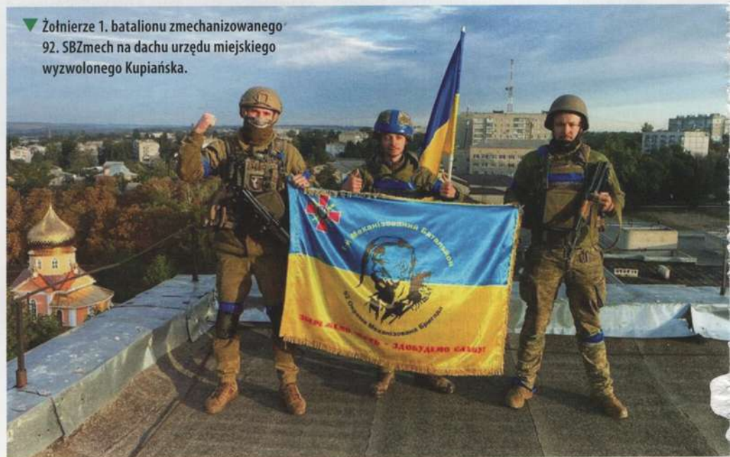
▼ Żołnierze 1. batalionu zmechanizowanego 92. SBZmech na dachu urzędu miejskiego wyzwolonego Kupiańska.