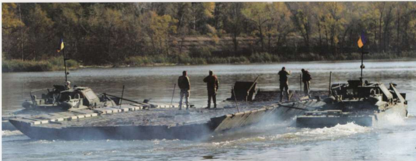
▲ Po dojściu do rzeki Oskół, wojska ukraińskie stanęły przed zadaniem sforsowania przeszkody wodnej.