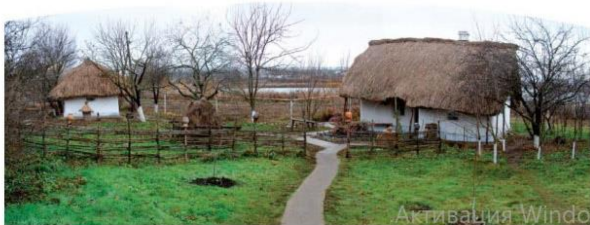
Музей І. Манжури. Загальний вигляд, 2009 р.

Активация Windows Чтобы активировать Windows, перейдите в меню «Параметры».