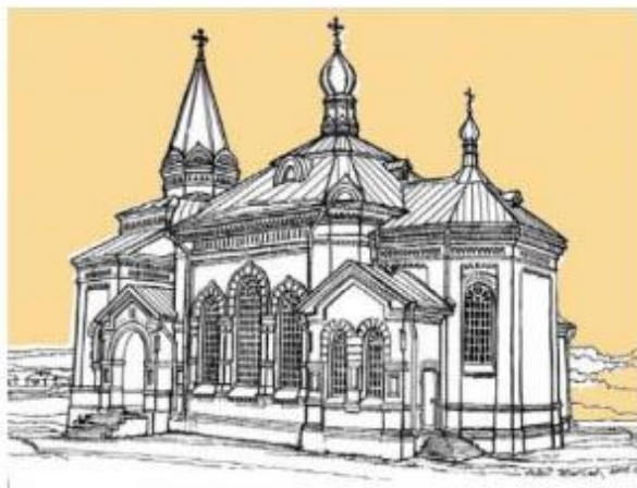
Покровський храм. Зовнішній вигляд із південного сходу на початку ХХ ст. Реконструкція автора, 2008 р.

Навколишнє поселення формується приватною забудовою одно- та двоповерховою. Із західної сторони від пам'ятки територія обмежена береговою смугою ставка, поблизу якої влаштовано садибні ділянки. Зі східної сторони за окремо розробленим проектом формується сучасна (нова) церковна ділянка з різноманітними культовими та господарськими спорудами (каплиця, трапезна, будинок недільної школи з домовою церквою), а також цвинтарем. Південніше церкви влаштована криниця зі свяченою водою та музей просто неба — відтворена сільська садиба з будинком та господарськими спорудами (хата поета І. Манжури). Уся територія навколо церкви має добрий благоустрій: багато зелених насаджень, насипні, мощні та ґрунтові доріжки.