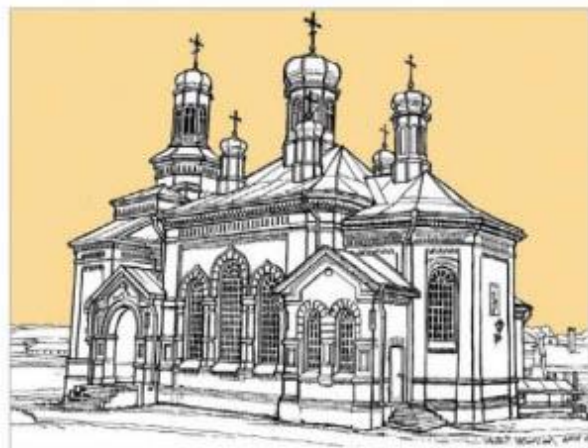
Покровський храм. Сучасний вигляд із південного сходу. Малюнок автора, 2008 р.

ною частиною церкви. Під час візуального обстеження склепу виявилось, що грабіжники знали точне місце розташування склепу, оскільки отвір пробито у самісінькому центрі камери!