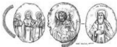
Покровський храм. Натільні медальйони (Василя Великого, Григорія Богослова й Іоанна Златоуста) з храмової усипальниці. Малюнок автора, 2008 р.

Склеп не розчищався. Кістки було розкидано по доливіці, череп небіжчика відсутній. Збереглися натільні іменні іконки-медальйони овальної форми в металевому обрамленні з зображеннями святих покровителів. На одному зображено Три святителя, інший мас