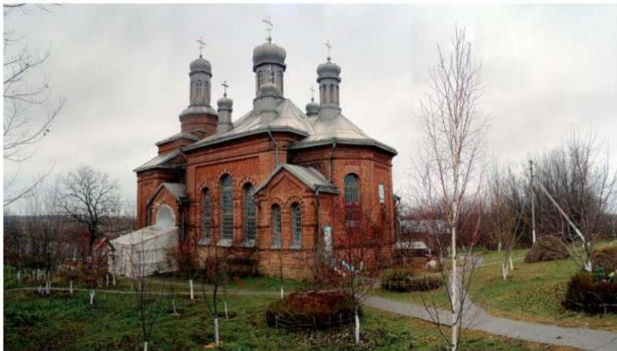
Покровська церква з прилеглою територією в 2009 році

З картографічними матеріалами сер. XIX ст. поселення Григорівка (саме так називалося сучасне село Рубанівське Васильківського району Дніпропетровської області) розташовувалося по обох схилах невеликої балки Скотуватої, яка тяглася з півдня на північ і врізалася з південного сходу в давню балку Соломчину. Навпроти злиття балок на протилежному боці балки Соломчини, на високому місці знаходився родовий маєток дворян Василенків. Головною споруд