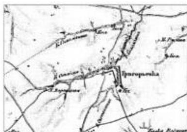
Поселення Григорівка за картографією сер. XIX ст.

Прикрасою споруди слугує двоюрсна дзвіниця, увінчана цегляним восьмистороннім верхом з декоративним нарізком і металевим макіяком. Вівтар та центральний об'єм також мають верх, увінчаний декоративним