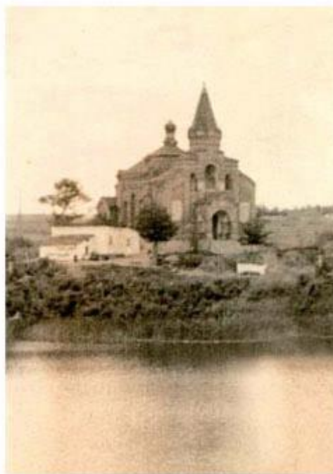
Такою була Покровська церква на поч. XX-го ст.