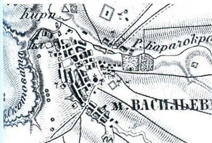
Мал.2. Містечко Василівка на фрагменті військово-топографічної мапи Російської імперії фр. пол. XIX ст.

Археологічні знахідки розповідають про заселення територій сучасного міста та зокрема музею-заповідника та його околиць з давніх часів. Навколо Василівки існує величезна кількість курганів. В північно-західній околиці міста, біля підніжжя Лисої гори, було розкопано могильник доби неоліту (V тисячоліття до н.е.), де виявлено понад 30 поховань. Деякі джерела вказують, що поблизу річки Карачекрак на рубежі XVII-XVIII ст. ст. існував крупний ногайський аул, неподалік якого в 1736 р. росіянами було влаштовано редут. Саме його (аул) зображено на мапі 1767 р. на правому березі Карачекрака (мал. 1) на березі невеличкої затоки в місці впадіння у Дніпро.