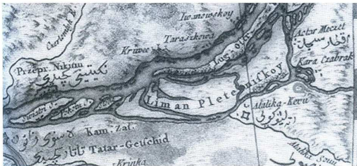
Мал.1. Місце розташування Василівки на мапі Річі Заноні 1767 р. На протилежному березі Карачекрак добре видно поселення «KaraCzabrak».

пографічного, використання історії в якості контексту та вивчення власне пам'ятки.