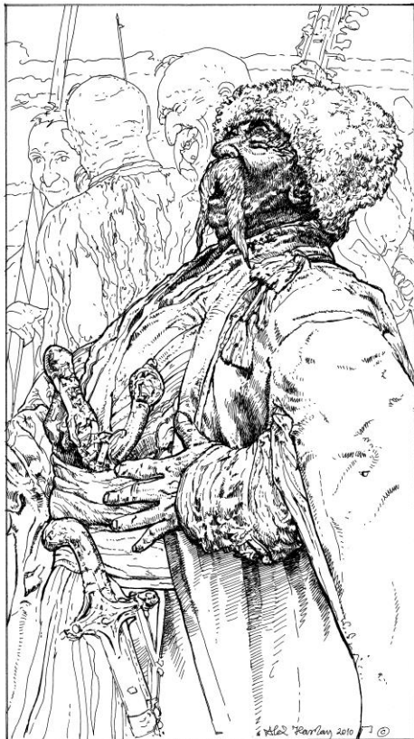
Фрагмент картини «Запорожці...». Прорис автора 2007 р.

1891 р. – І.Ю. Рєпін закінчив основний варіант картини “Запорожці пишуть листа турецькому султану” і вперше виставив її на персональній виставці у м. Петербурзі (120 років події).