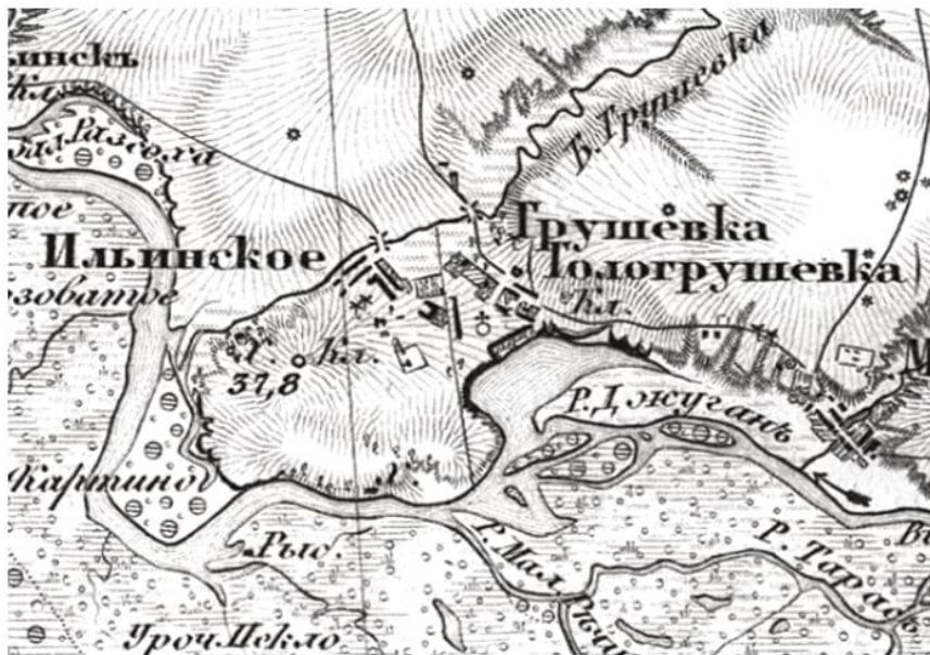
Мал.1. Фрагмент карти російського Військово-топографічного депо. 1875 р. (Шуберта) [6].

Звісно, це – певний етап історичного процесу «пригадування» знівельованої в радянську добу історії рідного краю. Попереду археологічне дослідження фундаменту кам'яної церкви, локалізація місць розташування першої – дерев'яної церкви (яку малював Ілля Рєпін), козацького цвинтаря (інформацію про який ми знайшли в далекому Санкт-Петербурзі). Археологічні дослідження колишнього церковного місця дозволять відкрити численні загадки з історії храму і уможливлять задум про відбудову втрачених об'єктів і відтворення унікального середовища давнього поселення з багатою історією.