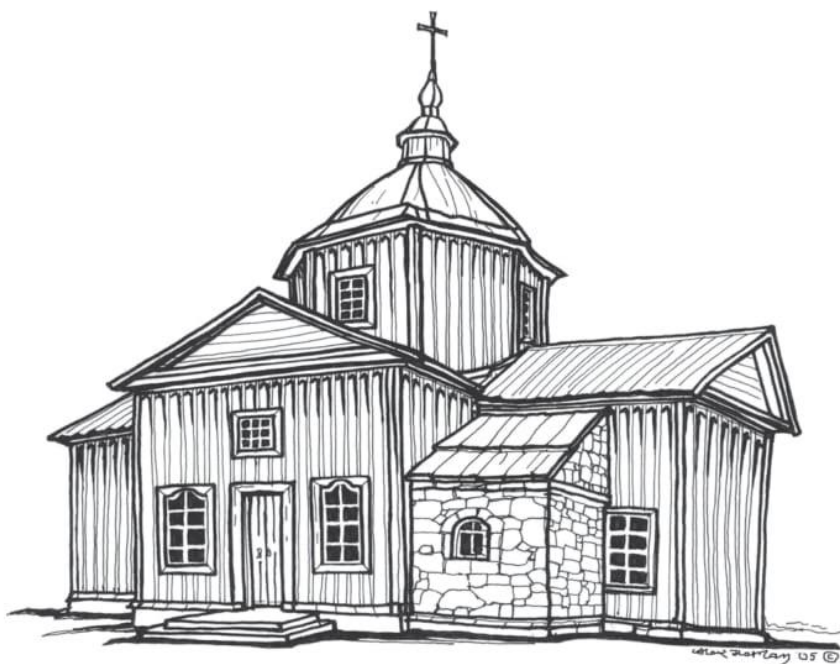
Мал. 4. Церква святого Архистратига Михаїла у селі Грушівка (Гологрушівка) Вишетарасівської волості Катеринославського повіту. Зовнішній вигляд 1880 р. з південного сходу. Прорис автора за малюнками Іллі Репіна (2005 р.).