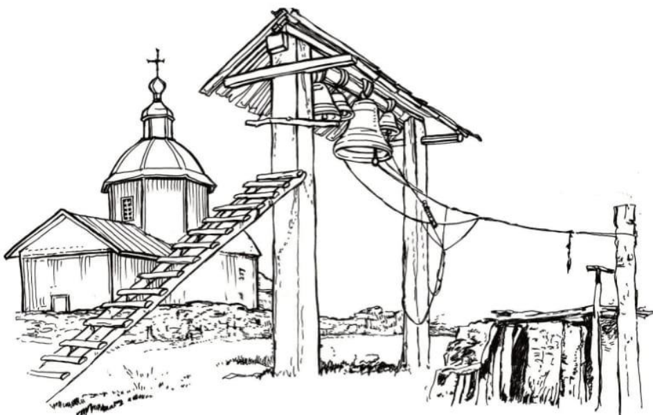
Мал. 5. Церква святого Архистратига Михаїла у селі Грушівка (Гологрушівка) Вишетарасівської волості Катеринославського повіту. Зовнішній вигляд 1880 р. з південного заходу. Прорис автора за малюнками Іллі Репіна (2005 р.).