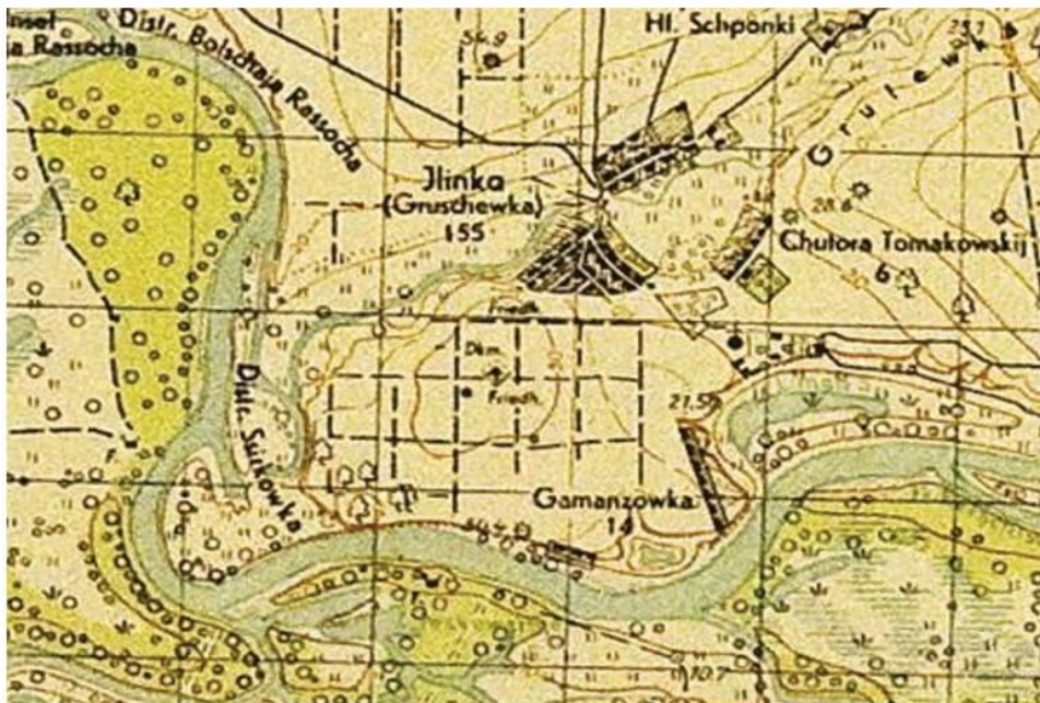
Мал. 2. Фрагмент німецької топографічної мапи 1943 р. [8].