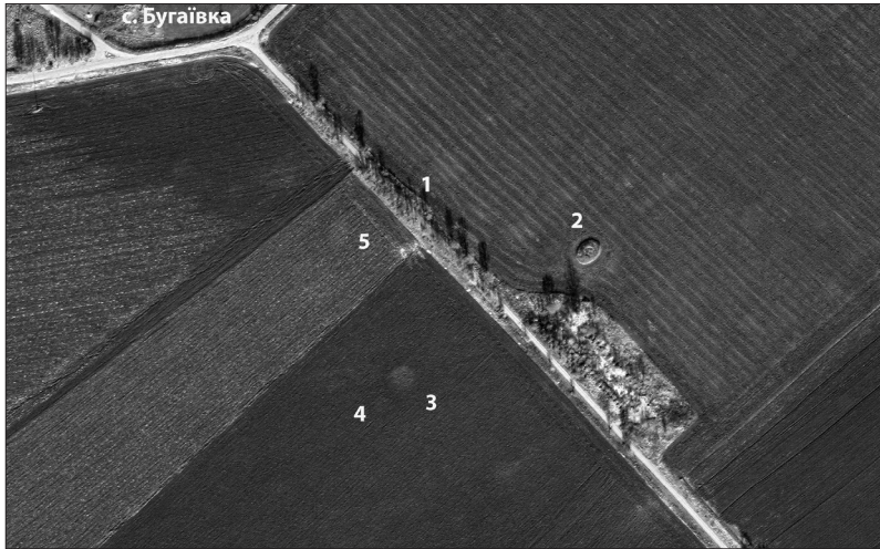
Рис. 2. Космознімок ділянки розміщення могильника. Цифрами показані знищений курган, де розміщувалася стела (1), відомі збережені насипи (2–3) та віртуально помітні (4–5) кургани.

сторонами завдовжки 8,0–8,5 м. У центрі in situ знаходилися основи від двох розбитих половецьких кам'яних статуй, фрагменти яких були розкидані навколо [13, с. 201]. Курган № 6, розташований західніше кургану № 5, був порушений городом. Каміні, які знаходилися на його поверхні, виявилися скинутими до підніжжя. Там же знайдено голову чоловічої статуї зі світлого пісковіку. На вершині кургану in situ знаходилися основи від двох половецьких статуй. У однієї з них, більш масивної, на східній грані збереглися дуже оббиті ступні ніг. Ця обставина вказує на положення цієї скульптури — обличчям на схід. Від іншої збереглася частина основи і кілька фрагментів [13, с. 202].