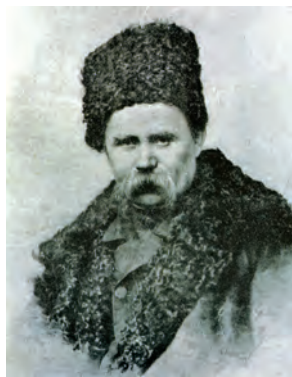
Портрет Т. Г. Шевченка. Худ. Ф. Красицький. Львів: Друкарня Ставропiгійського iнституту. 1909 р.