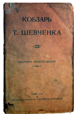
Т. Шевченко. Кобзар. Фототипiчне вiдтворення першого видання 1840 р. Львів. 1914 р.