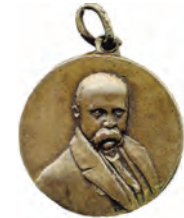
Ювiлейнi медалi та вiдзнаки, якi поширювались на українських землях на початку 20 ст.