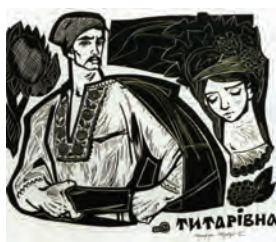
Шевченкiана Софії Караффи-Корбут