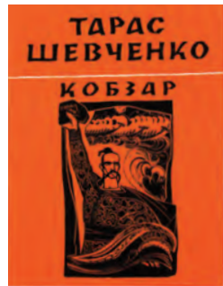
Тарас Шевченко. Кобзар. Iлюстрації Софії Караффи- Корбут. Київ: Видавництво художньої лiтератури “Днiпро”, 1967 р.