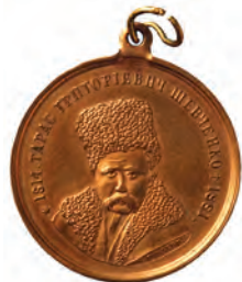
Медаль товариства “Сiч”