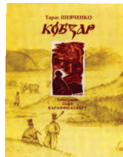
Тарас Шевченко. Кобзар. Iлюстрації Софії Караффи- Корбут. Львів: “Каменяр”, 2011 р.