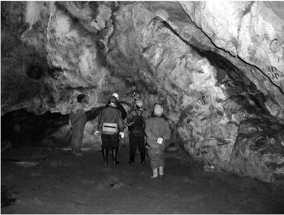
Рис. 2. Пізньопалеолітичні рисунки у Каповій печері. Фото І. Мінеєвої (вересень 2012 р.).

На території Державного природного заповідника «Шульган-Таш» (Бурзянський р-н, Республіка Башкортостан 1 ) музеєфіковано Капову печеру (рис. 1-2), у якій збереглися наскельні рисунки, найжданіший вік яких, визначений радіовуглецевим методом, становить 14,6–17 тисячоліть. Археолог О. Бадер (1960–1978) розробив програму збереження цієї пам'ятки, а геолог Ю. Ляхницький у 1980–2008 рр. склав план печери. З 1992 р. у заповіднику цілорічно функціонує музейно-екскурсійний комплекс, з 1999 р. поводиться геоecологічний моніторинг стану печери та фотофіксація виявлених зображень (яких станом на 2010 р. відомо 200).