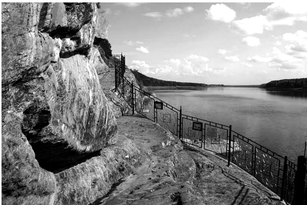
Рис. 3. Святилище Томська писаниця. Фото 2014 р. А. Кулемзіна.

Під керівництвом акад. О. Окладнікова у 1968 р. була розроблена наукова концепція Музею історії культури народів Сибіру та Далекого Сходу. 04.04.1980 р. Рада Міністрів РРФСР видала Постанову № 170 «Про організацію у м. Новосибірську Історико-архітектурного музею Сибірського відділення Академії наук СРСР». Архітектор, етнограф та музеолог А. Майнічева у 2000-х рр. розробила новий генплан музею із зонуванням археологічної секції (що функціонує з 1991 р.), а також програму консервації дерев'яних археологічних та архітектурно-етнографічних пам'яток.