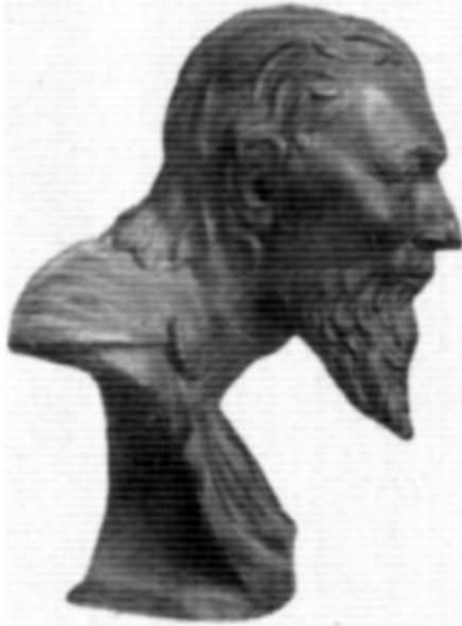
Рис. 3. Скіф з центрального поховання у мавзолеї Неаполя скіфського. Реконструкція М. М. Герасимова.

Коли абстрагуватися від таких спільних рис, як довге волосся і бороди, то з усіх перелічених П. М. Шульцем ознак залишається лише одна — «орлиний ніс» 23 . Дійсно, легко встановити, що овал обличчя на монетах ширший, нижня щелепа більш розвинена; на рельєфі, в свою чергу, знаходимо не такий опуклий лоб, як на одному з штемелів, і не такий низький, як на іншому (рис. 2). Нарешті, не можна ігнорувати й різницю у трактуванні головного убору, що її помітив ще П. Й. Бурачков 24 .