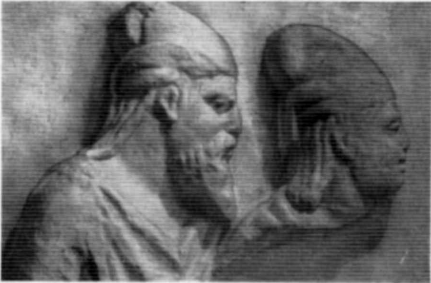
Рис. 2. Уламок рельєфу з Керменчика. Гіпсова копія.

Чверть століття тому на захист поглядів І. П. Бларамберга виступив П. М. Шульц 18 . Останній, по суті, повторив думки свого попередника, але якщо І. П. Бларамберг визначив монетний тип відповідно до своєї