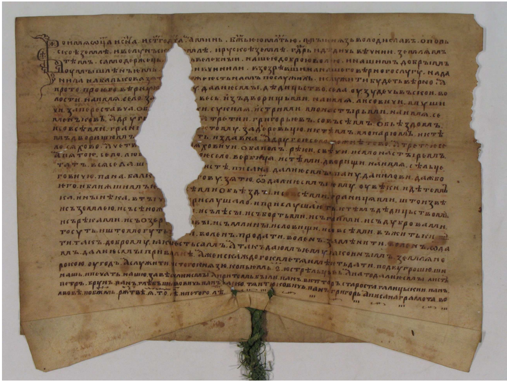
Грамота князя Володислава Опольського від 25–31 грудня 1375 р. (додаток № 1)