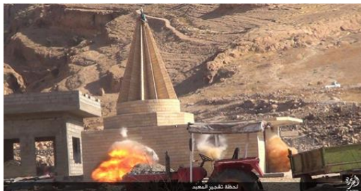
Руйнування Ісламською державою храму Кабара, Синджар, Аль-Джазіра, Ірак (2015 р.)

Геноцид єзидів , який здійснює ІДІЛ з 2014 р., призвів до руйнування 68 об'єктів спадщини, зокрема в районі Бахзані / Башіка та в районі Синджа. Знищення матеріальної та нематеріальної КС єзидів розглядають як важливий аспект політики етнічної чистки та геноциду. Звіт «Знищення душі єзидів: руйнування культурної спадщини Ісламською державою під час геноциду проти єзидів» (2019 р.)