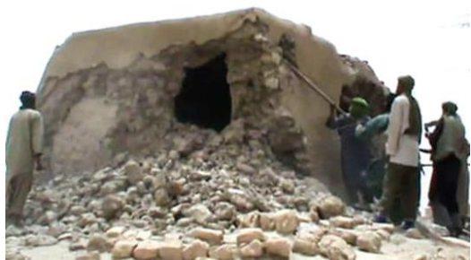
Бойовики-ісламісти руйнують стародавню святиню в Тімбукту