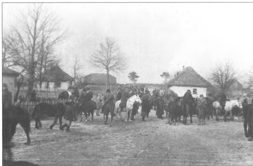
Партизани-ковпаківці під час Карпатського рейду в передмісті смт. Солотвино, Станіславська область, 1943 р.