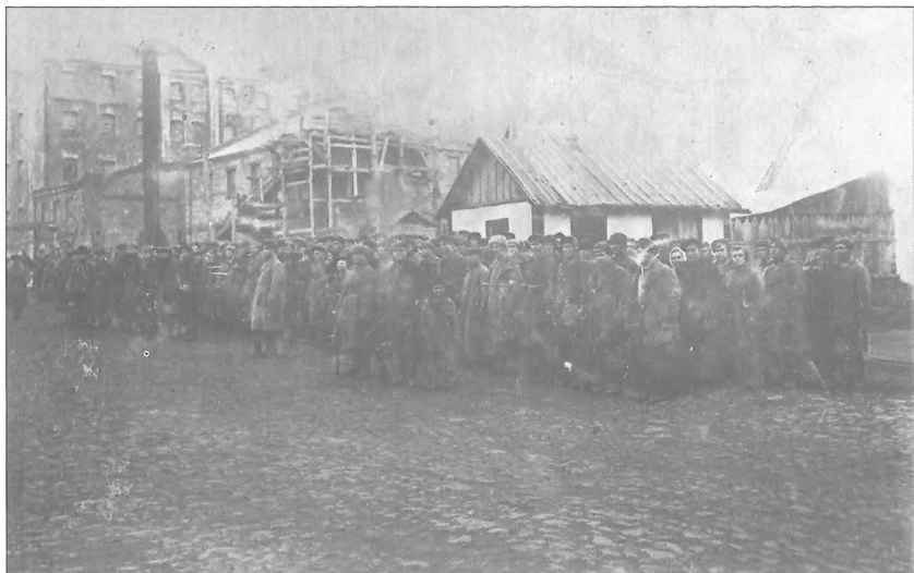
Васильківський партизанський загін перед з'єднанням з Червоною армією, Київська область, 15 листопада 1943 р.