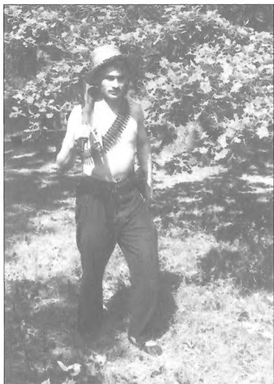
Віталій Голік — заступник комісара Житомирського партизанського з'єднання, 1943 р.