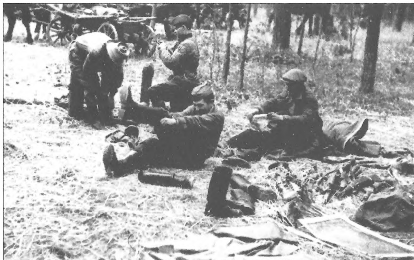
Бійці Сумського партизанського з'єднання готуються в дорозі, 1943 р.