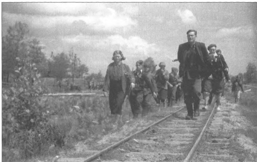
Третя рота Путивльського загону Сумського партизанського з'єднання просувається уздовж залізниці під час Карпатського рейду, 1943 р.