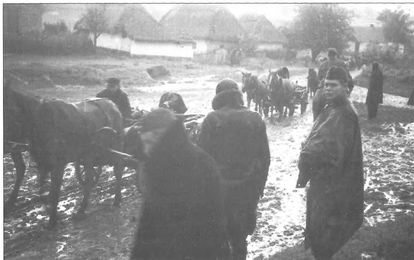
Бійці Сумського партизанського з'єднання проходять через населений пункт під час Карпатського рейду, Західна Україна, 1943 р.