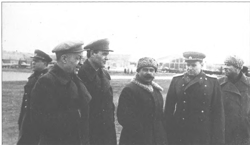
Група високопосадовців Української РСР, відповідальних за партизанську боротьбу в окупованій Україні, на аеродромі перед вильотом у тил противника. Зліва направо: Д. Коротченко, М. Гречуха, Л. Корнієць, Т. Строкач, м. Москва, РРФСР 18 квітня 1943 р.