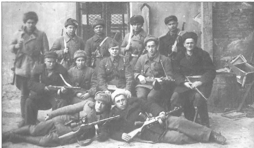
Диверсанти-випускники Школи особливого призначення (ШОП) при УШПР (м. Саратов, РРСФР), які діяли у складі групи під командуванням В. Храпка, 1942 р.