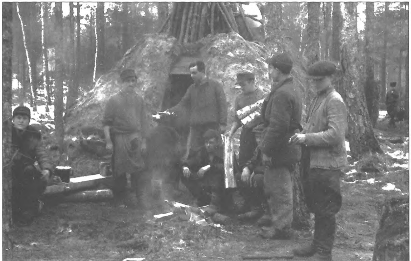
Кухня Сумського партизанського з'єднання. Ровенська область, 1943 р.