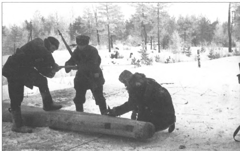
Партизани-підрильники Чернігівсько-Волинського з'єднання знищують проводи телефонного зв'язку противника, 1943 р.