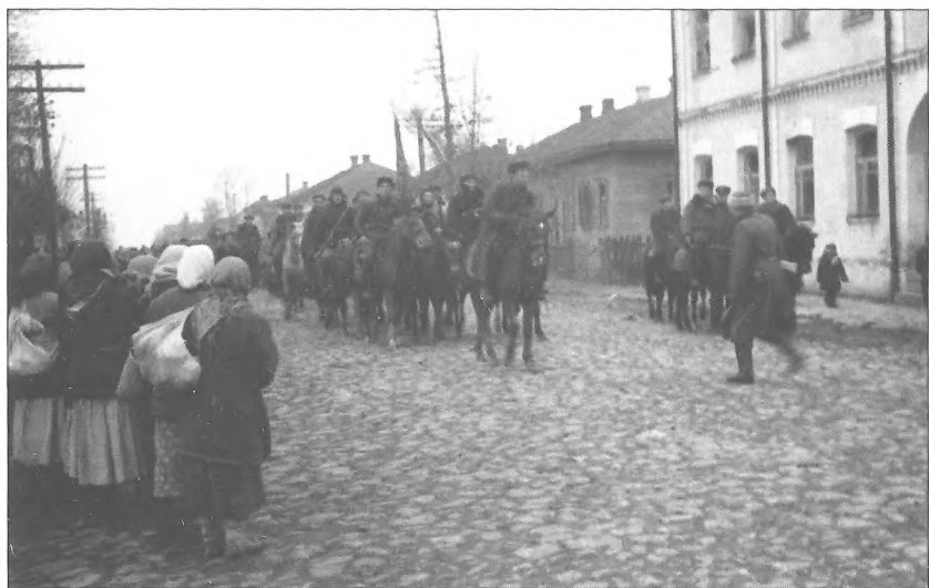
Бійці Житомирського партизанського з'єднання входять до звільненого ними м. Овруча, Житомирська область, 17 листопада 1943 р.