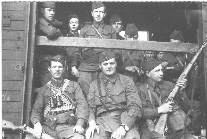
Особовий склад одного з партизанських полків НКВС в очікуванні відправки в тил противника, м. Київ, серпень 1941 р.