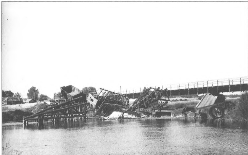
Міст через р. Горинь, підірваний бійцями Кам'янець-Подільського партизанського з'єднання ім. Михайлова, не пізніше 1944 р.