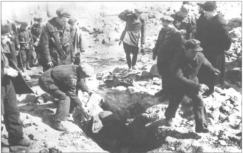
Одеські партизани виходять з катакомб після звільнення міста Червоною армією, квітень 1944 р.