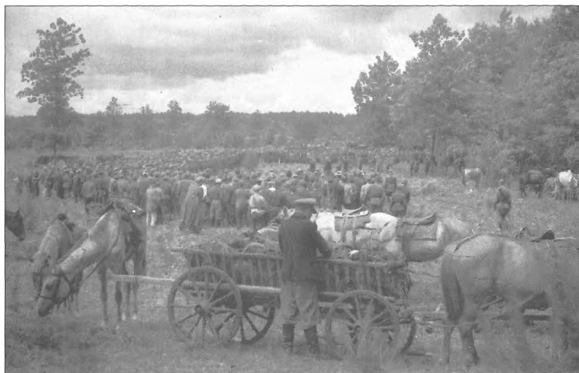
Мітинг у Сумському партизанському з'єднанні, присвячений виходу в Карпатський рейд, Поліська область, Білоруська РСР, червень 1943 р.