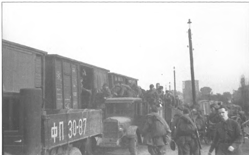
Завантаження ешелону з учасниками партизанських полків НКВС УРСР, м. Київ, серпень 1941 р.