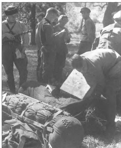
Бійці Житомирського партизанського з'єднання (командир О. Сабуров) розпаковують вантаж, що прибув з радянського тилу, х. Дубницький, Поліська область, Білоруська РСР, червень 1943 р.