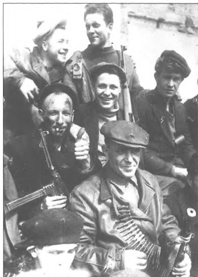
Одеські партизани після з'єднання з Червоною армією, квітень 1944 р.