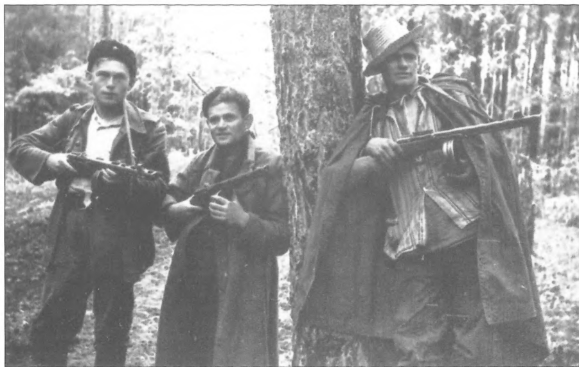
Бійці 1-ої Української партизанської дивізії ім. Ковпака, 1944 р.