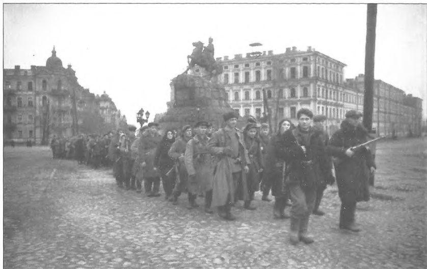
Партизани Великополовецького загону крокують площею Б. Хмельницького після розформування, м. Київ, листопад 1943 р.