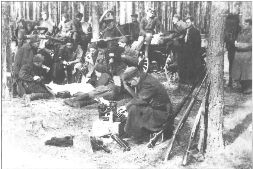
Штаб Путивльського об'єднаного партизанського загону під час обговорення подальшої роботи, Брянський ліс, РРСФР, травень 1942 р.