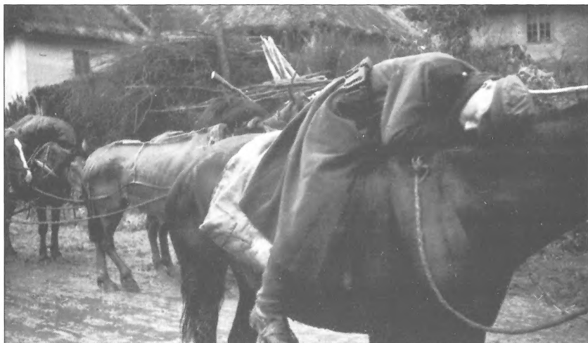
Бійці Сумського партизанського з'єднання на перепочинку під час Карпатського рейду, 1943 р.