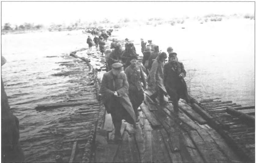
Бійці Сумського партизанського з'єднання переправляються через р. Прип'ять, квітень 1943 р.