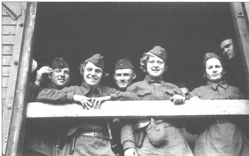
Партизанки та партизани одного з батальйонів перед відправкою до німецького тилу, м. Київ, серпень 1941 р.