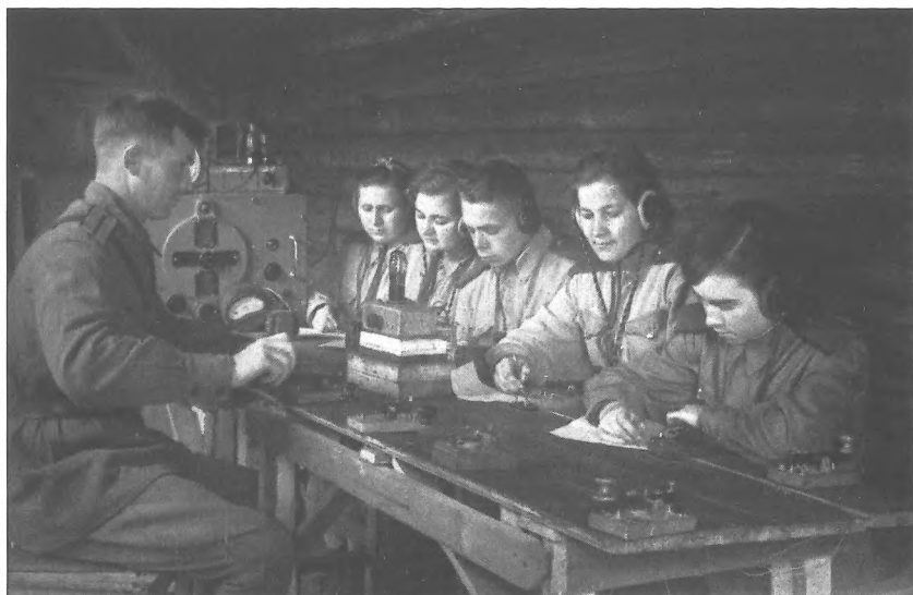
Курсанти-радисти ШОП при УШПР на заняттях з радіосправи, с. Докторовка, Саратовська область, РРСФР, не пізніше 1943 р.