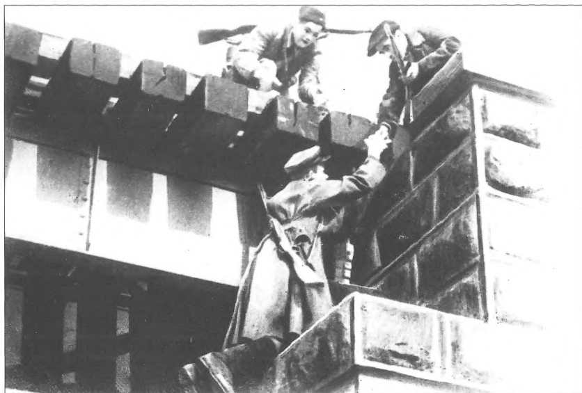
Партизани закладають міну під залізничний міст, серпень 1942 р.