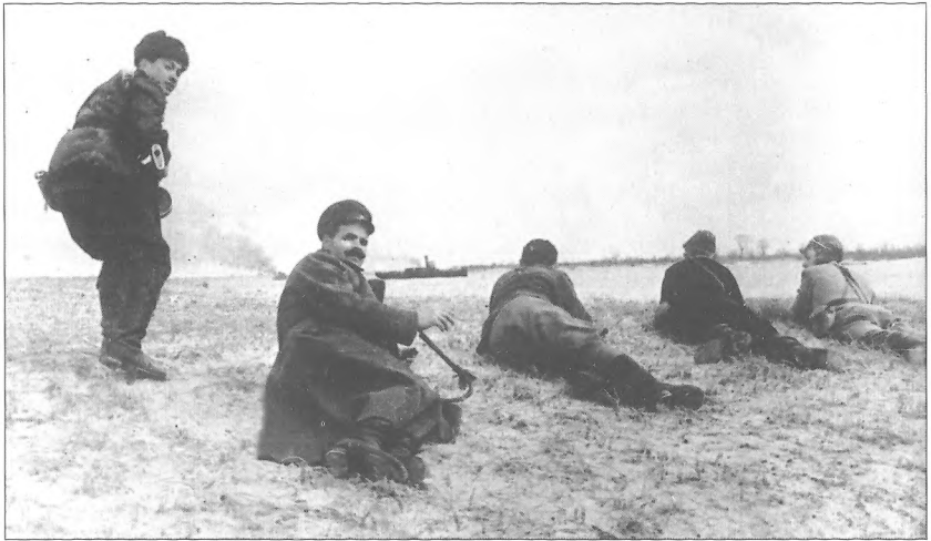
Комісар Сумського партизанського з'єднання С. Руднев з групою бійців на вогневій позиції під час операції на р. Прип'ять, квітень 1943 р.