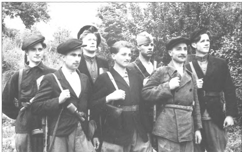
Група партизанів–югославів Житомирського з'єднання, не пізніше 1944 р.