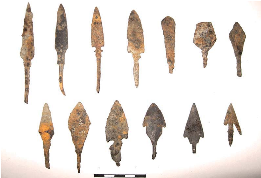
Рис. 2. Наконечники стріл, віднайдені на Чорнівському городищі XIII ст.

ній частині розкопу зафіксовані рештки кам'яного фундаменту від дерев'яної будівлі і розчищена його південно-західна частина. Тоді ж були вивчені три ямних безінвентарних християнських поховання із західною орієнтацією, які перерізали культурні нашарування давньоруського городища. Знайдений матеріал, серед якого і предмети озброєння був датований кінцем XII – першою половиною XIII ст. [23, с. 24-44].