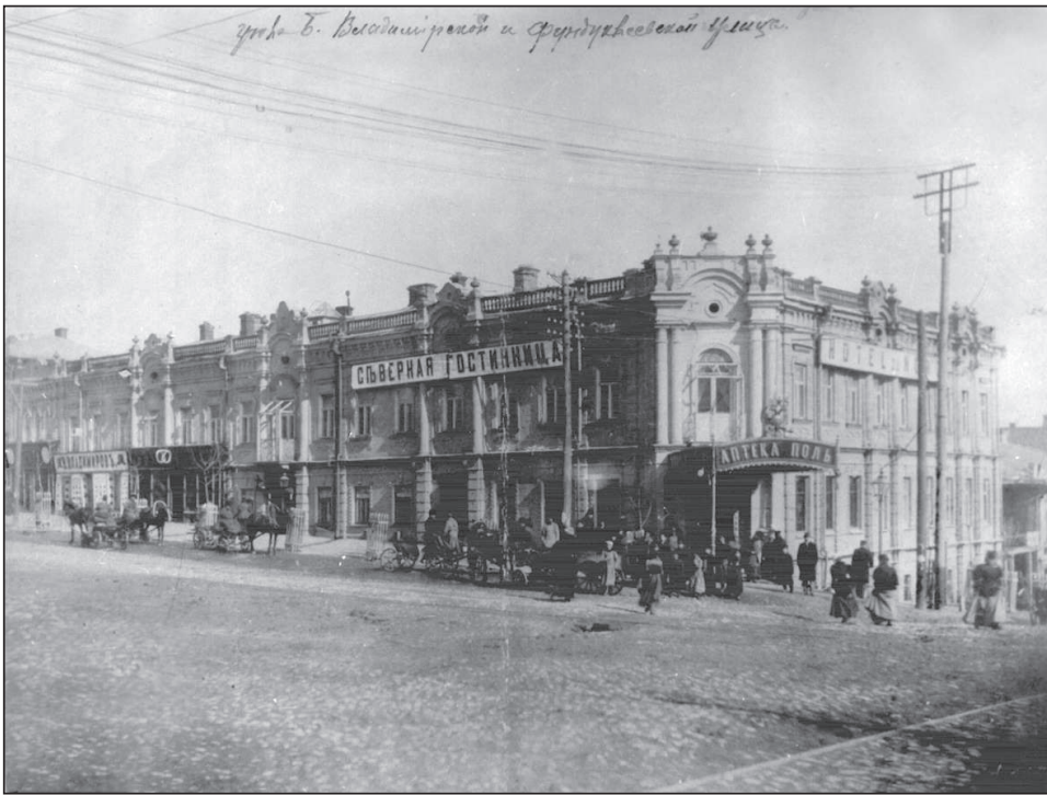
Рисунок 2. Перетин вул. Володимирської і Б.Хмельницького. Світлина к.19-поч. 20 ст.