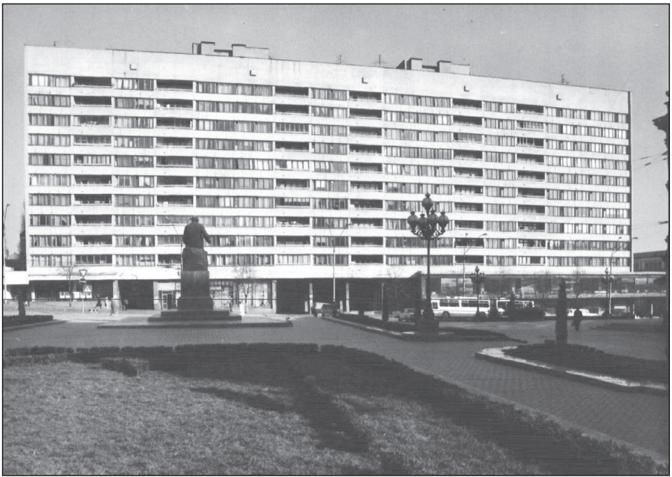
Рисунок 7. Головний фасад. Світлина. 1990 р.

На замовлення Головного управління житлового господарства виконавчого органу Київради у 2006 р. в інституті «НДІпроектреконструкція» почалась розробка проекту капітального ремонту будинку та нового опорядження фасадів.