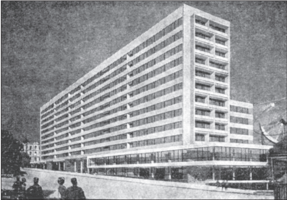
Рисунок 5. Проект будинку. Варіант фасаду. 1968