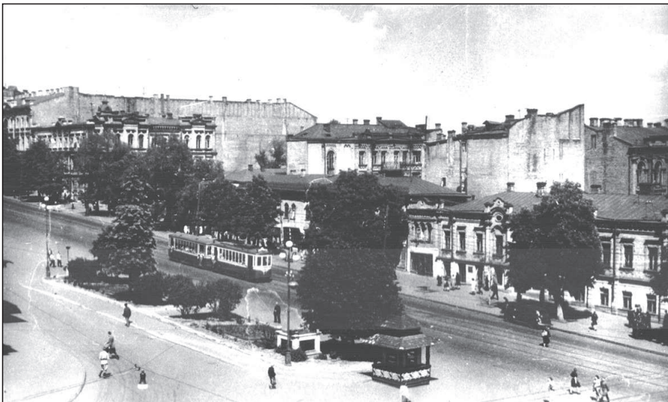
Рисунок 3. Забудова вул. Володимирської проти Оперного театру. Світлина 1938 р.