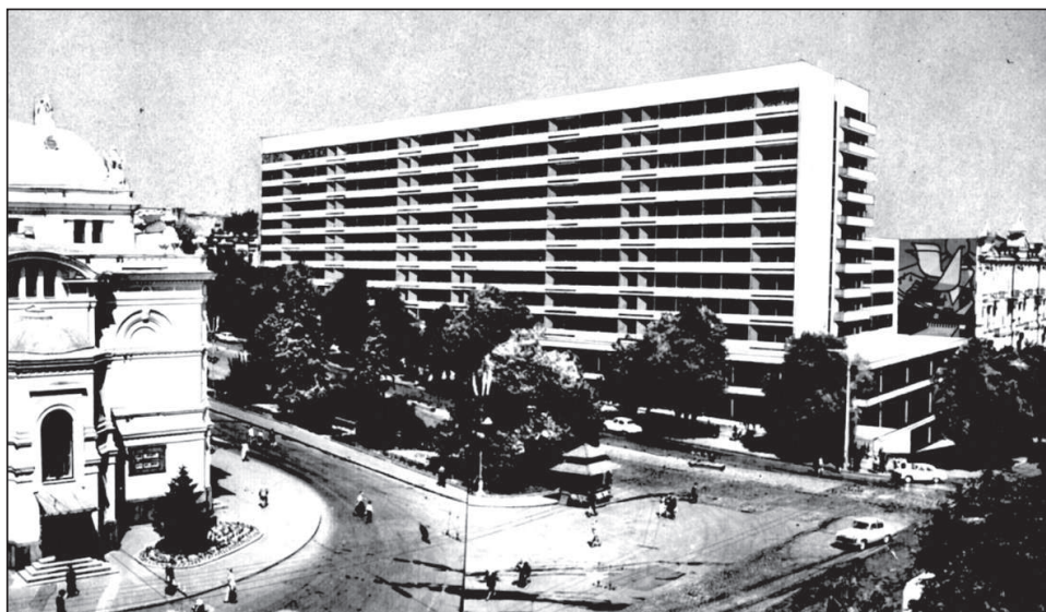
Рисунок 4. Проект. Варіант фасаду. Фотомонтаж. 1963 р.

Крім документальних і графічних матеріалів в архівній справі за 1963-64 рр. є цікава фотографія – монтаж з варіантом головного фасаду (рисунки 4).