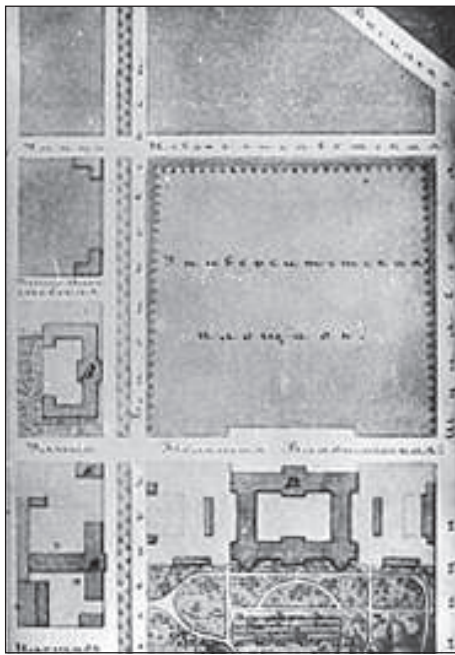
Рисунок 1. План Києва 1871 р. Фрагмент

Застройкою этого места, уничтожается один из значительных притонов преступлений и разврата и увеличится в городе пространство, способное к сооружению жилых зданий. Это обстоятельство имеет особенную важность частью потому, что в настоящее время ощущается недостаток в квартирах, частью потому, что в непосредственной близости площади и без того уже находятся незастроенные места, кои к постройкам не могут быть употреблены: таковы: Ботанический сад и рвы за ним и сад Гимназический. С застройкою пустопорожнего места пред Университетом уничтожается пространство совершенно разобщающее Университетские кварталы с центром города и напротив, в самом центре возникает два лучших квартала, в непосредственной близости учебных заведений. Существующее незастроенное место заключает в себе более 20 тыс. кв. саж. и от продажи его по участкам город мог бы приобрести огромную сумму» [2].