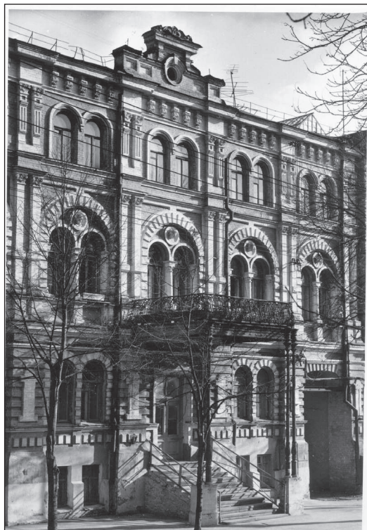
Рисунок 7. Терещенківська,17. Світлина 2002 р.

Будинок (рисунок 7) відрізняється високою культурою архітектурних деталей, що відповідають характеру, пропорціям і образу будинку в цілому, а його образно-стильова система органічно вписується в ансамбль фронтальної забудови вул.Терещенківської і відкритого простору Шевченківського парку.