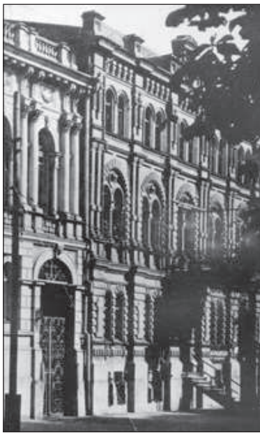
Рисунок 6. Терещенківська, 17. Світлина 1930-х рр.

У власності родини Сахновських садиба знаходилася ще на початку визвольних змагань в Україні: у відомостях фінансового відділу Київської міської управи за березень 1918 р. наводиться перелік житлових приміщень у садибі. У цей час родина домовласниці Є.Н.Сахновської займає 4 квартири в 1, 3, 4 поверхах і в мезоніні – всього 14 кімнат, 2 передпокою, 2 кухні, 5 кімнат для обслуги. У документі вказуються й інші мешканці в будинку, а також кількість займаних ними житлових і службових приміщень. Усього вказано на існування 8-ми квартир, з них дві – на 1-му та 2-му поверхах житлового флігеля [20].