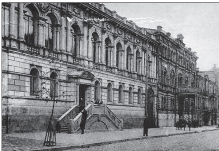
Рисунок 5. Терещенківська, 15, 17. Світлина 1920-х рр.

Пропорції будинку №17 трохи змінилися після нівелювання, зробленої у 1914 р. – рівень вул.Терещенківської на цьому відрізку понизився і під будинком з боку вулиці відкрився високий цокольний поверх. На фотографіях 20-30-х років ХХ в. видно, що спочатку цокольний поверх був глухим (рисунок 5), потім прорубані прямокутні віконні прорізи (рисунок 6).