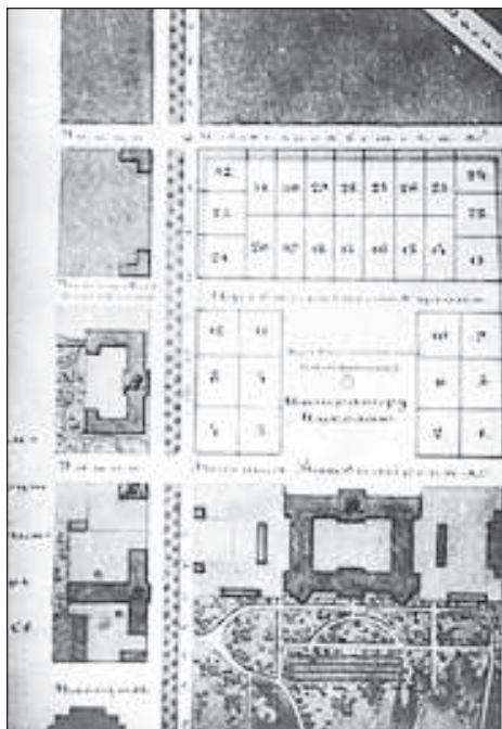
Рисунок 2. Проект пробивки сучасної вул.Терещенківської. 1872 р.

Утворений новий квартал проти університету у межах теперішніх вулиць Терещенківської, Пушкінської, Толстого та бул.Т.Шевченка був розпланований на ділянки (рисунок 2), що їх почали продавати з 1872 р.