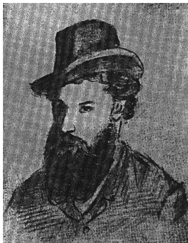
Рис. 1. В. Г. Короленко. Автопортрет, створений під час перебування в Мултані. 1895 р.

У малюнках В. Короленко використовував олівцеві штрихові тіні як для приховування світла, так і для поглиблення контрастності об'єктивних і характерних деталей. Для смислових деталізацій (просвітлення неба, присутність повітря, плинність часу) автор використовував алегорії: світлий трикутник неба, ймовірно, символізує повітря, час і простір як уособлення зіткнення божественного світу з надземним і земним.