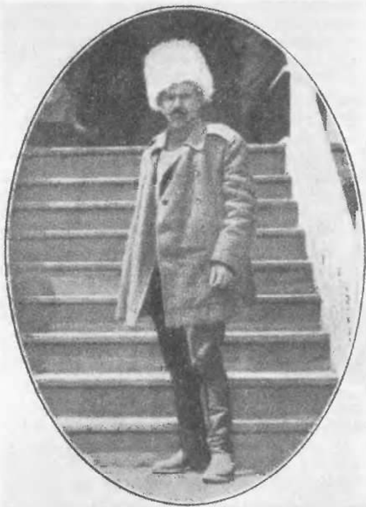
Генерал Марков — найактивніший генерал Добрармії.

Охорона, очевидно, була виставлена, але ні дивізійники з 39, ні інші не наближалися. Ставка розташувалася в ст. Мечотинській. Туди ж переїхав Кубавський Уряд, Законодавча Рада з їхнім апаратом. В Єгорлицькій правив ген. Марков—висококультурна людина, але й великий неділимець. Козаки його любили за військову відвагу й привітність та приступвість. Він був лектором історії в Академії генштабу, був педагогом, начитаним і психологом. Він відразу орієнтувався, про що з ним можна говорити. В. М. під час спокійних переходів з ним їхав поруч і про різне розмовляв.