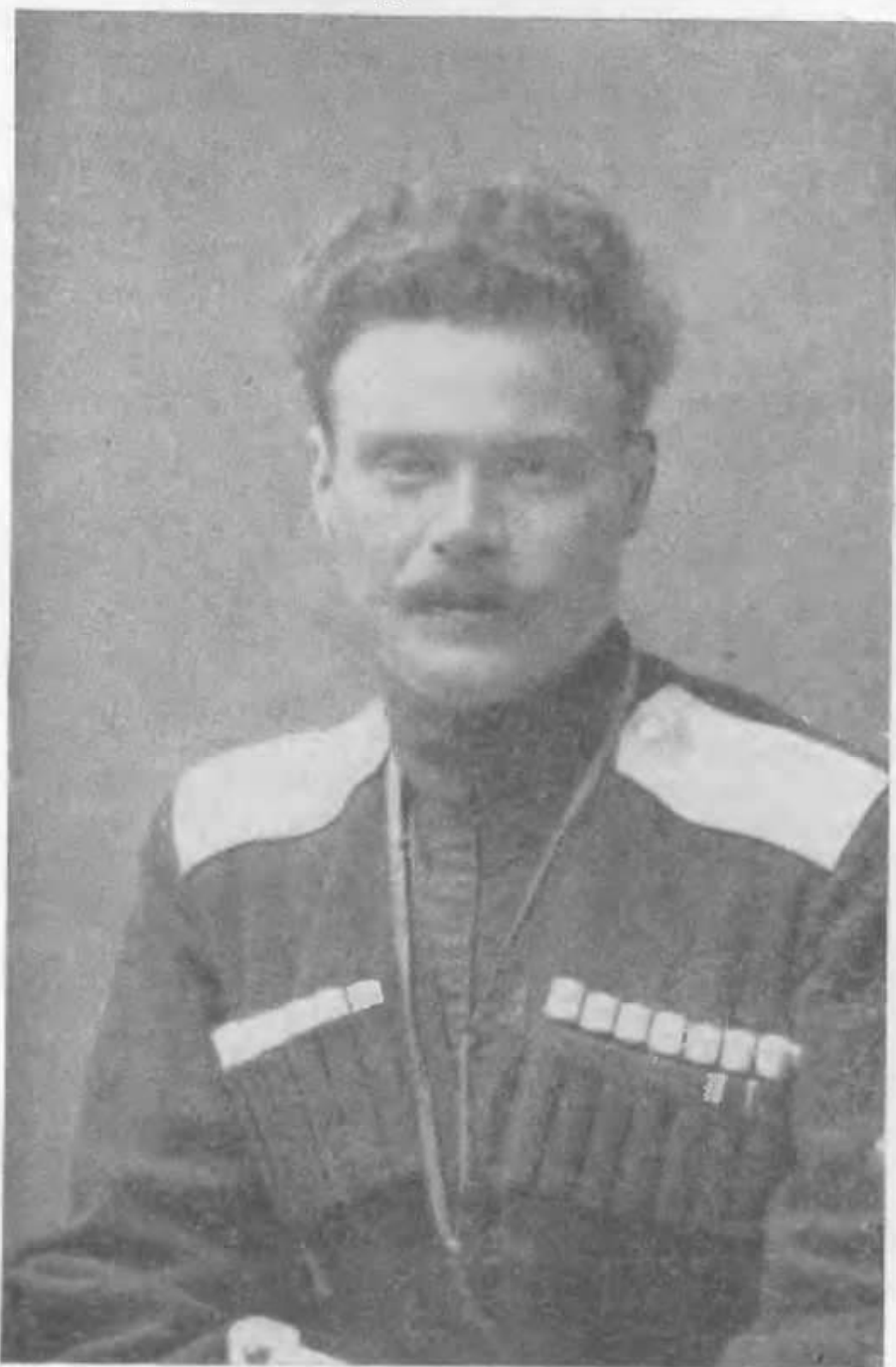
Ген.-лейт. А. Шкуро — партизан Кубанщини

приблизив після реорганізації й постачання йому гармат і технічних частин, розвернути в дивізію, зберігаючи за ним командування“.