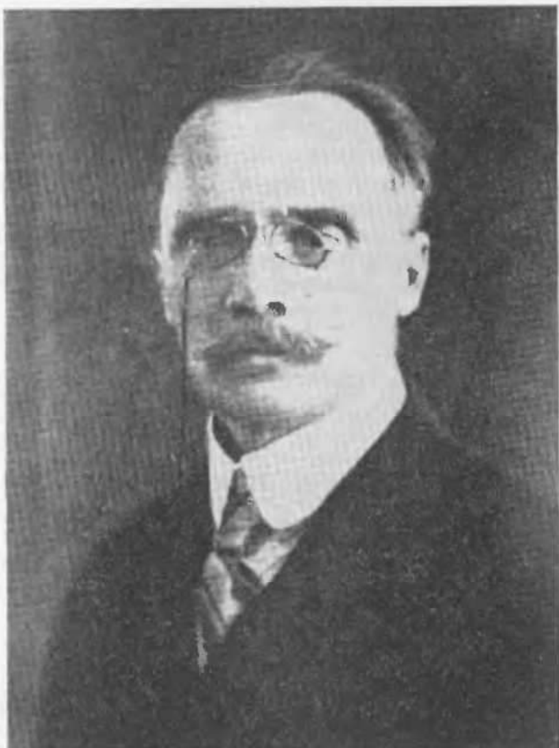
Л. Бич — перший прем'єр, політичний дороговказник Кубані

буде вести важче, тому, що ви будете зруйновані й дезорганізовані. Коли в'ям стане дуже важко, коли ви будете примушені взятися за зброю, ви повинні пам'ятати, що ми існуємо, що ми з нашим відділом дамо вам допомогу.