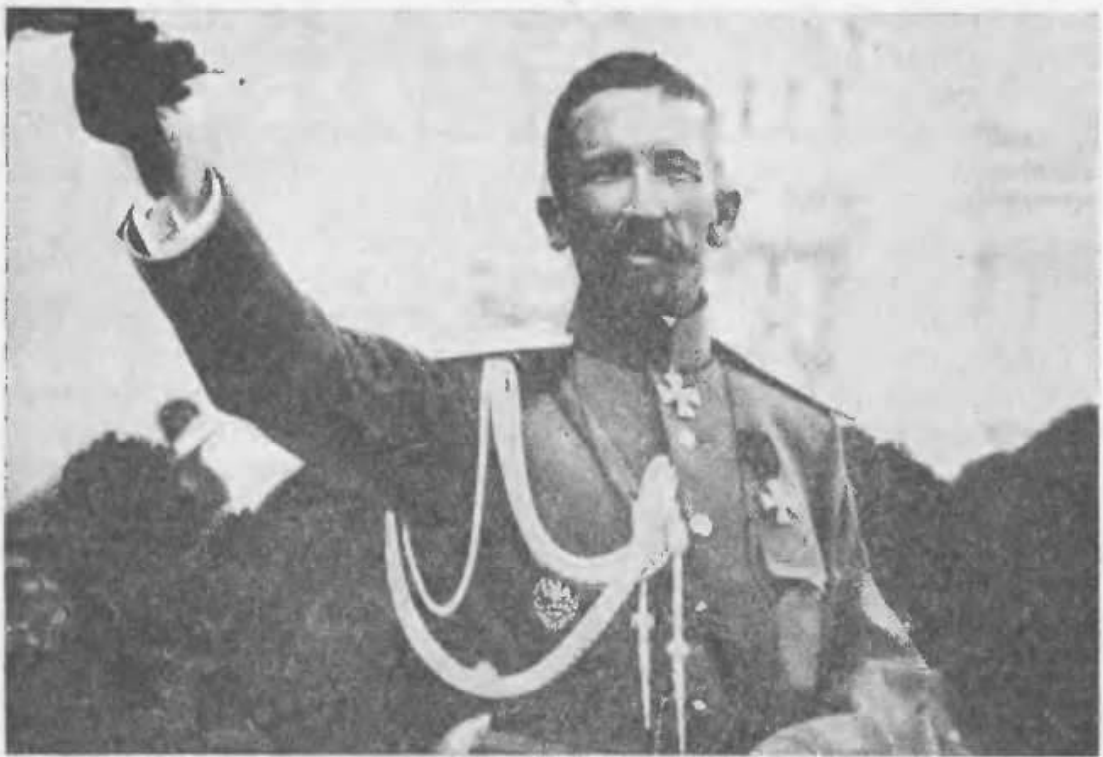
Л. Корнілов — генерал від інфантерії й організатор військової Добровольчої армії, її перший головнокомандувач.

Корнілов сідав на прекрасну булаву кобилицю, боком ристю оминав всю армію і в голові авангарду спішувався і йшов далі пішки. Початок такого маршу супроводився співом: „так за Корнілова, за родину за славу“.. Цей спів майже не вгавав, коли не було боїв. До ст. Хомутовської щось близько 18 км., але по страшному болоті армія ледве рухалася, відриваючи болото. Найтяжче було з гарматами, що вимагали частих зупинок і зчищення багна з коліс. На половині дороги коні пристали. Довелось підпрягати ще по четверикові, лишаючи на якусь годину по гарматі й з набоями скрині, забираючи їх другою турою. При такому способі руху армія доплелася до Хомутовської станиці, коли вже почало темніти. Командарм всю армію пропустив повз себе і останнім зайшов у станицю. Цей порядок дотримувався точно протягом цілого походу.