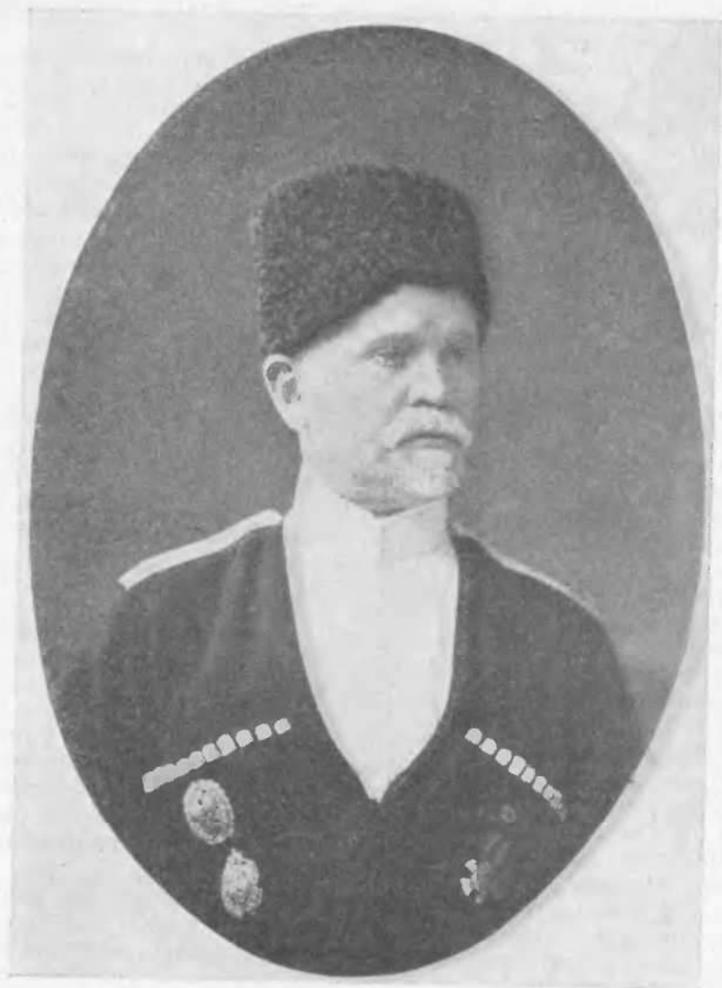
Генерал-лейтенант О. Філімонов — отаман Кубані

Останній — військовий юрист, працював на адміністративних посадах, не нюхаючи пороху. Революція застала його на посаді отамана Лабінського Відділу. Полк. Філімонов був дуже спритний інтриган, без обтяження будь-якими моральними мотивами, ніби росій-