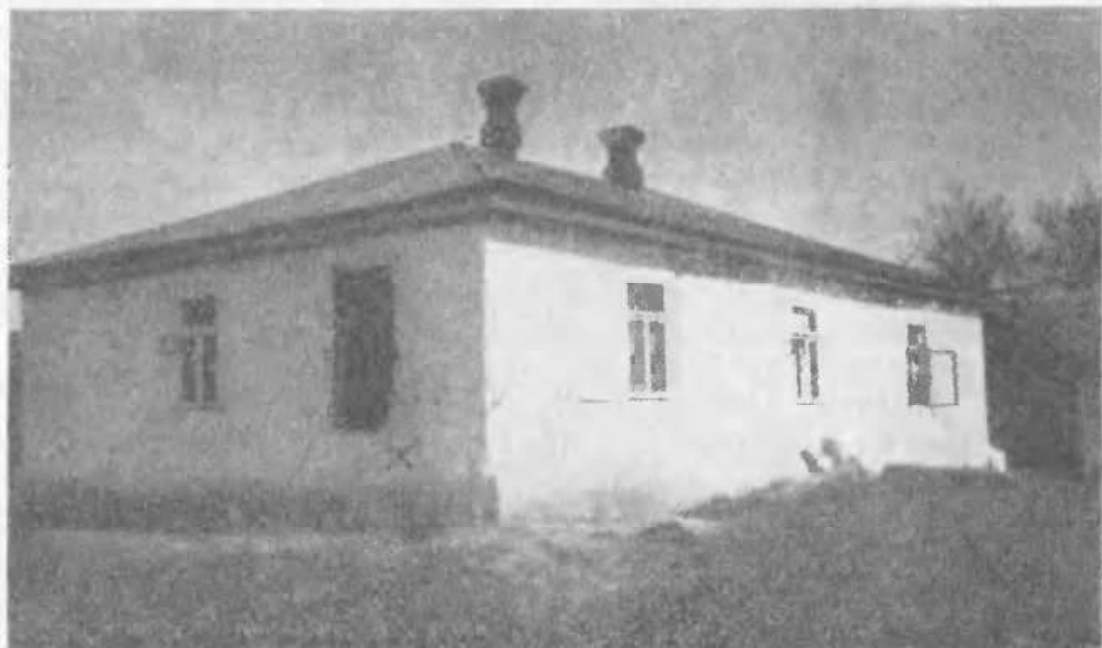
„Фарма“ (X кімната ген. Корнілова)

Тихорецька—Катеринодар, а залишила частину „садів“ на сході міста. Полк Нежінців водив своїх корніловців багаторазово в атаку й різні обходи, поніс великі втрати, а нарешті й сам поліг цього дня. Це була знову тяжка й нелегко замінима втрата. Шанси на перемогу з години на годину маліли. Вояки знесилювалися, але віра у Корнілова не послабла. Вся надія була на нього. Тому,