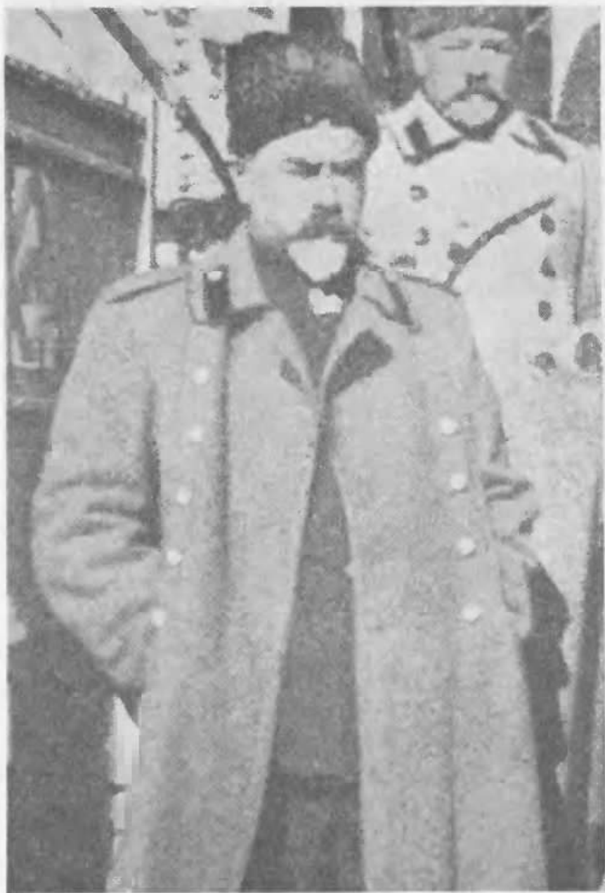
Ген. А. І. Денікін і ген. Лукомецький (Фото до стор. 95)