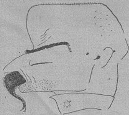
О. Сорохтей Цяпка 1917

Та все те не було ще карикатурою в сьогодніш-