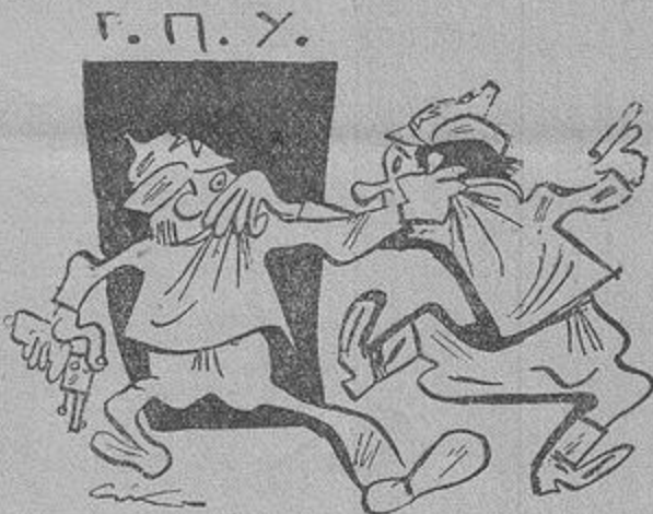
Еко Внутрішня ситуація в Совегах

Карикатура з боку суспільно-пропагандивного має велике виховне значення. Те, що вона в'яжеться щільно з гумором, робить її позитивним явищем з погляду суспільно-виховної гігієни. Карикатура досягла великого впливу на виховання мас. Вона не тільки популяризує ідеї, але й спричинюється безпосередньо до популяризації мистецтва. Музеї бо у своїй більшості масам недоступні — а втім, вимагають підго-