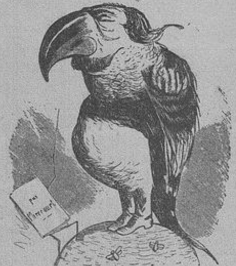
В. Шольц Наполеон III

Зокрема, коли йде про історію української карикатури, то в'яжеться вона з появою перших українських сатиричних журналів, що повставали у другій