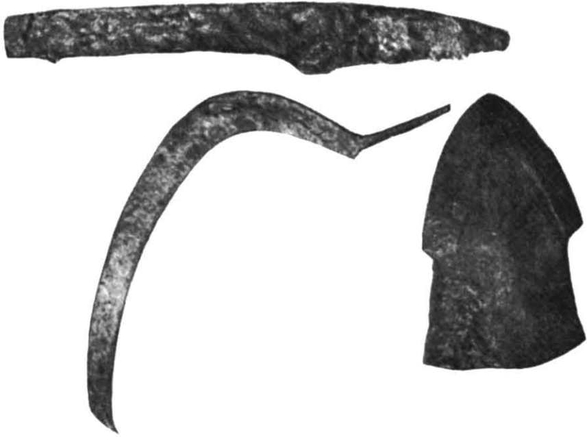
Рис. 3. Сільськогосподарський інвентар (фото).

В заповненні споруди знайдено людські кістки, переважно дитячі. На підлозі, майже в центрі, виявлено три ямки від вертикальних стовпчиків. По всій площі будівлі траплялися ознаки пожежі. Із речових знахідок виявлено фрагменти гончарної давньоруської кераміки, 2 бронзових кільця, риболовний гачок.