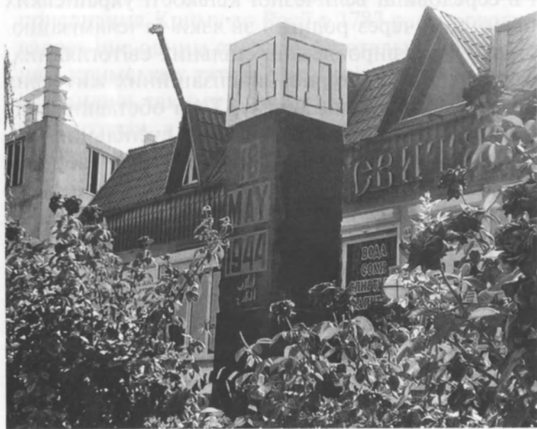
Судак. Пам'ятник депортації кримських татар.

імперської адміністрації. Через те в подальших переписах українців та інші етнічні групи, що перебували в Криму, записували як росіян. Цікаво, що цю імперську тактику інформаційної брехні перехопили згодом більшовицькі лідери і вона закріпилась у них, певно, навічно. Уже за переписом 1921 р. українці і росіяни подані разом — як російське населення, що становило 51,5 відсотка. 35 І так тривало до 50-х років ХХ ст., доки через постійне переселення до Криму росіян їх стало більше, аніж кримських татар, яких і далі продовжували виселяти в різні області Росії.