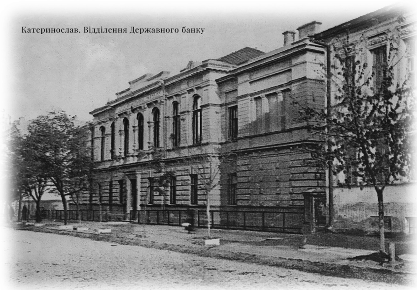
Катеринослав. Відділення Державного банку