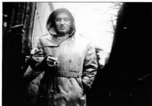
Дощова погода не завдала весті спостереження. Київ, вул. Банківська, після 1960 року.