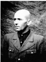
Василь В. Кука, зроблена під час арешту, 23.05.1954 р.

18. Карта топографическая, польского издания Зановического, Олеського, Педкаженицкого и др. районов, Львовской области – 1